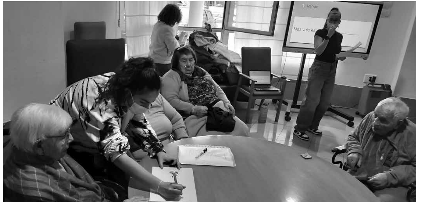
Jugando con los alumnos del IES San Isidro.

El pasado mes de enero realizamos unas jornadas intergeneracionales acompañados por los alumnos del IES San Isidro del módulo de atención a personas en situación de dependencia, y nos propusieron un concurso en el que se realizaban diferentes juegos por equipos. Los juegos consistían en escuchar una canción de su época e identificar al cantante y la canción, reconocer diferentes personajes famosos de su tiempo, adivinar diferentes objetos o cosas mediante un dibujo y terminar diferentes refranes que decían los alumnos. Los alumnos se encargaron de explicar los juegos mediante la pantalla táctil y diferentes tablets que nos