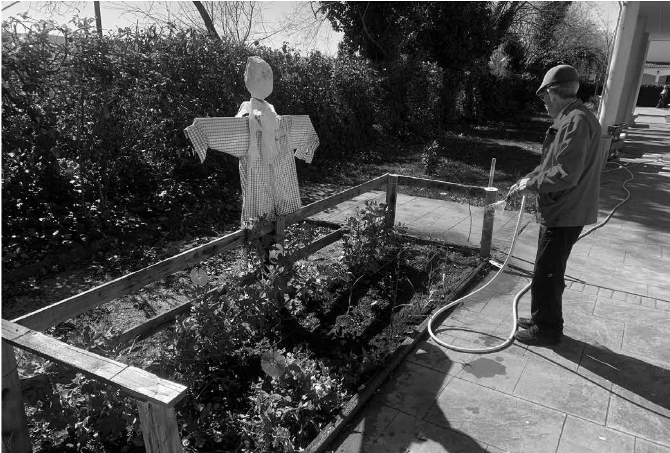
Residente regando el huerto.

El día 3 de marzo, en La Alameda, celebramos el Día Mundial de la Naturaleza. Con el objetivo de conmemorar este día, hicimos trabajos agrícolas para nuestro huerto. Comenzamos trabajando en nuestro semillero, colocando en unos vasos algodón con una semilla dentro y regándola para germinarla. Posteriormente, los colocamos en unas ban-