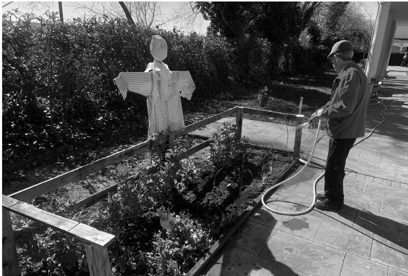
Residente regando el huerto.

El día 3 de marzo, en La Alameda, celebramos el Día Mundial de la Naturaleza. Con el objetivo de conmemorar este día, hicimos trabajos agrícolas para nuestro huerto. Comenzamos trabajando en nuestro semillero, colocando en unos vasos algodón con una semilla dentro y regándola para germinarla. Posteriormente, los colocamos en unas ban-