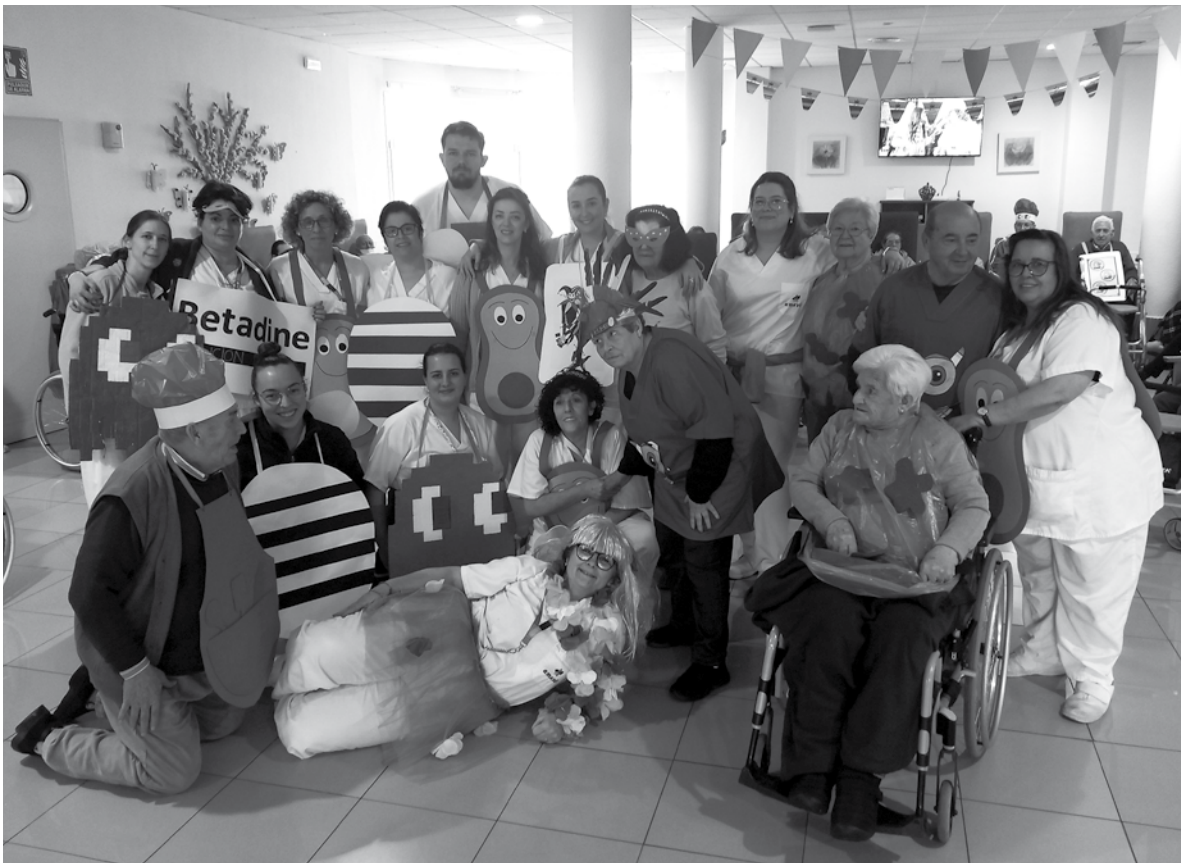
Foto de grupo de nuestros disfrazados.

El viernes 9 de febrero, como todos los años, disfrutamos de la fiesta de Carnaval con nuestros usuarios del centro de día y residentes. Esta es una fiesta de tradición laica que encanta a nuestros mayores. Los disfraces fueron creados en los diferentes talleres y los residentes eligieron distintas temáticas como: aguacate, indios, cartas de la baraja, medicamentos... Además, los trabajadores contribuyeron con su original creatividad a decorar el centro creando un estilo idóneo para esta festividad. La celebración comenzó con un desfile de disfraces desde el comedor hasta el salón polivalente, donde actuamos basados en el disfraz que cada uno se había confeccionado. El acto se amenizó con música de temática carnavalera y con algunos familiares de nuestros residentes, todos juntos cantamos y bailamos pasando un gran momento de reunión y armonía. Espe-