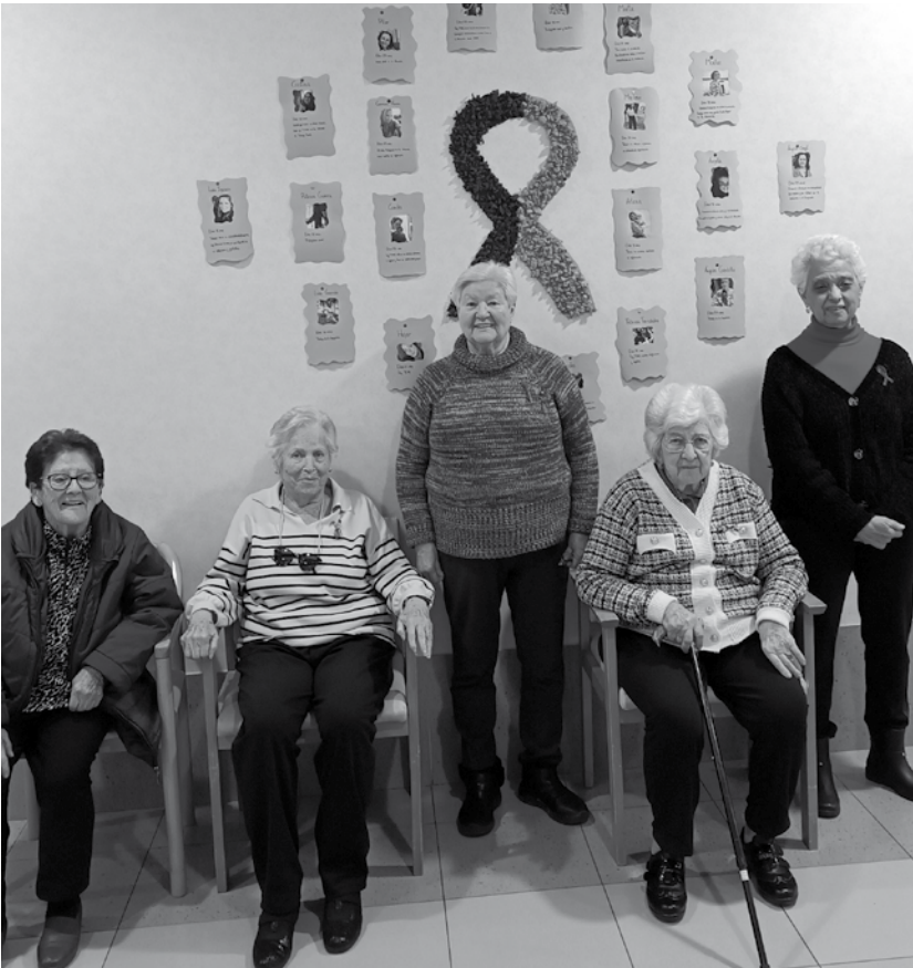
Nuestras residentes con el lazo morado para conmemorar el 8M.

Como cada año, el 8 de marzo es una fecha muy especial, ya que se celebra el Día de la Mujer. En nuestro centro no queríamos dejar de celebrarlo e hicimos un mural donde aparecían fotos de las trabajadoras que quisieron participar, así como un vídeo con frases significativas para conmemorar este día de la mano de nuestros residentes y de nuestros usuarios del centro de día. El mural contó también con la participación de muchos de nuestros mayores, que nos ayudaron a elaborarlo y a hacer el lazo de color morado que pusimos en el centro.