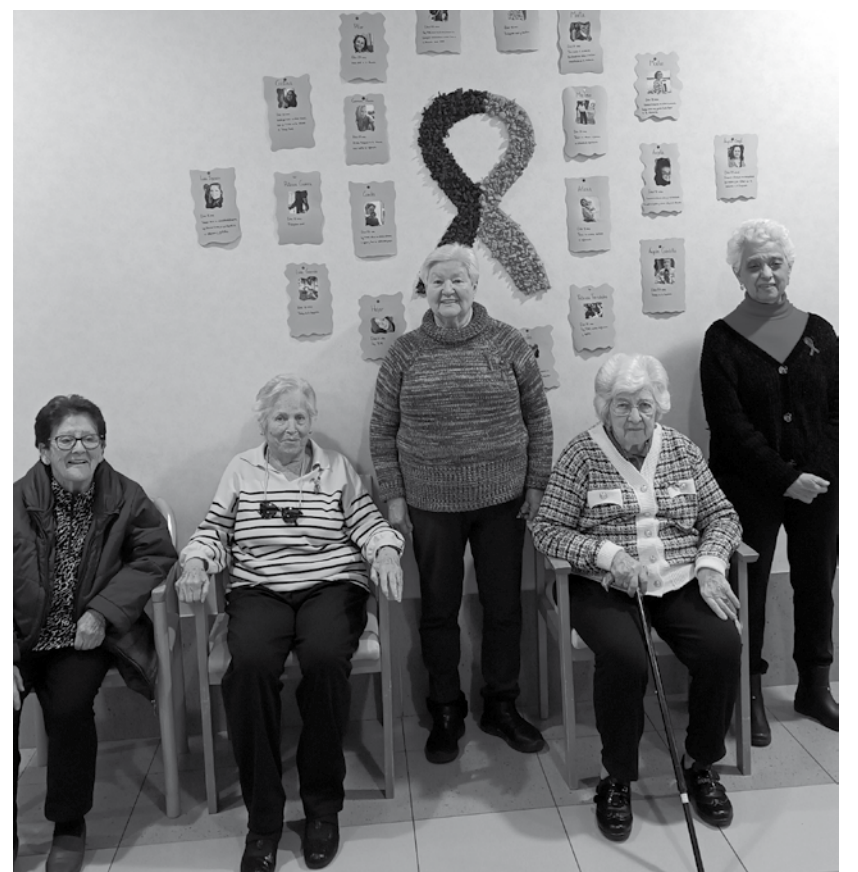
Nuestras residentes con el lazo morado para conmemorar el 8M.

Como cada año, el 8 de marzo es una fecha muy especial, ya que se celebra el Día de la Mujer. En nuestro centro no queríamos dejar de celebrarlo e hicimos un mural donde aparecían fotos de las trabajadoras que quisieron participar, así como un vídeo con frases significativas para conmemorar este día de la mano de nuestros residentes y de nuestros usuarios del centro de día. El mural contó también con la participación de muchos de nuestros mayores, que nos ayudaron a elaborarlo y a hacer el lazo de color morado que pusimos en el centro.