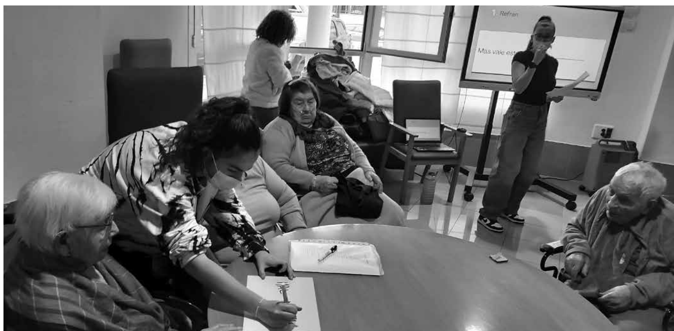
Jugando con los alumnos del IES San Isidro.

El pasado mes de enero realizamos unas jornadas intergeneracionales acompañados por los alumnos del IES San Isidro del módulo de atención a personas en situación de dependencia, y nos propusieron un concurso en el que se realizaban diferentes juegos por equipos. Los juegos consistían en escuchar una canción de su época e identificar al cantante y la canción, reconocer diferentes personajes famosos de su tiempo, adivinar diferentes objetos o cosas mediante un dibujo y terminar diferentes refranes que decían los alumnos. Los alumnos se encargaron de explicar los juegos mediante la pantalla táctil y diferentes tablets que nos