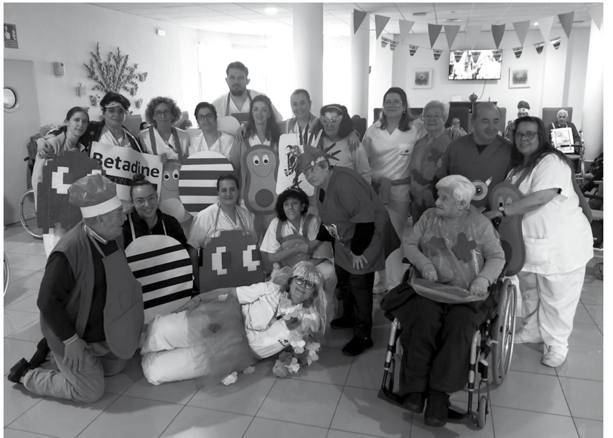
Foto de grupo de nuestros disfrazados.

El viernes 9 de febrero, como todos los años, disfrutamos de la fiesta de Carnaval con nuestros usuarios del centro de día y residentes. Esta es una fiesta de tradición laica que encanta a nuestros mayores. Los disfraces fueron creados en los diferentes talleres y los residentes eligieron distintas temáticas como: aguacate, indios, cartas de la baraja, medicamentos... Además, los trabajadores contribuyeron con su original creatividad a decorar el centro creando un estilo idóneo para esta festividad. La celebración comenzó con un desfile de disfraces desde el comedor hasta el salón polivalente, donde actuamos basados en el disfraz que cada uno se había confeccionado. El acto se amenizó con música de temática carnavalesca y con algunos familiares de nuestros residentes, todos juntos cantamos y bailamos pasando un gran momento de reunión y armonía. Espe-