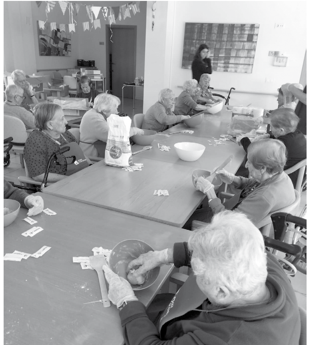
Residentes preparando las ricas galletas que se repartieron en San Valentín.