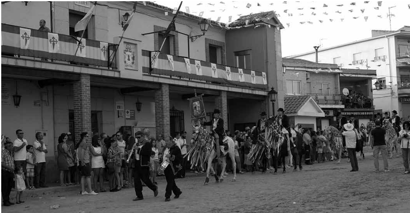
Carpio de Tajo en fiestas.