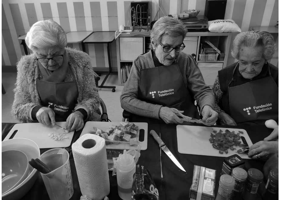
Taller de Masterchef con FDI.

Desde el año 2020, son muchos los grupos de personas que han contactado con nosotros para hacer acompañamientos y actividades en Amavir Getafe con los residentes. Ya incluso en 2019 empezamos a trabajar con un grupo de estudiantes universitarios a través del programa DUPLO, que tuvo una gran acogida y que sigue siendo un espacio muy apreciado por los residentes. De hecho, hace poco vino la cadena SER al centro para hacer una entrevista a los participantes y monitores del programa. Pero han sido muchos más los que han tocado a nuestra puerta. Adopta un Abuelo, FDI o la Fundación La Caixa proponen también actividades en las que nuestros mayores interactúan con personas más jóvenes. Adopta un Abuelo es un importante programa de gran repercusión en nuestro país, concretamente, en el centro realiza acompañamientos a residentes