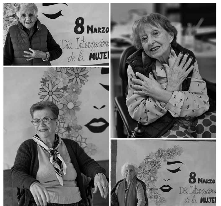
Actividades del Día de la Mujer.

El pasado 8 de marzo celebramos el Día Internacional de la Mujer, cuyo objetivo es visualizar la lucha que llevan las mujeres desde hace muchos años con el fin de participar en todos los ámbitos de la vida igual que los hombres. ¿Y qué mejor forma de celebrar ese día que cuidándonos y mirándonos un poco? Pues así lo hicimos. Realizamos un taller de belleza donde nos maquillamos y pintamos las uñas para sentirnos más guapas aún. Nos gustó tanto, que no dudamos en repetir nuestra sesión de belleza de vez en cuando. Con anterioridad, realizamos un taller de flores pintadas de color morado, color representativo del Día de la Mujer y así visualizar este día con un bonito mural.