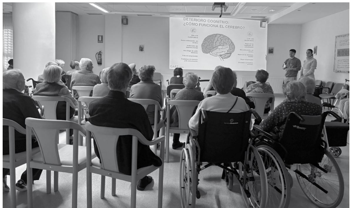
Nuestros residentes durante la charla.

El pasado 22 de febrero, profesionales de la compañía GAES vinieron al centro para impartir una charla sobre prevención y salud auditiva. Una trabajadora social y dos audioprotesistas informaron a trabajadores, residentes y familiares sobre el proceso y las consecuencias de la pérdida de audición y la importancia de cuidar nuestros oídos para prevenir problemas auditivos. Además, nos mostraron las diferentes posibilidades que nos pueden ofrecer desde su compañía contando con apoyo económico para ayudarnos a reducir el coste de los productos.