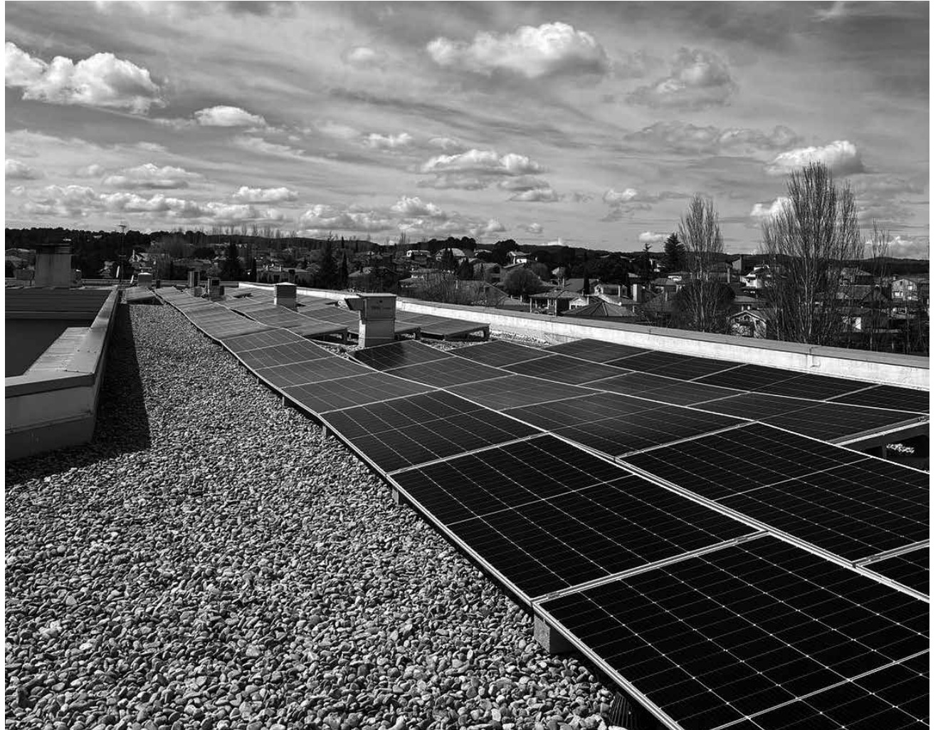
Las placas solares de nuestra azotea.

Como sabéis, en Amavir apostamos por el cuidado del medioambiente. En el centro ya contamos con una caldera de biomasa (pellet), que hace que tengamos una temperatura estupenda sin contaminar lo más mínimo. Igualmente, y desde hace unas semanas, ha cambiado nuestra forma de suministrarnos electricidad, nuestra azotea se ha llenado de placas solares. De esta forma, somos cada vez más sostenibles utilizando energías limpias. Este centro también hace segregación de residuos, tenemos varios contenedores de diferentes colores, amarillos, azules y marrones, para el plástico, papel y orgánico. Además, también segregamos los cortopunzantes, las pilas, las luminarias y con esto cerramos el círculo de sostenibilidad. Asimismo, este año celebraremos días relacionados con la protección del planeta, como por ejemplo el Día del Reciclaje, el Día del Agua, el Día Verde, el Día del Árbol, el Día de los Animales en los que realizamos actividades y juegos todos juntos en el jardín del centro.