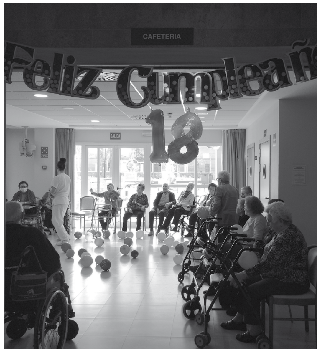
Celebración del aniversario del centro.

El pasado jueves 14 de marzo, nuestro centro cumplió 18 años, su mayoría de edad. Parece mentira que ya llevemos 18 años prestando atención y cuidados a nuestros mayores. Muchas son las personas: residentes, familiares y trabajadores que han pasado por nuestro centro, y que entre todos han hecho posible el cumplir 18 años. Para festejarlo, celebramos varias actividades que hicieron de ese jueves un día muy especial. Por la mañana, celebramos una yincana con paracaídas, bolos, aros, pelotas y un trivial con premios sorpresa. Ambas actividades gustaron mucho, ya que fueron adaptadas para que pudiesen participar todos los interesados. Además de pasar un rato muy agradable, nos hicieron divertarnos, movernos y trabajar las habilidades cognitivas tan necesarias en nuestro día a día. Después, tuvimos un menú especial, que siempre es bien recibido. Ya por la tarde fue el turno de invitar a los familiares a nuestro ya tradicional bingo con merienda, y así poder disfrutar de esta actividad acompañados de nuestros seres queridos. Solo nos queda el poder seguir día a día trabajando y aportando lo mejor de cada uno de nosotros para, entre todos (usuarios, familiares y trabajadores), poder cumplir otros 18 años más prestando un servicio tan necesario y humanizado.