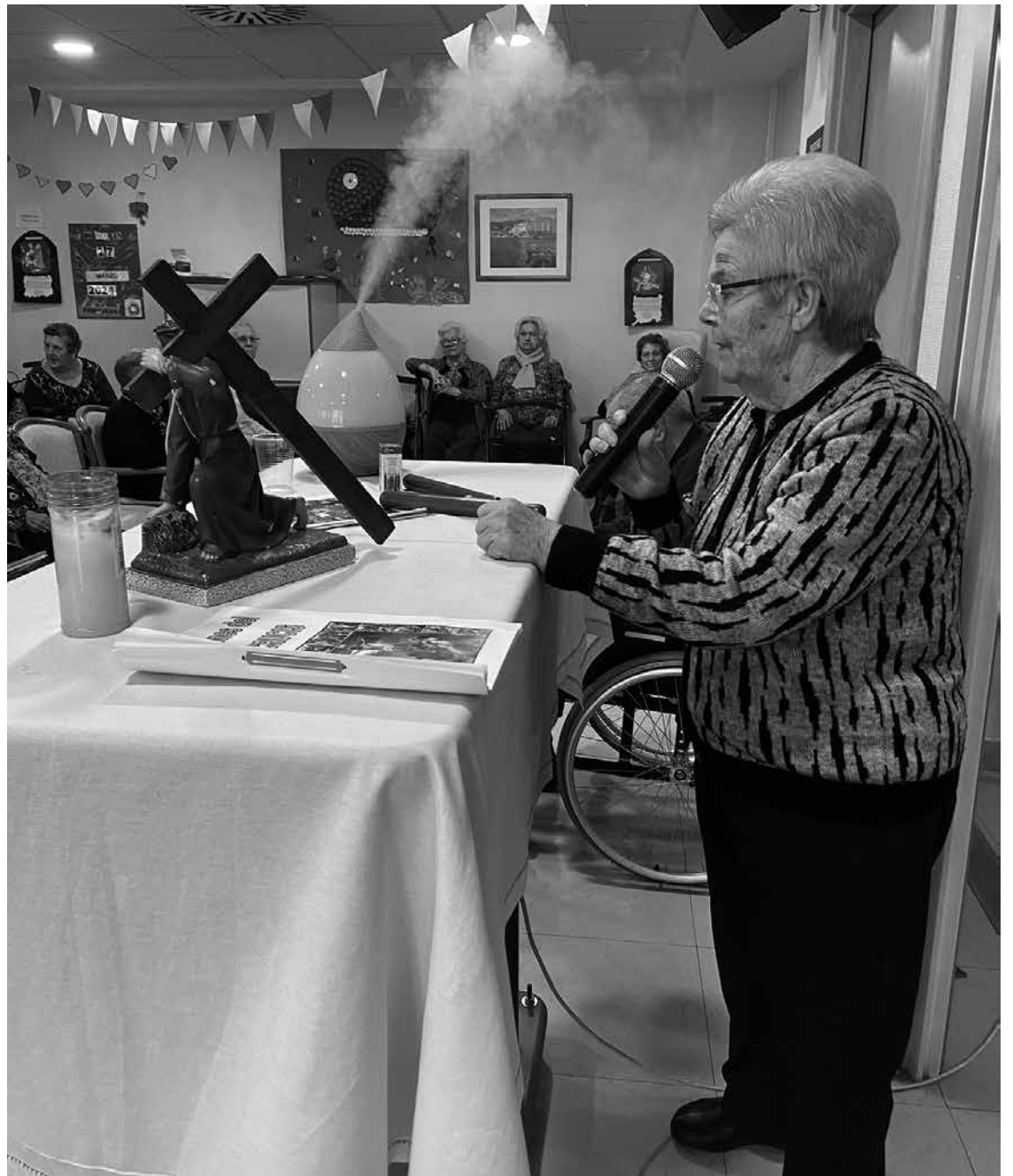
En nuestro Via Crucis.

Como cada año por Semana Santa, en nuestra residencia recreamos un Via Crucis con la participación de los residentes y usuarios del centro de día. El Via Crucis o también conocido como “camino de la Cruz” o “vía dolorosa” representa el recorrido que siguió Jesús de Nazaret desde el Pretorio (estancia del procurador romano Poncio Pilato), su crucifixión y sepultura. Se recrean las catorce estaciones por todo el salón polivalente con imágenes pintadas por ellos y los voluntarios que lo desean, sean residentes, trabajadores o familiares, van leyendo en cada una de las estaciones, mientras que los demás escuchan atentamente y hacen sus rezos. Se trata de una actividad que gusta mucho a todos, y en la que se logra una gran participación de ellos, ya que como nos comentan, cuando eran más jóvenes se trataba de una tradición y no solían faltar a la cita.