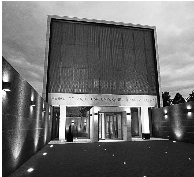
Museo de arte contemporáneo.

El Museo de Arte Contemporáneo Infanta Elena se inauguró en 2011. Con una superficie de 1700 metros cuadrados repartidos en 4 plantas, alberga la colección permanente que la Cooperativa Virgen de las Viñas ha ido adquiriendo a lo largo de los años a través de los diez certámenes de pintura que ha organizado, además de muestras puntuales. Es considerado uno de los museos más importantes de Castilla-La Mancha y ofrece al visitante una extensa colección de obras de arte contemporáneo, la cual se ha creado gracias al Certamen Internacional de Pintura, certamen que fue creado a través de los Fondos de Educación y Promoción de la Cooperativa-Almazara Virgen