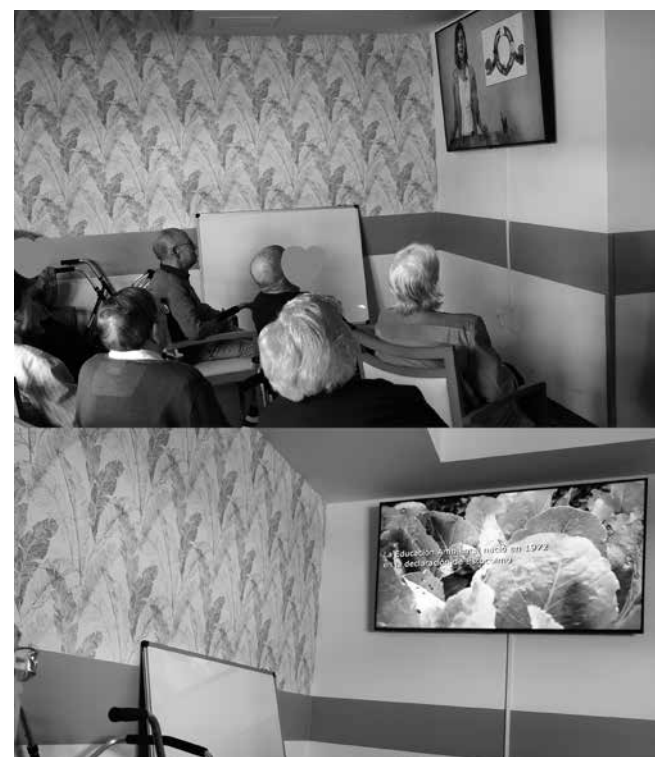
Usuarios durante la proyección de los vídeos.

ambos vídeos e intercambiar opiniones, se realizó una dinámica donde nuestros residentes tuvieron que clasificar actos de la vida cotidiana en base a reducir, reutilizar o reciclar. Por ejemplo, “apagar aparatos eléctricos mientras no son utilizados, o crear un joyero con una caja de bombones”.