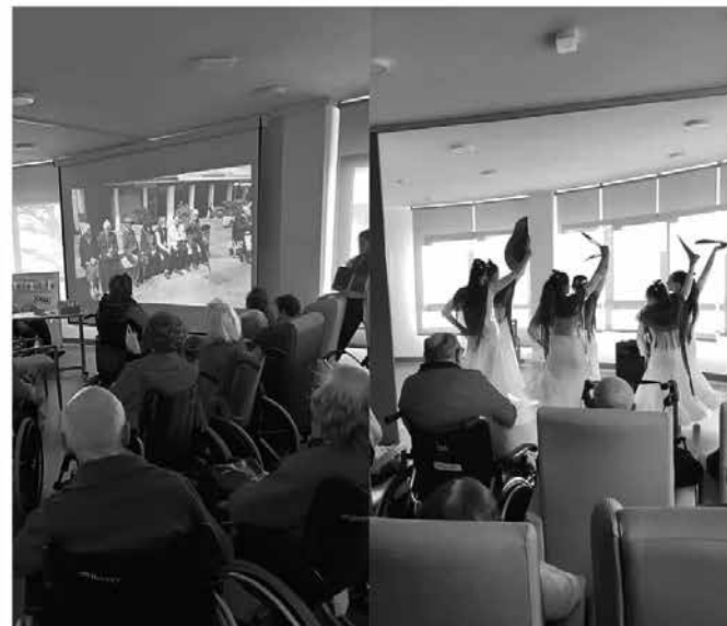
Algunos de los momentos durante la celebración del aniversario.