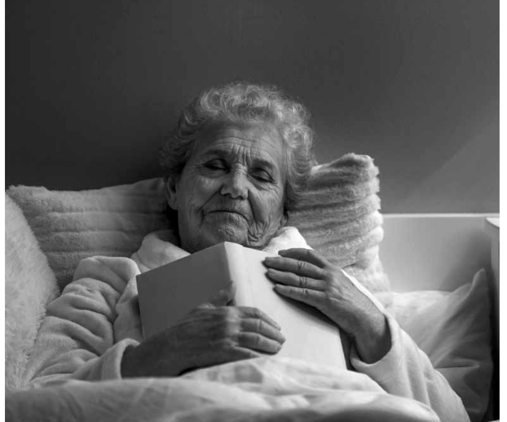
La importancia de un buen descanso nocturno.

Las noches se pueden hacer muy largas cuando no conseguimos dormir. Hay veces que es inevitable despertarse: una visita al baño, un mal sueño... Aún así, muchas veces el insomnio se debe a nuestros hábitos diarios. Por eso, os traemos algunos consejos para que lleguéis a la cama deseando dormir. Lo primero: intentar ser activo durante el día. Si participamos en las actividades diarias, llegaremos a la noche con más sensación de cansancio y será más fácil conciliar el sueño. No importa que no puedas realizar alguna, lo importante es mantener el cuerpo y/o la mente activos. Lo segundo: respetar el horario de sueño. ¡Es más difícil dormir de noche cuando la siesta se va de las manos! Aunque puede apetecer una siestecita a media mañana, es mejor intentar espabilarse durante ese rato para poder dormir mejor después. Lo tercero: nada de grandes emociones a última hora del día. Es recomendable evitar ver películas o series muy moviditas, dedicarle mucho tiempo al teléfono, o pensar en problemas y recuerdos pasados. Una mente despejada