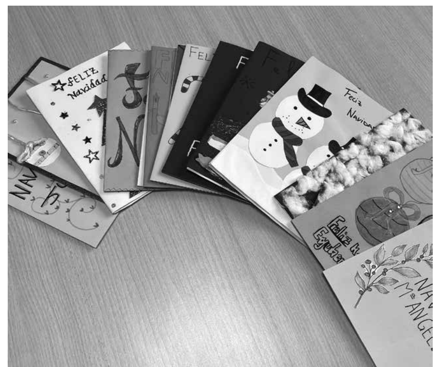
Postales navideñas enviadas por alumnos del IES Mendillorri.

Entre los meses de diciembre y febrero realizamos un intercambio de correspondencia entre el alumnado del IES Mendillorri y nuestros residentes. Los alumnos y alumnas enviaron felicitaciones navideñas, en las cuales volcaban sus ilusiones, proyectos y emociones a modo de presentación para la persona residente a la que la dirigían. Les correspondimos y cada residente respondió a su emisor desconocido. El objetivo no ha sido otro que el de un intercambio generacional desde lo emotivo y personal, para intercambiar experiencias vitales y conocer que no solo las personas que tenemos más cerca nos pueden brindar ilusión y cariño. Esperamos que este primer contacto se pueda materializar con un encuentro en nuestra residencia, en el que el conocimiento pase de la correspondencia a lo presencial.