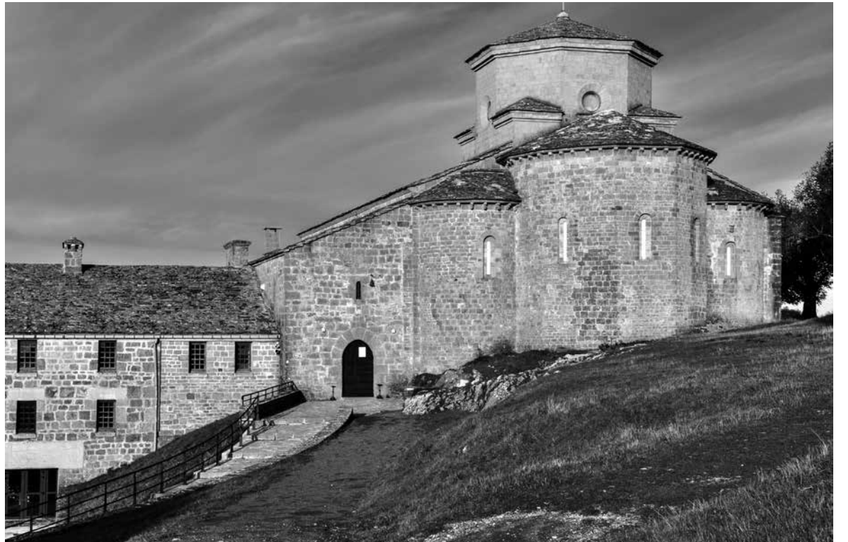
San Miguel de Aralar.

Lakuntza es un pueblo que siempre ha tenido empresas. Antes de la guerra nos dedicábamos al campo y a las fábricas. Tenemos dos fiestas: la de San Sebastián, el 20/01, que consiste en ir a la ermita andando y poner música. El coro canta canciones típicas. Se hace un fuego, y se fríe la chistorra, y dan vino, chocolate y piperopille, que son tortas típicas. Como las mujeres no podían pretender a un hombre, esta era una forma de ofrecerse, dándole una de estas tortas. Era una forma de declaración. Después, se anda casa por casa, los chicos para buscar a las mozas, hasta llegar a la estación. La otra fiesta son las ferias del pueblo, el último domingo de agosto. También se hace una subida a San Miguel, conocida como Lakuntzako pertza. Se sube con morcillas y se celebra la misa con el coro. Después las danzas y las morcillas se dejan allí y echan los cohetes. Según la leyenda, se subía con un palo y un caldero con morcillas. Y en una ocasión, uno de esos calderos cayó rodando, dándole en el ojo al molinero de Huarte Araquil.