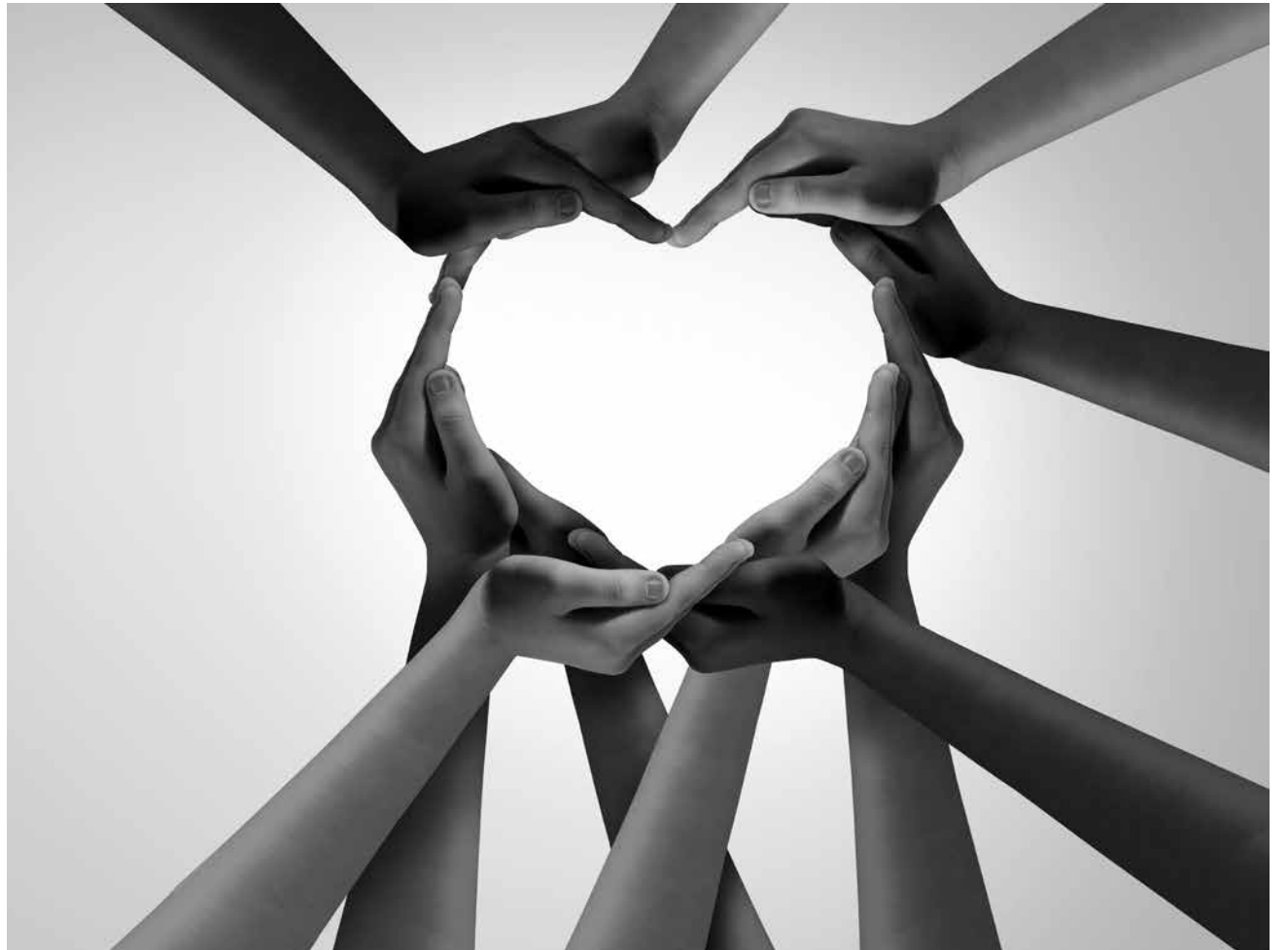
Atención Centrada en la Persona.

La Atención Centrada en la Persona (ACP) no es solo un modelo de intervención sociosanitaria, sino que responde a una forma de entender el cuidado. Poniendo en el centro a la persona residente, el resto de las personas pilotamos a su alrededor para tratar de conformar el mejor escenario posible conforme a sus circunstancias, deseos, historia vital y preferencias. Se trata de un modelo que rompe con lo asistencial para dar paso al protagonismo y participación directa, una manera de afrontar el cuidado y la atención sociosanitaria en nuestra residencia que requiere de un equipo fuerte y cohesionado. Así que nos exige a nivel profesional un esfuerzo extra y afrontar nuestra cohesión. Sin ello, es imposible poder llevar a buen puerto una atención centrada en la persona eficiente. Aprovechamos para animar también a nuestras familias y visitantes para integrarse en este modelo relacional de cuidado y atención.