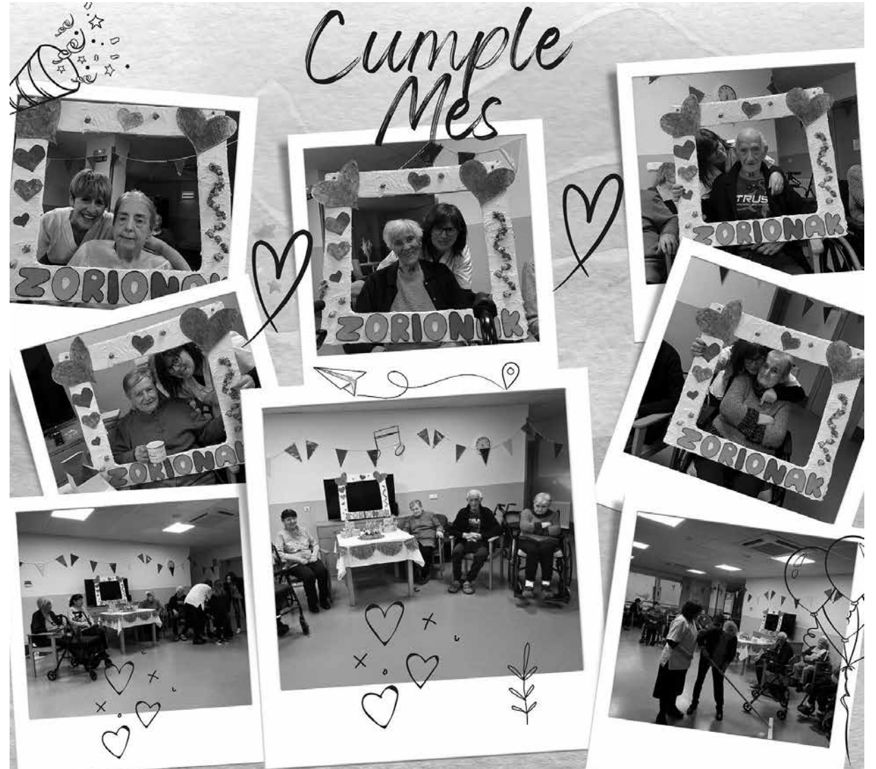
Algunas de las celebraciones de cumpleaños.

Durante los últimos meses hemos disfrutado de diferentes celebraciones en nuestra residencia, algo que es muy importante para la vida y convivencia. A la par, esto nos hace compartir momentos con nuestro entorno comunitario, familias, visitantes y equipo profesional. Celebramos Santa Águeda en la que el pueblo de Betelu nos volvió a ofrecer una buena matiné. También disfrutamos de los Carnavales y de la alegría que entrañan en nuestra villa. Llegamos al 8 de marzo con la elaboración de nuestro propio mural reivindicativo, acompañado de un trabajo de reflexión y debate muy interesante. Además, recuperamos nuestras tradicionales celebraciones mensuales de los cumpleaños del mes. En estas no solo realizamos nuestro particular photocall, sino que pudimos ofrecer un pequeño regalo a modo de detalle a los homenajeados del día y disfrutamos de encuentros, música y juegos. En definitiva, una alegría por seguir cumpliendo años y por hacerlo en compañía.