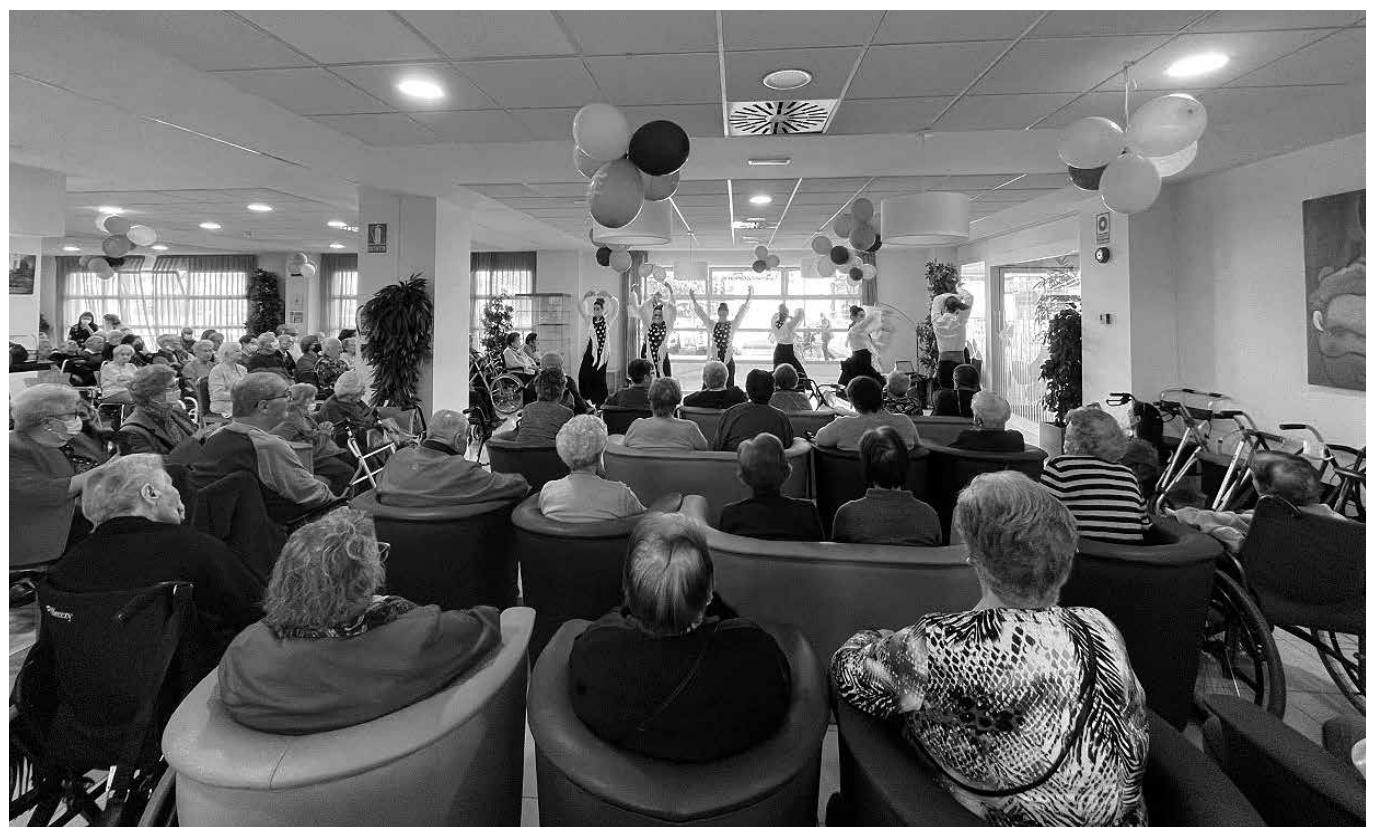
¡Por nuestros 17 años!

Durante estos 17 años nuestro centro se ha convertido en la casa de nuestros mayores y en un lugar de tranquilidad y confianza para sus familias. Por ello, queremos felicitaros un año más y daros las gracias por dejarnos compartir junto a vosotros estos momentos. En estos años han sido muchas las familias y mayores que han pasado por aquí, muchas historias para contar y, sobre todo, muchos y buenos recuerdos. Queremos seguir mejorando día a día y que sigáis formando parte de nuestra gran familia. Para festejar esta fecha tan especial para la residencia, nuestro 17º aniversario, comenzamos con una actividad que nos trajo muchas sorpresas. Recreamos el programa “Allá tú” con el que maravillamos a nuestros residentes con re-