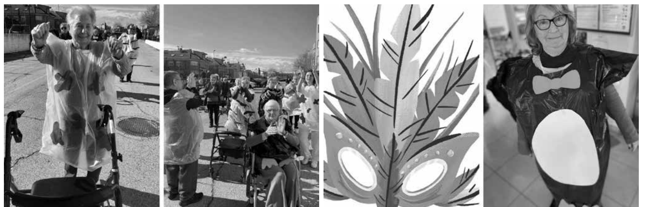
Repartiendo alegría a través de la música, el baile y el color.

¿Cuál es el verdadero significado del Carnaval? Lo que nos transmite a cada uno de nosotros son días de música y color. Es la celebración de la celebración, es juntarse a festejar la alegría y a aplaudir la emoción. En nuestro Carnaval crea-