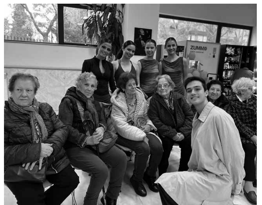
En el conservatorio Carmen Amaya.

A finales de año, fuimos invitados al espectáculo que el Conservatorio Profesional de danza de Carmen Amaya ofreció en estas fechas. Quedamos encantados con las actuaciones de los más pequeños y los jóvenes que están acudiendo a clases para aprender a bailar, nos gustó muchísimo. Tras la actuación pudimos disfrutar de un encuentro intergeneracional que tenían preparado. El conservatorio lleva más de 20 años al servicio de la enseñanza de la danza en Madrid en el distrito de Villaverde y celebran actuaciones tanto en el propio auditorio como fuera de él. Desde nuestro centro de Amavir Villaverde estamos felices de saber que cuentan con nosotros para poder formar parte de su público fiel.