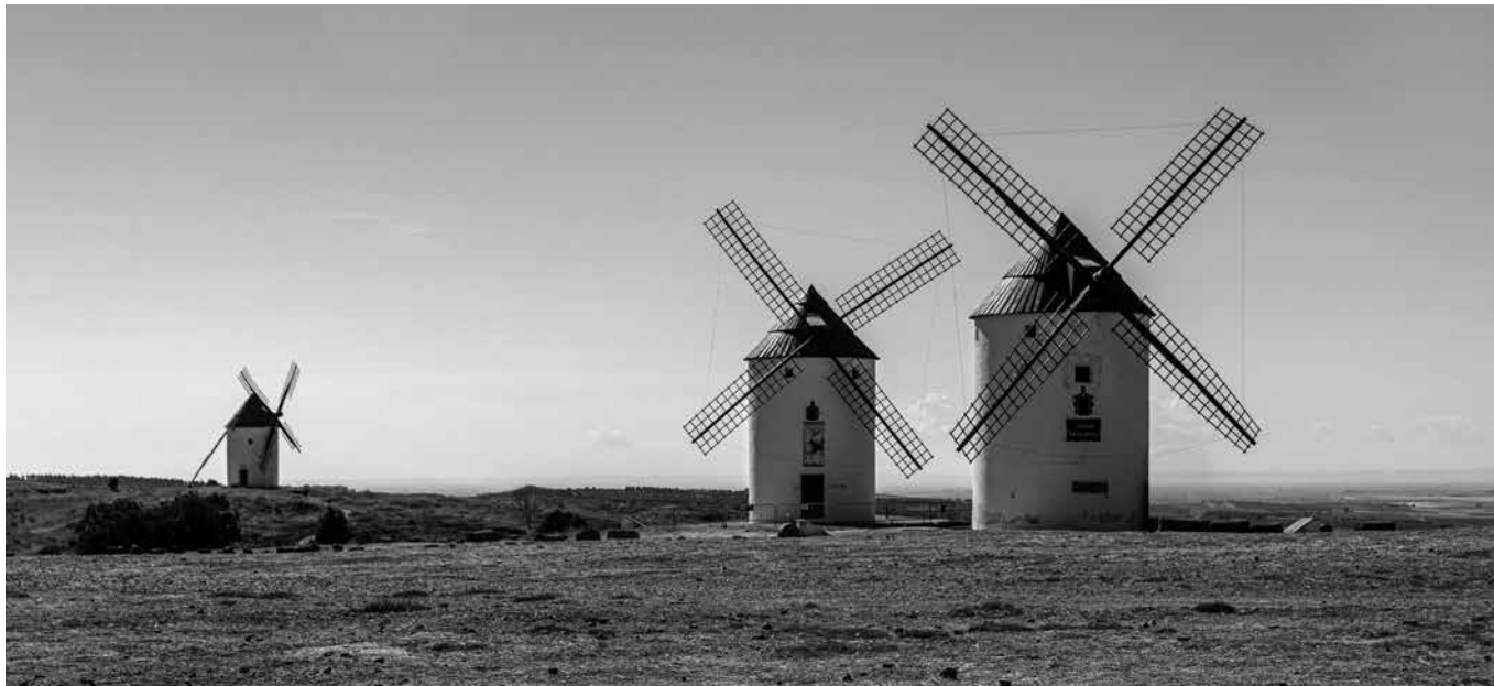
Molinos de Tomelloso.