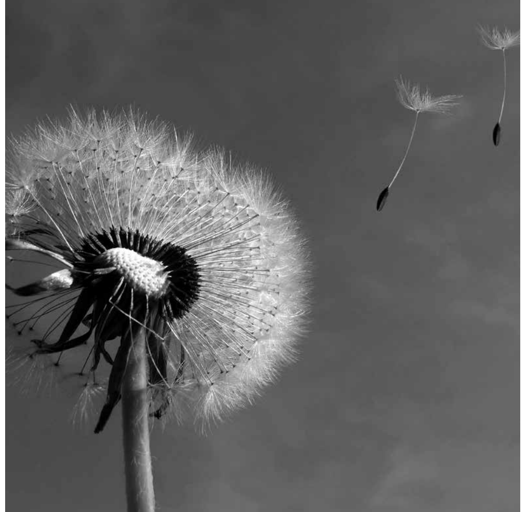
Diente de león.