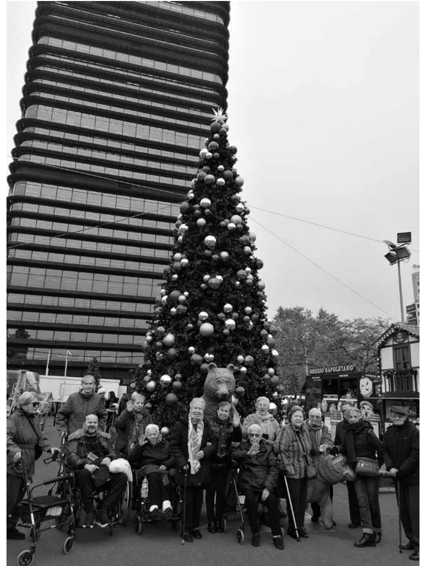
En el mercadillo de Nuevos Ministerios.

En Villaverde tuvimos un calendario enfocado a disfrutar de la Navidad para esos días tan entrañables con actividades dentro y fuera del centro. Nos embarnamos de chocolate realizando galletas bizcochadas con forma de corazones y estrellas, deliciosas y blanditas que nos hicieron sacar nuestra sonrisa más pícaro viendo quién se las comía antes. El cine navideño en casa protagonizó nuestros sentimientos más tiernos, con finales felices y paisajes nevados. Pudimos realizar una excursión al mercadillo más apetecible de Madrid, el de Nuevos Ministerios, donde había un montón de food trucks que encantaron a nuestros residentes. Los colegios que nos visitaron y los grupos de actuaciones nos llenaron de música y emoción. Estamos muy agradecidos de nuestra comunidad vecinal, de lo bien que los colegios e institutos de nuestro entorno se preparan hermosos villancicos para ofrecernos. También fuimos de los primeros en reírnos con la película de humor española estrenada recientemente en sesión matinal. Ni qué decir de nuestra decoración navideña. Como auténticos elfos trabajamos todos para que no faltara ni un detalle en ningún rincón de la casa. Fuimos a ver el belén, dando las gracias a Villaviciosa de Odón que nos lo hace muy fácil. Tomamos las pruebas que fueron muy divertidas, y los Reyes Magos que tampoco faltaron. Estas Navidades las hemos disfrutado de lo lindo y ahora toca hacerlo del año lleno de buenos propósitos que se nos presenta.