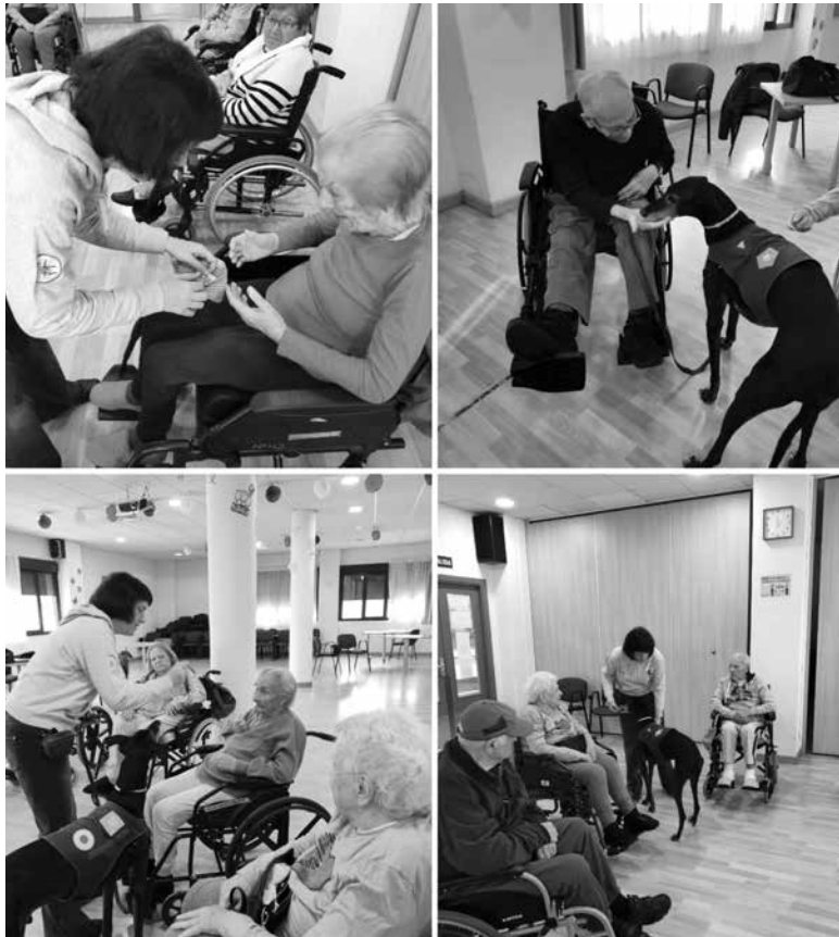
Nuestros residentes disfrutando de la actividad.

Desde sus primeros tiempos, el ser humano ha demostrado un fuerte vínculo con los animales. La compañía del animal mejora la calidad de vida del ser humano, aumenta la longevidad y preserva el equilibrio físico y mental. Facilita la recreación, reduce el estrés, y disminuye el índice de depresión. Dos veces al mes acuden a visitarnos Miren y Txistu y comparten con nosotros momentos llenos de afecto, juegos y caricias. Estas sesiones se realizan con grupos reducidos y teniendo en cuenta que, previamente, los participantes hayan mostrado afinidad con estos animales. Las sesiones se adaptan a personas con diferentes limitaciones físicas y cognitivas, gracias a ello participan la gran mayoría de nuestros residentes.