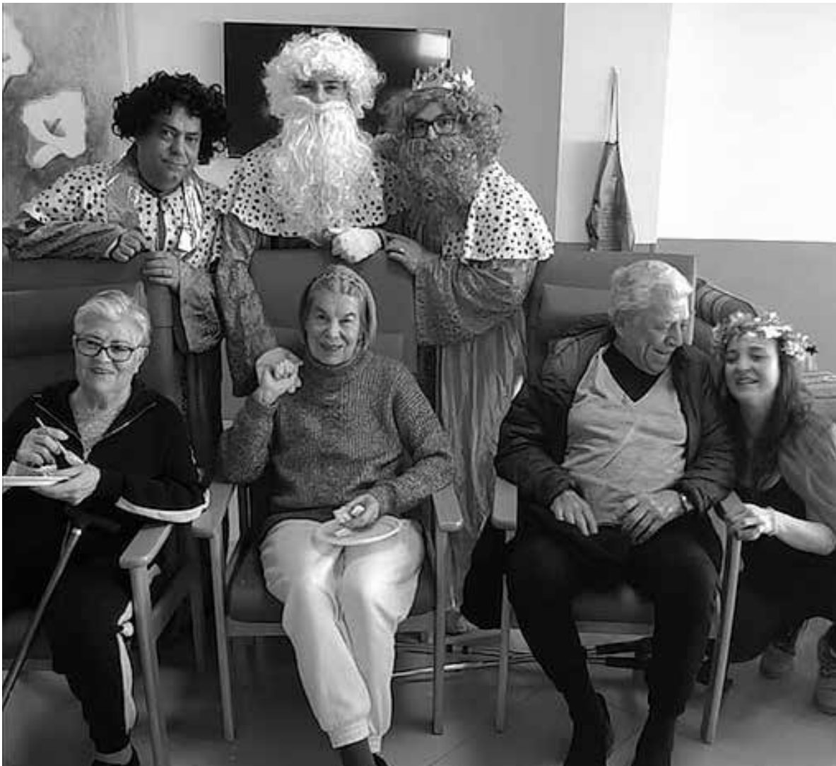
Los Reyes Magos junto con usuarios de centro de día.

Como en años anteriores, en estas fechas tan señaladas, el centro se vistió de gala para celebrar la Navidad. Este año disfrutamos de diferentes talleres navideños para la decoración del centro, cinefórum de temática navideña, bingo especial, actuaciones, villancicos, nuestra ya famosa fiesta de Fin de Año en la que tomamos las uvas y brindamos y bailamos por el nuevo año, y la llegada de Sus Majestades los Reyes Magos, que dejaron presentes para todos de nuestros residentes y usuarios de centro de día y que celebramos con un rico roscón. Encaramos el nuevo año con ilusión, el 2024, en el que continuamos esforzándonos por nuestros residentes y usuarios de centro de día con nuestras actividades ordinarias diarias y extraordinarias como las sesiones de perroterapia, salidas culturales, actuaciones musicales, las sesiones del proyecto Alimentamos las emociones, etc. Esperamos que disfrutéis con nosotros.