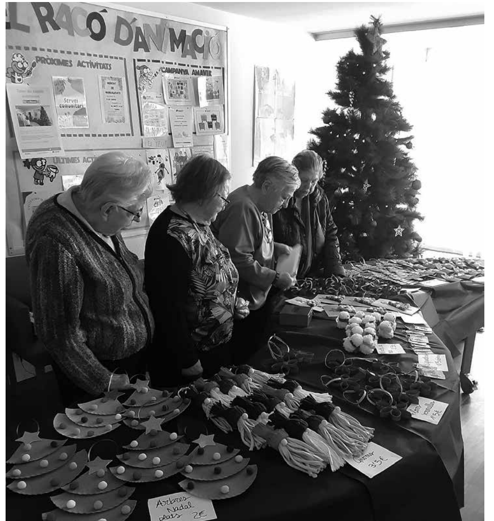
Venent treballs manuals.

El dimecres 13 de desembre, com cada any, la terapeuta ocupacional del centre, juntament amb la psicòloga de l'ambulatori de Vilanova del Camí, van organitzar una activitat amb finalitats solidàries. Uns dies abans, els avis i àvies van estar pensant i dissenyant una gamma de dibuixos ben variats per poder-los convertir en xapes aquell dia. Vam col·locar una parada a la recepció del centre on qui volia podia col·laborar en aquest mercat solidari comprant els treballs manuals per contribuir a una bona causa per un preu simbòlic d'1 €. Hem de dir que va ser tot un èxit, ja que es van recaptar 81 € en molt poca estona! Els diners es destinaran a La Marató de TV3 dedicada a la salut sexual i reproductiva. D'altra banda, durant el mes de desembre vam tenir les mans molt ocupades i és que els avis i àvies, juntament amb l'educadora social i la terapeuta ocupacional, vam estar confeccionant un bon ventall de treballs manuals nadalencs amb finalitats solidàries també. Els dies previs es va celebrar una assemblea en què les persones residents van decidir a quina entitat volien destinar els diners i la guanyadora va ser l'Associació Espanyola contra el Càncer. Així doncs, vam tornar a muntar la paradeta a l'entrada del centre amb unes venedores d'allò més eixerides que captaven l'atenció de