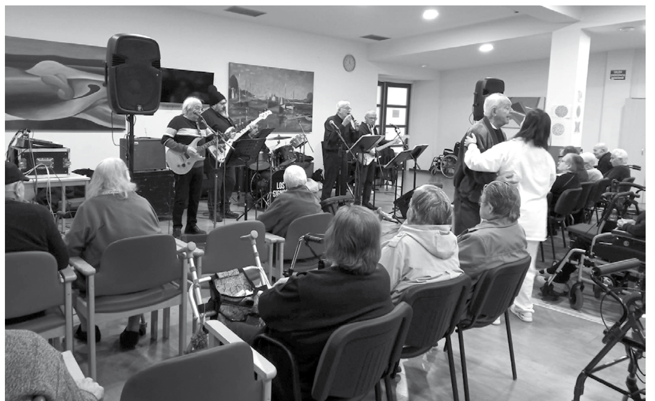
Gaudint el concert.