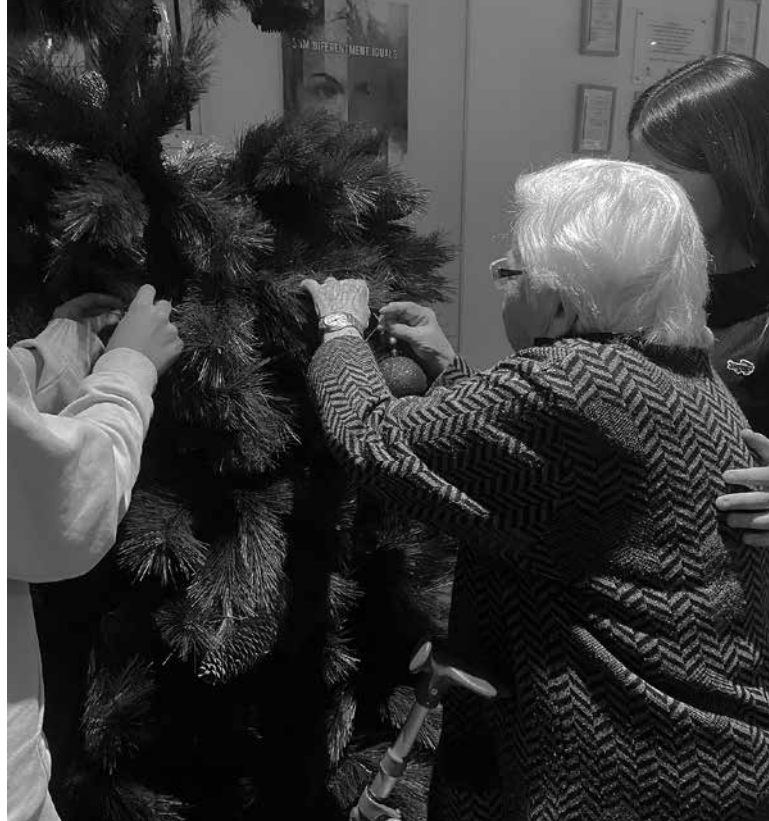
Decorant l'arbre de Nadal.

Després de la bona rebuda que va tenir l'any passat, aquest any hem decidit repetir l'experiència del servei comunitari. Es tracta d'una iniciativa en què diversos nois i noies, estudiants de l'Institut Pla de les Moreres, comparteixen moments amb els avis i àvies. Des del mes de novembre i fins al gener, han dut a terme conjuntament amb l'educadora social del centre diverses activitats molt diferents, com ara un taller de cuina, bitlles, música, bingo... que han permès i facilitat la creació d'un vincle entre tots. D'altra banda, també vam tenir l'oportunitat de compartir moments amb l'alumnat de la UEC de Vilanova del Camí, que ens va ajudar a guarnir la residència per a les festes de Nadal. A més a més, al gener van tornar per fer un taller de cuina boníssim amb