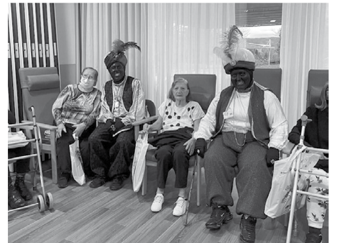
Les persones residents amb els patges.