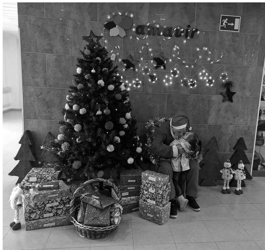
Visita de Papá Noel.

Un año más, celebramos juntos las fiestas navideñas rodeados de nuestros seres queridos. Si bien tuvimos la agenda repleta de actividades, cabe destacar la emotiva mañana que pasamos el 26 de diciembre cuando contamos con la especial visita de Papá Noel, que repartió regalos a los más pequeños de la casa: los nietos y bisnietos de nuestros mayores. Toda esta actividad fue posible gracias a la donación de juguetes de la empresa BANDAI, quien nos proporcionó todo el material para estas fechas tan emotivas. Después de que Papá Noel repartiese sus regalos y que los pequeños pudieran hacerse unas fotos junto a él, amenizamos la mañana al son de villancicos con los que todos nos animamos a bailar y cantar. Sin duda, fue una actividad para disfrutar en familia y pasar un agradable rato juntos. Desde luego, resultó un pequeño detalle para haceros sentir a todos parte de esta casa y de la gran familia que formamos.