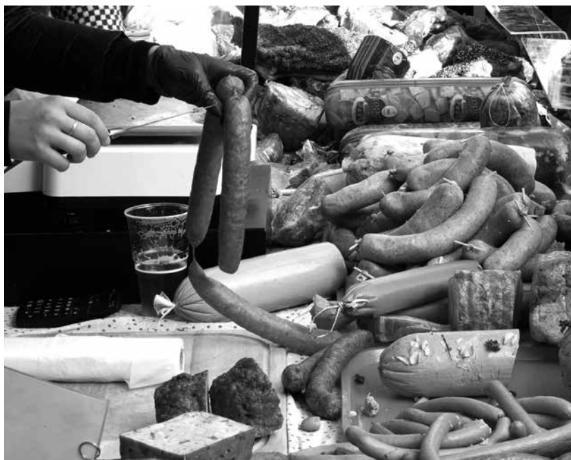
Productos de la matanza típica de Salamanca.

La matanza es una fiesta muy arraigada en la provincia de Salamanca que se encuentra en plena temporada durante los meses de diciembre y enero con la llegada del invierno, aunque en muchos hogares esta tradición ya se ha ido perdiendo. Los productos de la matanza han constituido un pilar básico en la alimentación de muchos hogares en la población de nuestro país, y la elaboración ha ido pasando de generación en generación. En Salamanca, en algunos municipios, se sigue manteniendo como rito gastronómico, como por ejemplo en los pueblos de Guijuelo y la Alberca, en este último lugar, la festivi-