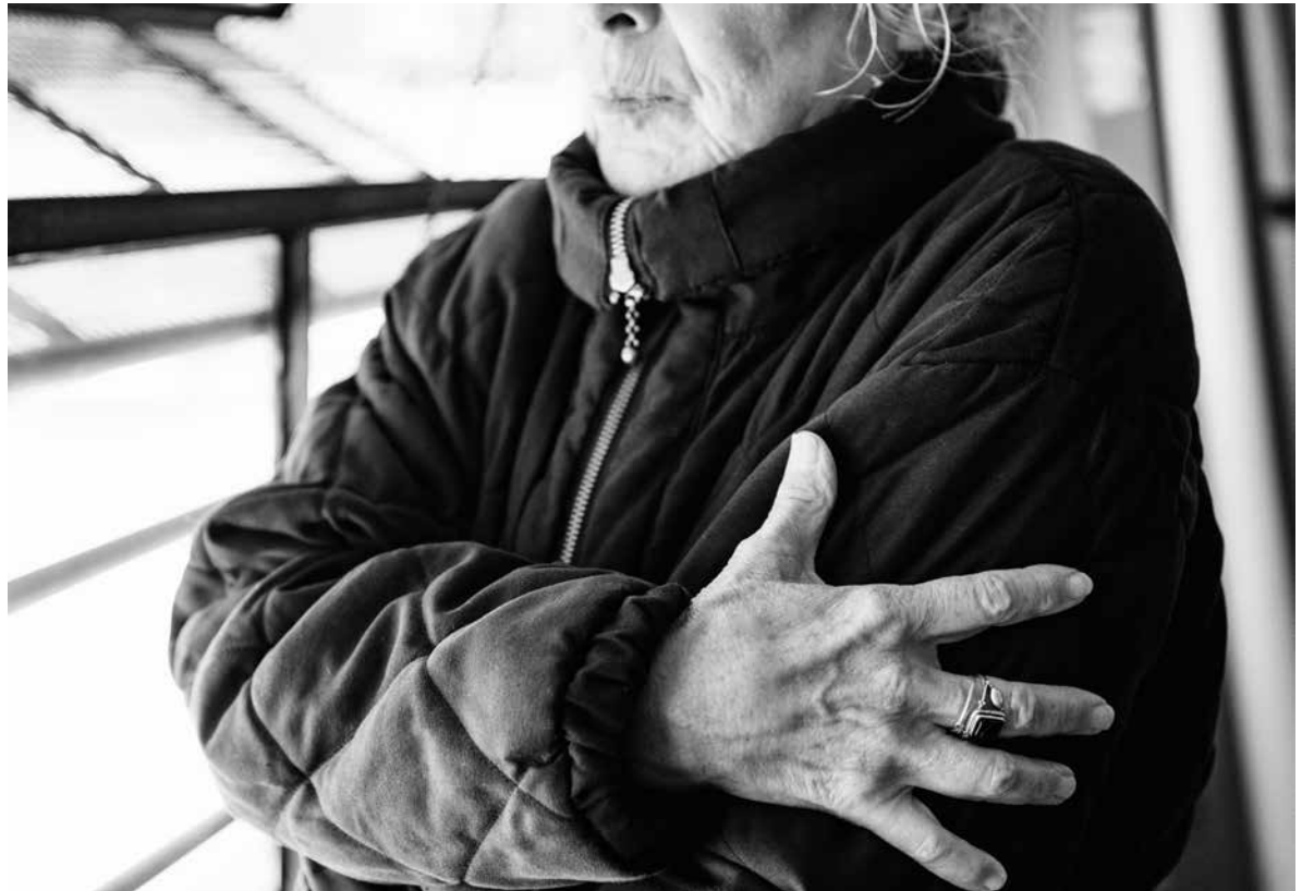
El frío nos baja las defensas.

Las temperaturas bajas son un aliciente para que los virus y los gérmenes proliferen, trayendo consigo infecciones virales, aunque solo se trate de un resfriado común. Se alojan en la garganta de aquellos que no tienen en cuenta algunos cuidados especiales, provocando que se inflame y produzca ese malestar e incomodidad tan típicos en el invierno. Existen, entonces, algunos consejos para que la lluvia, o el viento frío tengan menos oportunidades de provocar tos o cualquier otra molestia en la garganta. La hidratación en épocas de invierno es igualmente relevante. Muchas personas, al preferir quedarse en casa para calentarse, reducen su actividad física y, por ende, da la sensación de no necesitar tomar agua regularmente, como sí sucede en otras estaciones del año. Por eso, hay que mantener el hábito de beber agua con el fin de hidratar la garganta y evitar la resequedad, la cual es una de las causas de malestar. El sistema inmunitario del cuerpo está estrechamente ligado a la dieta diaria. Debe ser equilibrada para que el cuerpo forme defensas contra agentes externos como virus y bacterias. Consumir frutas y verduras ayuda a conseguirlo. Un buen balance