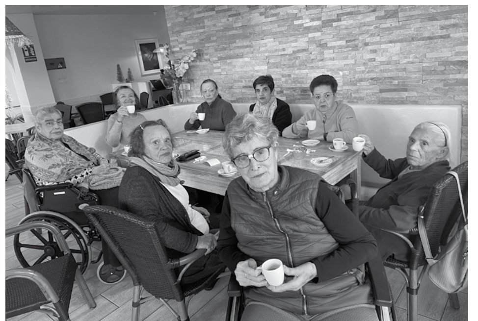
Nuestras residentes disfrutando de un rico café.

No hay nada mejor que coger aire y disfrutar de caminar por las calles viendo nuevos paisajes, teniendo conversaciones entre amigos y alguna risa que otra. Por esta razón, un grupo de residentes se fue de visita al pueblo costero de Bajamar, con su aroma al mar del atlántico y ese olor a salitre tan importante para los canarios. Además de pasear por sus calles, gozaron del espectacular portal de belén elaborado por la Asociación de Vecinos Gran Poder de Bajamar, que alcanzaron el 2º puesto en el Concurso de Portales de Belén del Ayuntamiento de La Laguna. Antes de regresar al centro, degustaron un maravilloso café en una de las terrazas cerca del mar.