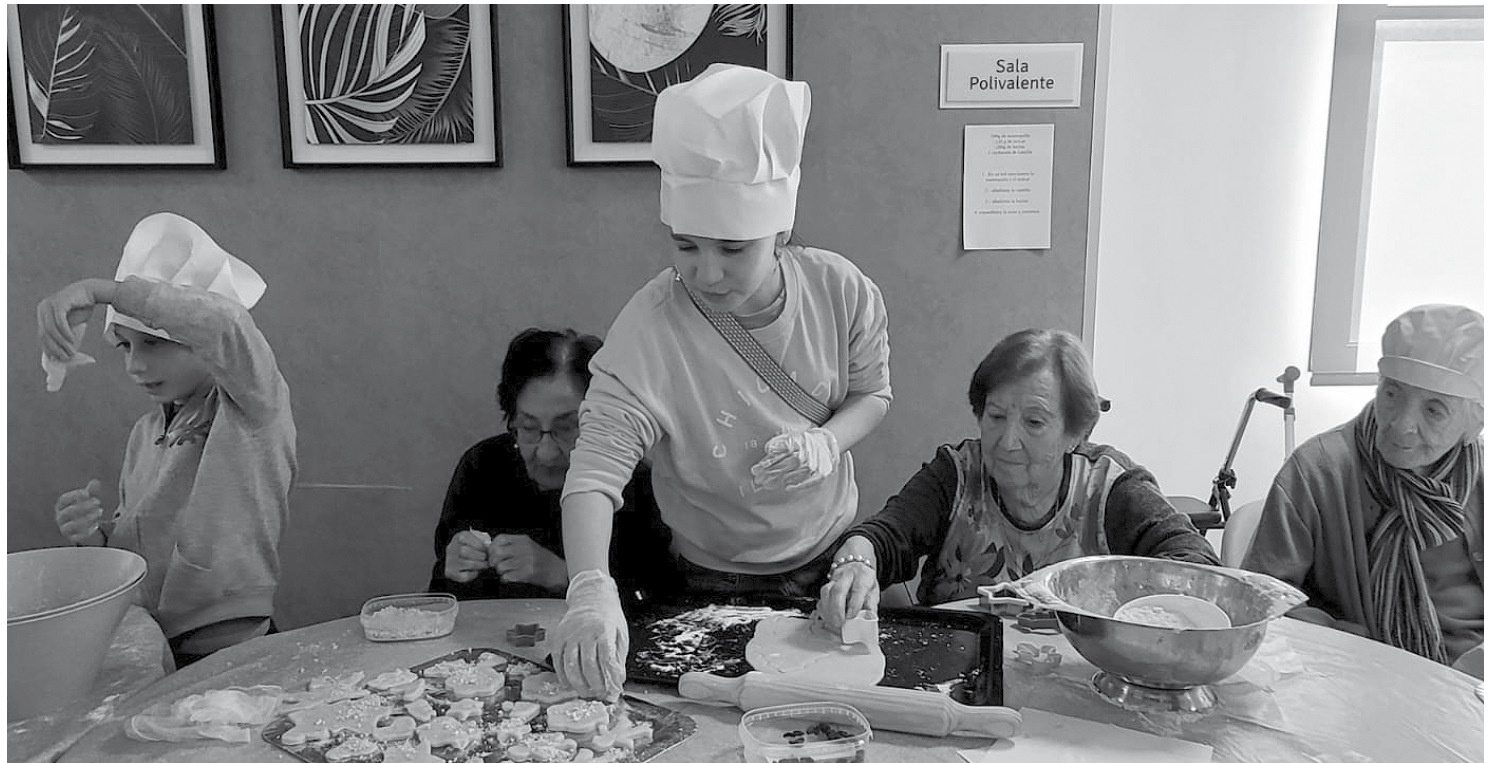
Taller intergeneracional de galletas.

En todas las familias, cuando llegan los niños a casa nos revolucionan la vida, parece y da la impresión de que se desordena todo, pero cuando te paras a pensar, en realidad, tenerlos con nosotros es lo mejor que nos puede pasar. Y es que al igual los niños son energía para los mayores, los mayores enseñan a los pequeños a desarrollar la empatía y el respeto hacia otras generaciones. Por eso, en nuestra casa estamos encantados de que vengan a visitarnos en cualquier ocasión. Los encuentros intergeneracionales que celebramos en nuestro centro reportan grandes beneficios a los residentes, promueven el aprendizaje mutuo y el crecimiento personal, así como la conexión y el entendimiento entre diferentes personas. Les invitamos a participar en