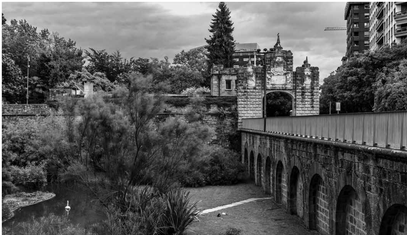
Los Jardines de la Taconera.