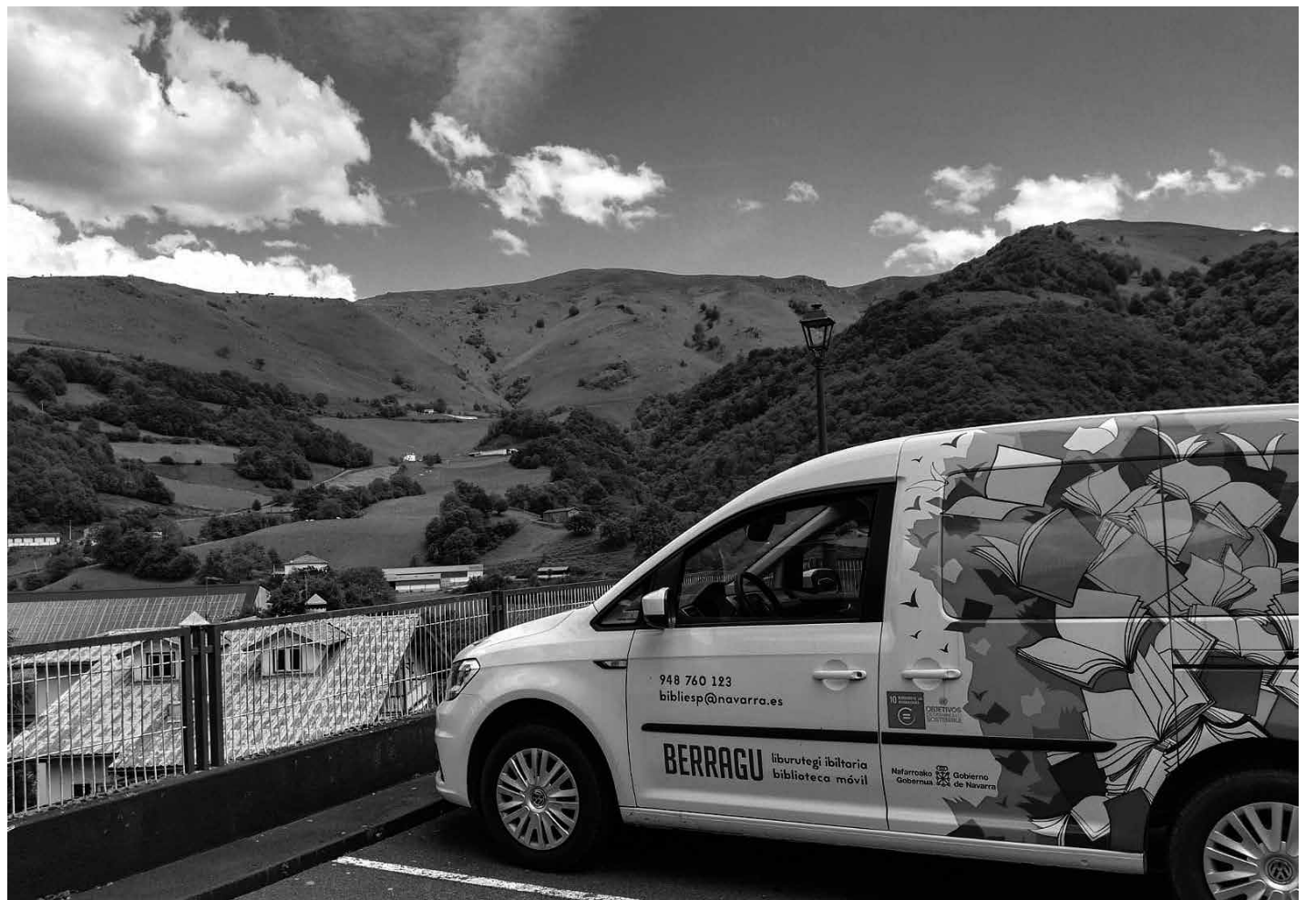
La furgoneta de la biblioteca a domicilio.

En Amavir Ibañeta tenemos a varios residentes apasionados de la lectura y, aunque contamos con una biblioteca particular, desde el pueblo de Espinal nos ofrecen el servicio de “biblioteca a domicilio”. Sin duda es un servicio muy apropiado porque no todos tienen la oportunidad de salir muy a menudo de la residencia, y es por eso que cada jueves, siempre que haya demanda, se acercan con los libros solicitados. El servicio de préstamo a domicilio queda restringido a los pueblos de la zona, pero todo el mundo es bienvenido a la biblioteca y puede beneficiarse del resto de servicios.