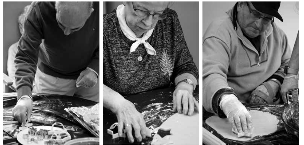
Un momento del taller de repostería elaborando galletas de mantequilla.

La primavera está a punto de llamar a nuestra puerta y, en el centro, ya estamos preparados para disfrutar de una época que, a buen seguro, estará llena de buenos momentos, tantos como los que hemos vivido estos meses que dejamos atrás, donde ha habido cabida para multitud de actividades compartidas con familiares y amigos. Entre las más destacadas, los talleres de manualidades donde, además de realizar bonitos adornos para decorar el centro, también elaboramos saquitos de lavanda para aromatizar nuestros armarios. Tuvimos tiempo para ponernos de lo más dulces con un taller de repostería en el que elaboramos unas ricas galletas de mantequilla. Ni qué decir tiene que no sobró ninguna. Tampoco quisimos faltar a nuestra