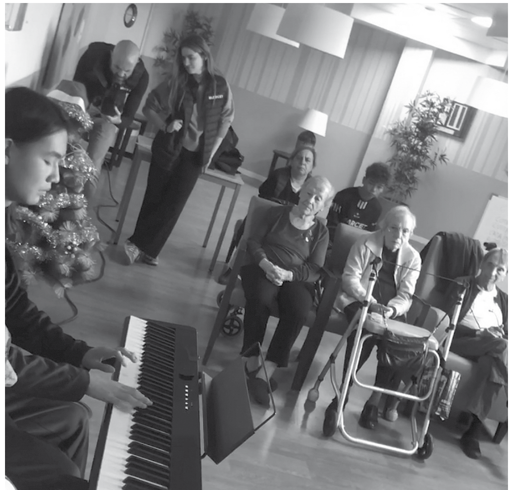
Pianista de la fundación Marcet.

El pasado mes de diciembre nos coordinamos con la Fundación Marcet para realizar una actividad conjunta con nuestros residentes y con un grupo de jóvenes con mucha ilusión por felicitar la Navidad a cada uno de nuestros mayores. Los jóvenes de la fundación hicieron una demostración de todos sus talentos. Se realizó una demostración de piano por parte de dos de ellos, la cual nos emocionó a cada uno de nosotros. Ofrecieron un concierto de musicoterapia tocando piezas superconocidas como el Para Elisa de Beethoven. También, al ser una fundación encargada de entrenar futuras promesas del fútbol, nos enseñaron sus grandes habilidades con el balón. Finalmente, entregaron una tarjeta de Navidad personalizada a nuestros residentes. Fue una actividad con un trasfondo pedagógico que ayudó a conectar a los mayores con los jóvenes de ahora ofreciéndoles una actividad sistémica para sentir que no son un lastre y que el entorno que les rodea también se acuerda de ellos. Los jóvenes se pasearon por cada una de nuestras plantas, teniendo un espacio de intimidad y comunicación con ellos. Fue algo muy bonito.