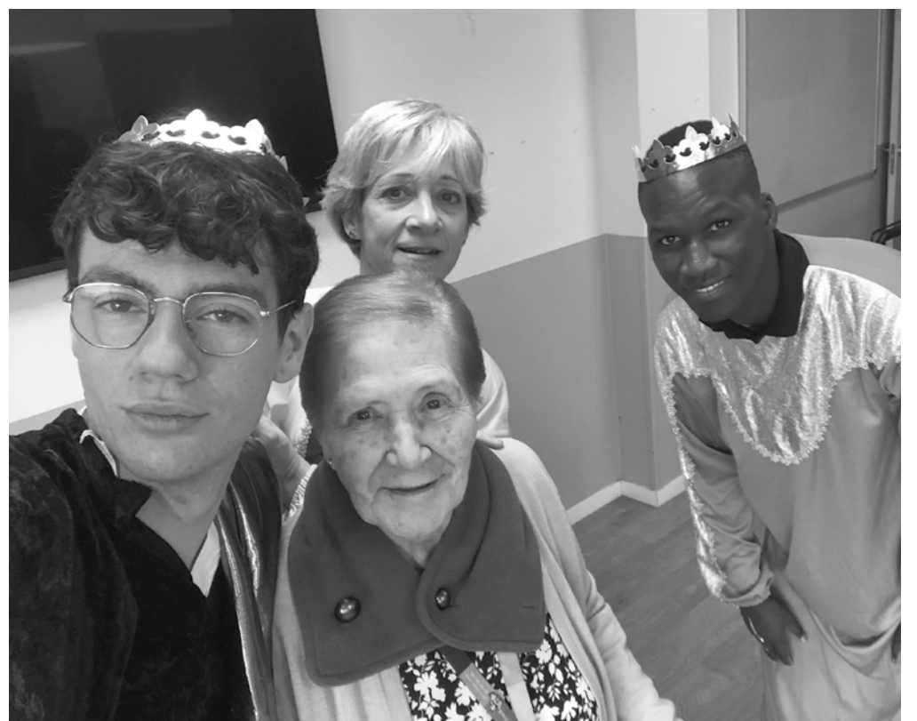
Nuestros queridos tres Reyes Magos.

Como ya es tradición, los Reyes Magos hicieron una aparición estelar en nuestra residencia para sacarles una sonrisa a cada uno de nuestros mayores. Sus Majestades hicieron entrega de un regalo muy especial y muy calentito a cada uno. El tour real empezó por la 4.ª planta donde nuestros residentes ya esperaban con ansias la visita. Siguió por la tercera, luego por la segunda y finalmente nuestros residentes de la primera planta. Fue muy especial poder presenciar la alegría que se dibujaba en sus rostros. Se trata de un momento muy especial y que les conecta con su entorno. Al final, compartir momentos con tanto peso emocional ayuda a enfatizar el sentimiento de grupo entre ellos.