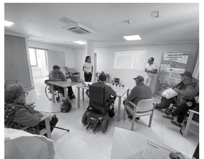
Primera sesión del proyecto Audaces.

La asociación Papa Cría lleva a cabo el proyecto Audaces, una iniciativa de huertos intergeneracionales en diferentes municipios en conjunto con centros escolares y de mayores. Concretamente, en Haría lo están realizando con nuestro centro y con el IES Haría. Este proyecto tiene como objetivo unir a dos generaciones a través de la agricultura ecológica de una forma sencilla, divertida y diferente. El proyecto se divide en varias sesiones. La primera tuvo lugar el 18 de diciembre. Constó de una parte teórica donde se les dieron conocimientos básicos sobre huertos ecológicos a nuestros residentes, y posteriormente, se llevará a cabo la parte práctica para la realización de un agro-libro en el huerto del centro.