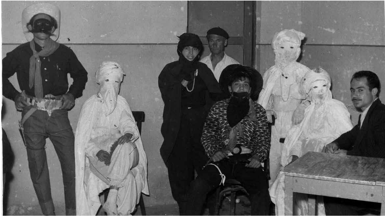
Momentos de Carnavales hace años.