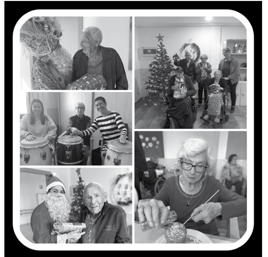
Varias actividades de Navidad.