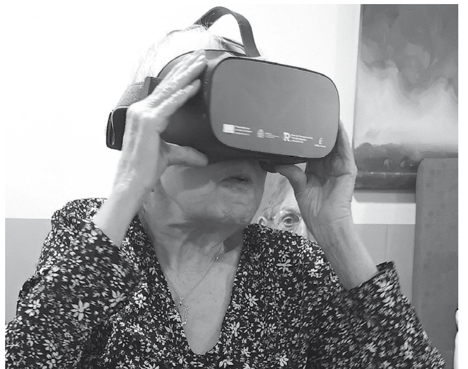
Usando las gafas virtuales.

A través de nuestras pantallas y gafas virtuales, nuestros mayores experimentaron la realidad paralela que les infunden estas tecnologías. Gracias a estas herramientas pudieron ser partícipes de una excursión a diversos lugares, compartir momentos vividos de jóvenes y con ello trabajar la memoria y la reminiscencia. Además, esta iniciativa les ofrece la oportunidad conocer ciudades, pueblos y museos tanto de nuestro país como de fuera. Las experiencias dejaron opiniones de “una pasada”, “una maravilla”, “la mejor experiencia para poder visitar mi pueblo”, “quiero repetir”, y un largo etcétera de sensaciones un tanto curiosas para nuestros mayores, puesto que las nuevas tecnologías no suelen entrar dentro de sus costumbres.