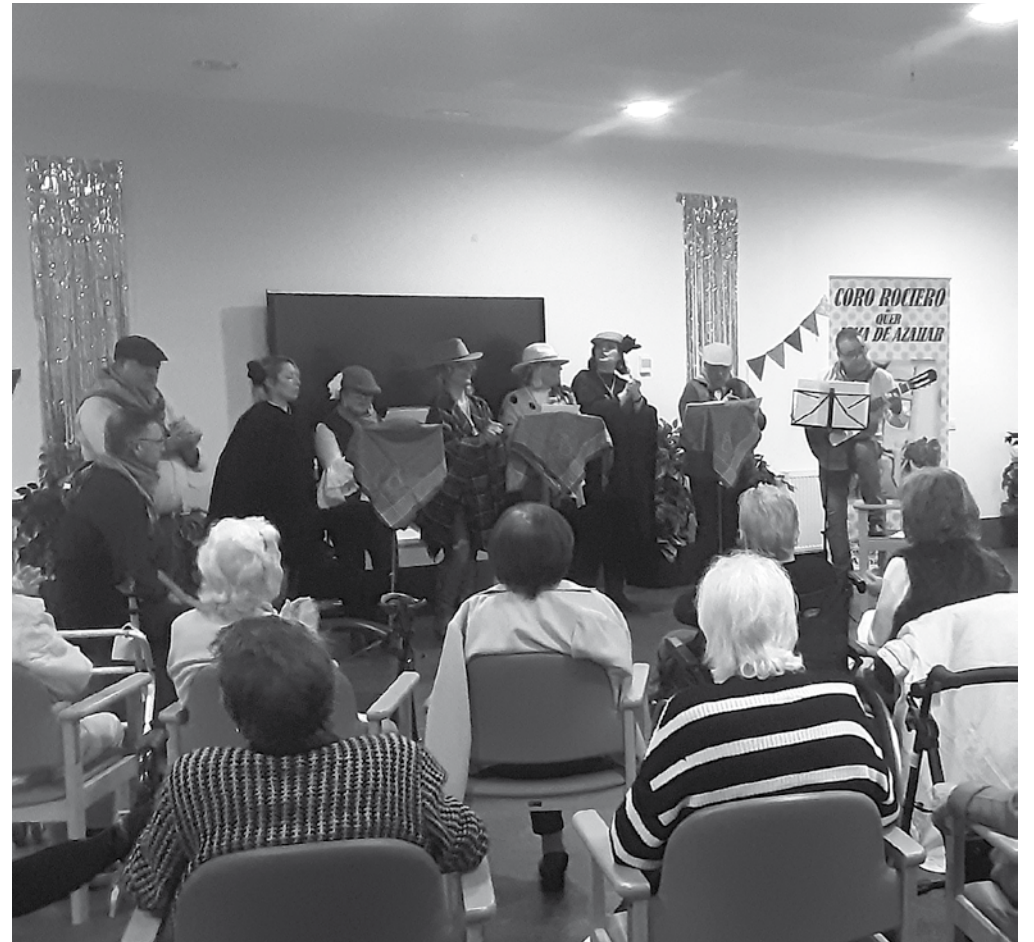
La sala polivalente de El Balconcillo durante una de las actuaciones.

La sala polivalente de la residencia, situada en la entrada a mano derecha, junto a la capilla, es el lugar donde nos podemos juntar todos, mayores, familiares y trabajadores. Principalmente porque es la única sala con la capacidad para acoger fiestas, reuniones y que ha vivido durante todo este tiempo muchos aniversarios y fiestas de gran tamaño, actuaciones, cines y multitud de actividades celebradas durante estos 16 años. La más significativa de todas y por la que muchos de vosotros la reconoceréis es por las actuaciones musicales y por la celebración de aniversario del centro. Actualmente se ha instalado una pantalla digital con conexión a Internet en la sala que se usará para trabajar con los residentes y para poner cine. También es uno de los lugares frecuentados cada mañana por los mayores del centro de día que trasladan su actividad física a dicha sala, un espacio donde poder realizar multitud de actividades juntos durante todo el año.