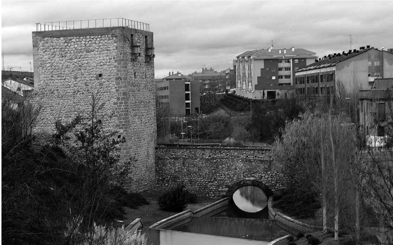
Barrio de El Alamín, Guadalajara.