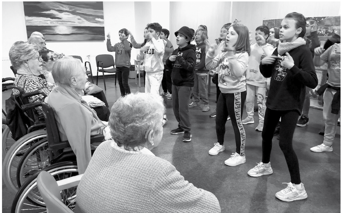
Jóvenes y mayores disfrutando juntos de las actividades intergeneracionales.

Una vez más nuestros mayores fueron testigos y transmisores de uno de los valores fundamentales de la educación de los más jóvenes. Estamos hablando del cariño y del respeto de los jóvenes hacia las personas mayores. Cada día de las pasadas Navidades, un grupo de 30 jóvenes del Colegio Público Las Lomas nos visitó con mucha alegría y caras de sorpresa por conocer una gran casa. A la entrada de El Balconcillo un gran grupo de mayores les esperaba cada día con los brazos abiertos para recibir su llegada y poder compartir con los alumnos el regalo más preciado, el tiempo y el cariño. Tras recibir a los jóvenes en la sala polivalente y formar grupos junto con la terapeuta y el animador, los jóvenes y los mayores realizaron una visita guiada por todas las estancias del centro. En