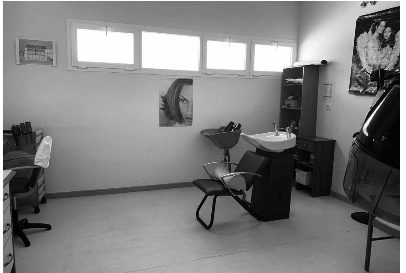
La sala de peluquería.

En las instalaciones de nuestro centro, en la planta baja 0, contamos con un salón de peluquería a disposición de todos los residentes del centro y usuarios de centro de día. El servicio de peluquería se ofrece tres días a la semana, casi siempre los lunes, martes y miércoles, y en él se realizan todo tipo de peinados, cortes de pelo, moldeados, tintes o depilación, tanto a hombres como a mujeres. La sala de peluquería es bastante amplia, cuenta con un espejo grande, dos secadores fijos y dos lavabos. Nuestros residentes y usuarios de centro de día pueden disponer de este servicio cuando ellos lo necesitan solicitando cita previa a las auxiliares de los módulos de convivencia, para así poder organizar la agenda. Este servicio también