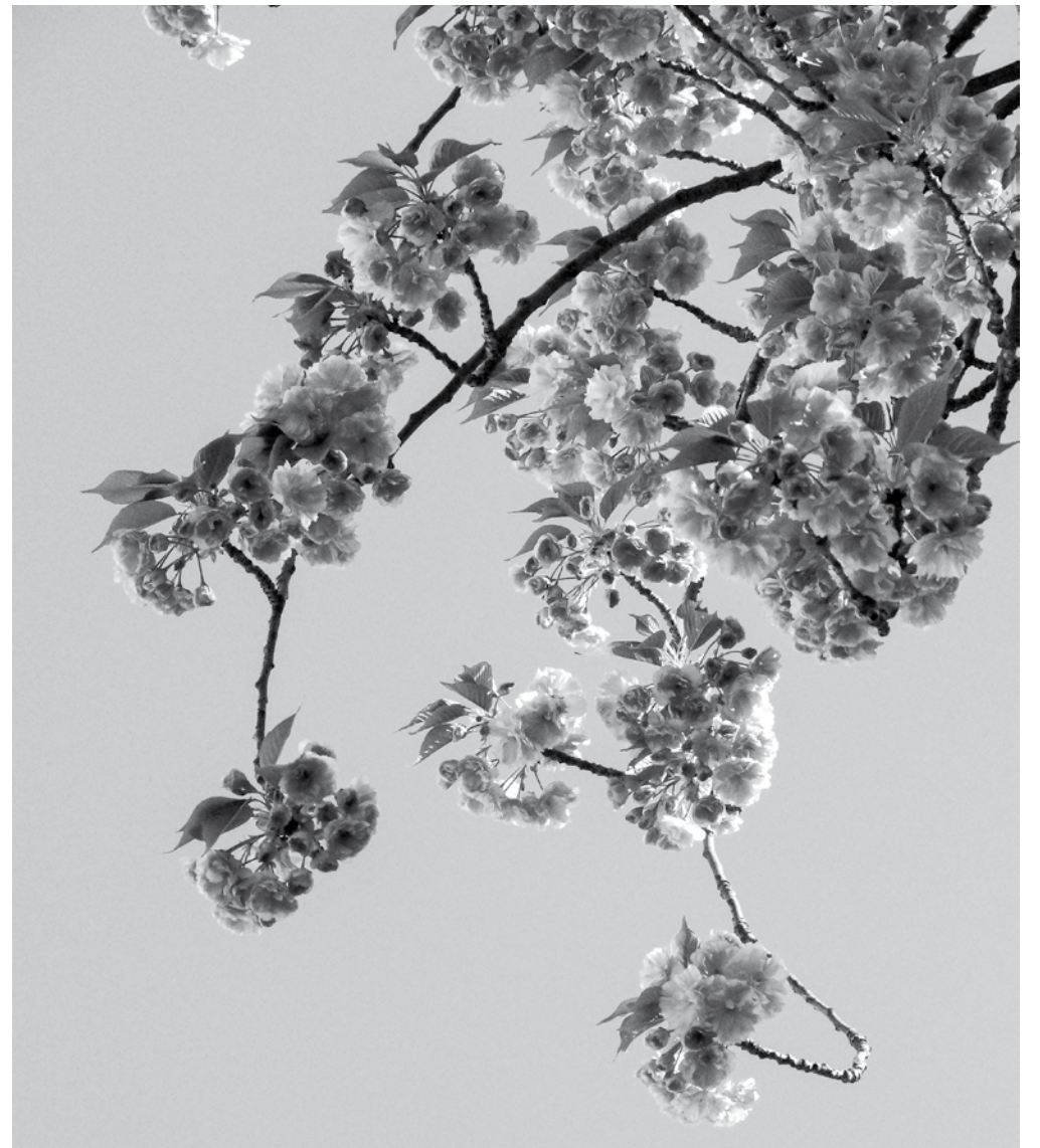
Cerezos en flor en primavera.

Siguiendo al invierno, y precediendo al verano, llegará en breve la primavera, una de las 4 estaciones del año que nos acompañará del 20 de marzo al 20 de junio. Esta temporada nos traerá el renacimiento de la naturaleza, un aumento de las temperaturas medias, el deshielo, la floración de las plantas, el despertar de los animales en hibernación y el regreso de las especies migratorias. Todo esto hace de la primavera la estación de la renovación de la vida. El eje de tierra aumenta su inclinación con respecto al Sol, y la duración de la luz diurna aumenta rápidamente. Este cambio de temperatura también generará acontecimientos menos predecibles, como pueden ser los fenómenos del niño, lluvias torrenciales o inundaciones. Tornados, tormentas y granizos también son fenómenos más frecuentes de estas fechas, siendo muy temidos por los agricultores que ven peligrar sus cosechas. Son muchas las fiestas que nos harán disfrutar de esta etapa, como son la Semana Santa, las romerías o las comuniones aprovechando el inicio del buen tiempo y las ganas de salir a la calle a disfrutar de las cálidas temperaturas. Y es que como dice el refrán, “la primavera la sangre altera”.