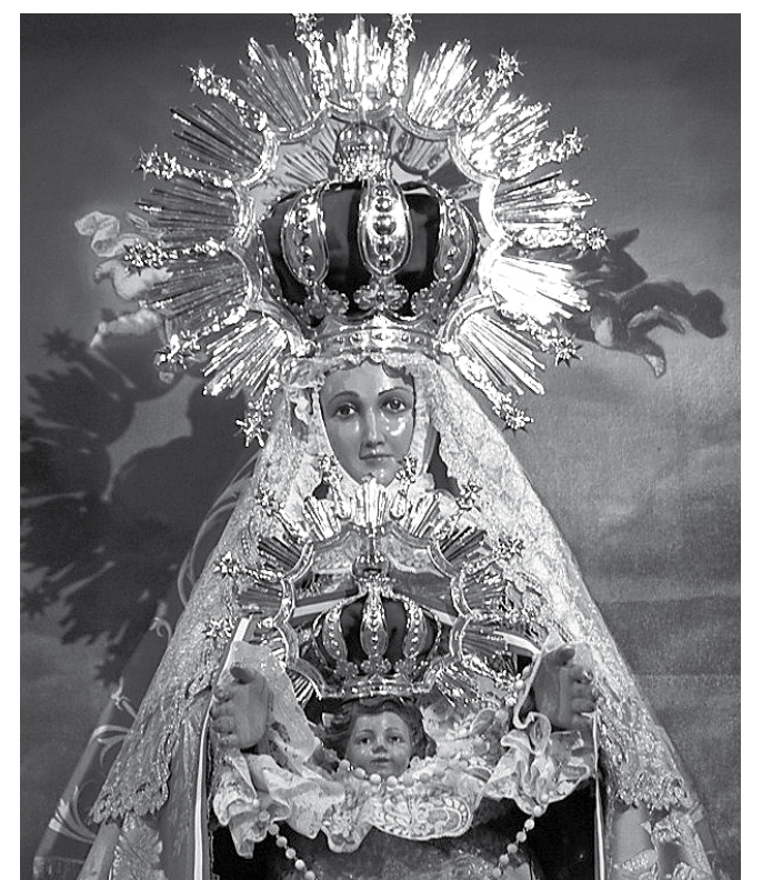
La Virgen de Peñarroya.

La Virgen de Peñarroya es la patrona de Argamasilla de Alba, compartiéndola con el pueblo de La Solana. La imagen de la Virgen está cuatro meses al año en cada pueblo y otros cuatro meses en su ermita, en el Castillo de Peñarroya. La primera romería tiene lugar el último domingo del mes de abril, trayendo la imagen de la Virgen desde el Castillo de Peñarroya hasta Argamasilla de Alba. El recorrido se hace andando y la imagen es llevada en volandas por los vecinos de la localidad. En septiembre, se hace el recorrido inverso, llevándola hasta La Solana, permaneciendo allí los siguientes cuatro meses, hasta que es devuelta de nuevo hasta su santuario en el castillo.