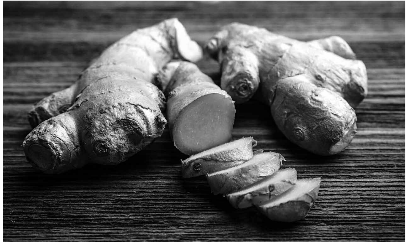
Raíz de jengibre.

El jengibre es una especia y planta medicinal utilizada en China desde el siglo XI a.C. Era utilizado para múltiples patologías de los ojos, trastornos estomacales e intestinales, extendiéndose su uso para enfermedades neurológicas, dolores, insuficiencia circulatoria, náuseas y vómitos. En la actualidad, casi el 50 % de la producción procede de la India. En la medicina natural centroeuropea se recomienda en la enteritis crónica, la tos, la retención de orina, trastornos ginecológicos, reuma, faringitis, vértigos, náuseas y mareos, trastornos circulatorios, dolores y espasmos musculares, trastornos gástricos y digestivos, en caso de sensibilidad al frío, defensas bajas y debilidad motora. Está contraindicado en caso de cálculos biliares, salvo prescripción médica y no se debe utilizar para las náuseas del embarazo. Se han descrito casos en los