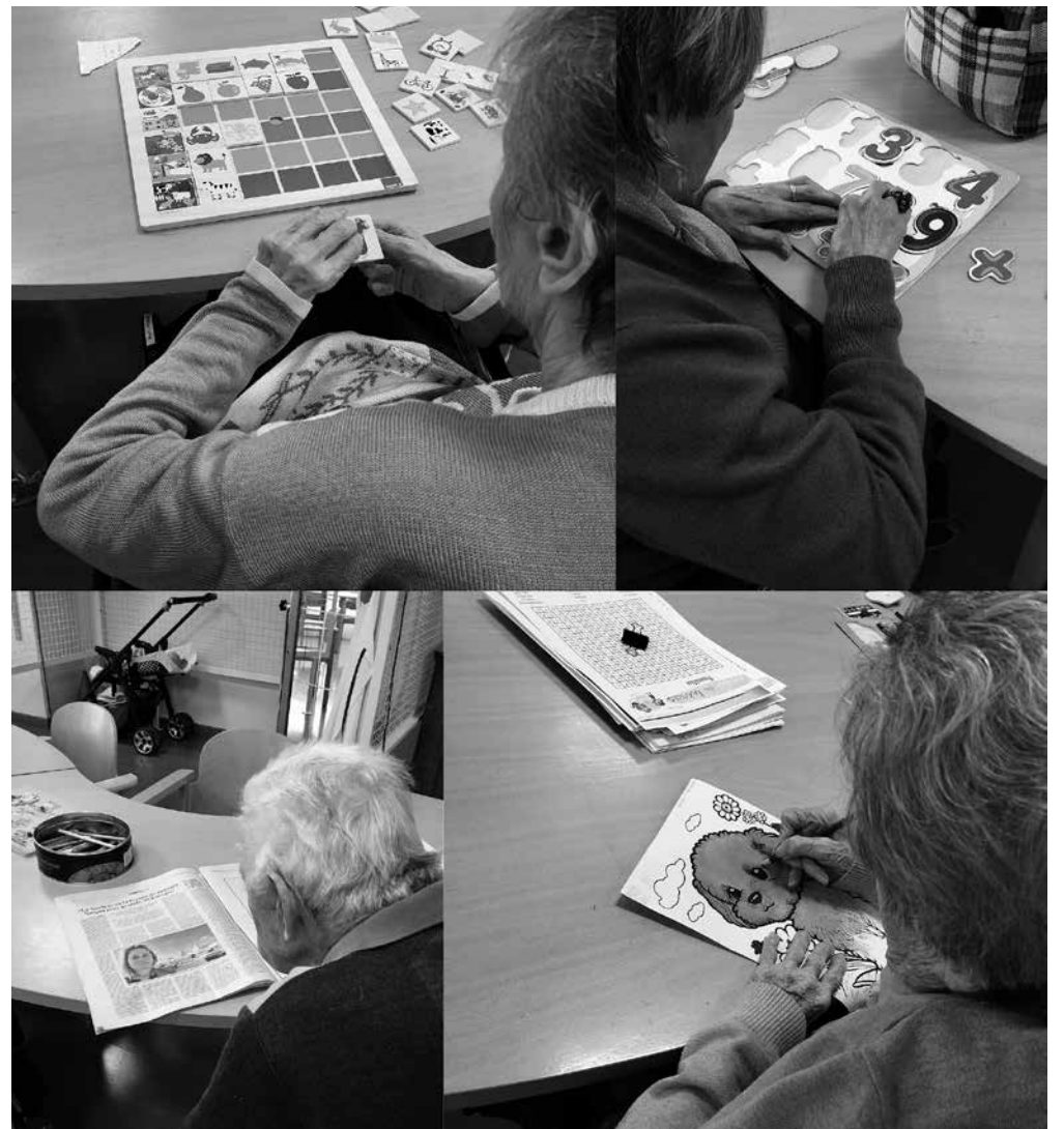
Actividades del taller de estimulación cognitiva.

En muchos de vuestros horarios aparece el taller de estimulación cognitiva, pero ¿sabéis lo que significa? El taller de estimulación cognitiva, que se desarrolla en la sala de terapia ocupacional de la planta cero, consiste en la realización de actividades que tienen como objetivo mantener, o incluso mejorar, el buen funcionamiento cognitivo a través de determinados ejercicios en función de las preferencias de cada uno de vosotros. Además, a través de la estimulación cognitiva se consiguen beneficios en las habilidades sociales y personales, estimular la comunicación y la interacción, mantener la atención y, entre otras, entretenernos y divertirnos. Por ello, en función de las capacidades de cada uno y de sus gustos, se programan actividades como pueden ser la lectura del periódico, encajables y juegos de lógica, fichas o sopas de letras, completar dibujos, etc. Es muy importante trabajar tanto nuestro cuerpo como nuestra mente, por ello, os animamos a seguir participando en los talleres.