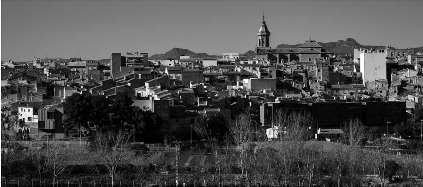
El pueblo de Cieza.