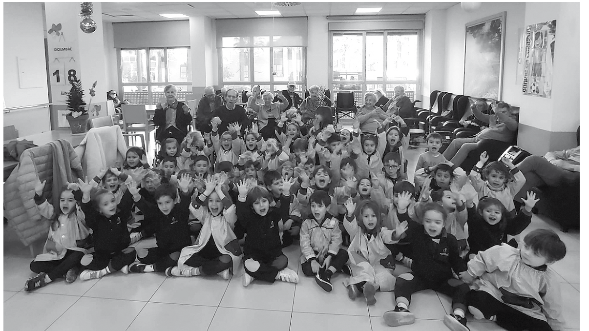
Una de las visitas de las fechas navideñas.

La programación navideña es un evento esperado con entusiasmo y alegría. Con el objetivo de crear un ambiente festivo y promover la integración entre residentes, se organizan diversas actividades que van más allá de las tradicionales celebraciones. Los villancicos se entonan con entusiasmo en la residencia. Los residentes participan en coros festivos, compartiendo su amor por la música y fortaleciendo los lazos comunitarios. Este evento no solo eleva el espíritu navideño, sino que también fomenta la expresión creativa y la conexión entre generaciones gracias a las visitas de los niños y niñas de infantil y primaria del colegio H.H. Maristas de nuestra ciudad. Estas Navidades realizamos actividades intergeneracionales donde residentes compartieron experiencias y tradiciones con jóvenes, creando un puente entre distintas generaciones. Estas interacciones enriquecen la vida de los mayores al