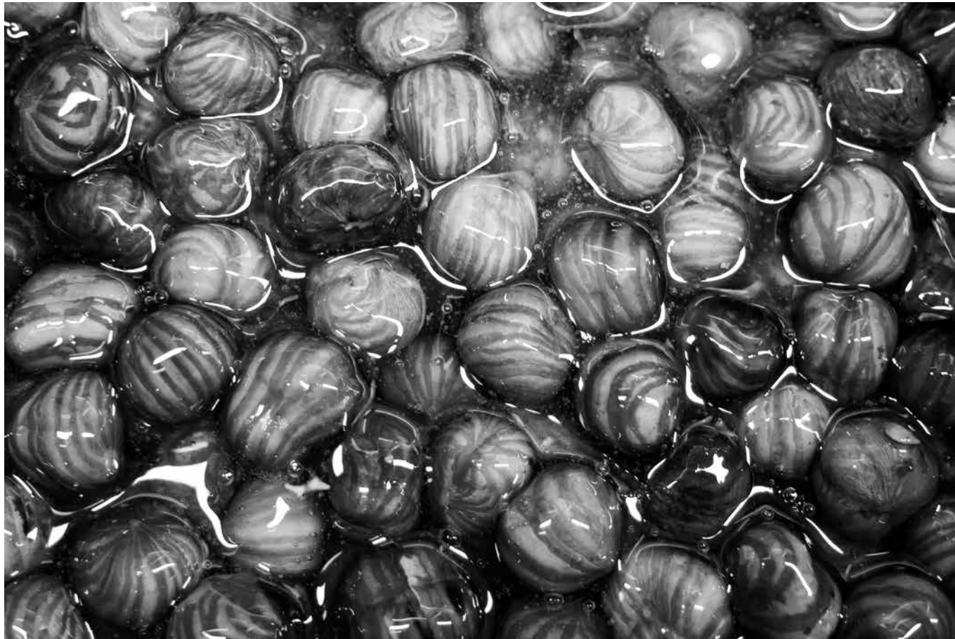
Avellanas caramelizadas para hacer los suspiros que inspiraron el pasodoble.