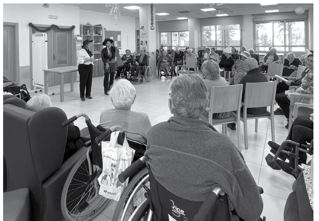
Momentos de la actuación.

El grupo teatral de mayores Zagalicos en colaboración con el Ayuntamiento de Cartagena nos cautivó a todos. Con maestría, representaron situaciones familiares navideñas de manera humorística, añadiendo un toque especial a la temporada. En este escenario tan significativo, la actuación resonó aún más, llevando alegría a residentes y visitantes en un emotivo recordatorio de la magia navideña. Esta es una de las actividades que realizamos en colaboración con el Ayuntamiento de Cartagena, al que agradecemos enormemente su disposición siempre con nuestro centro.