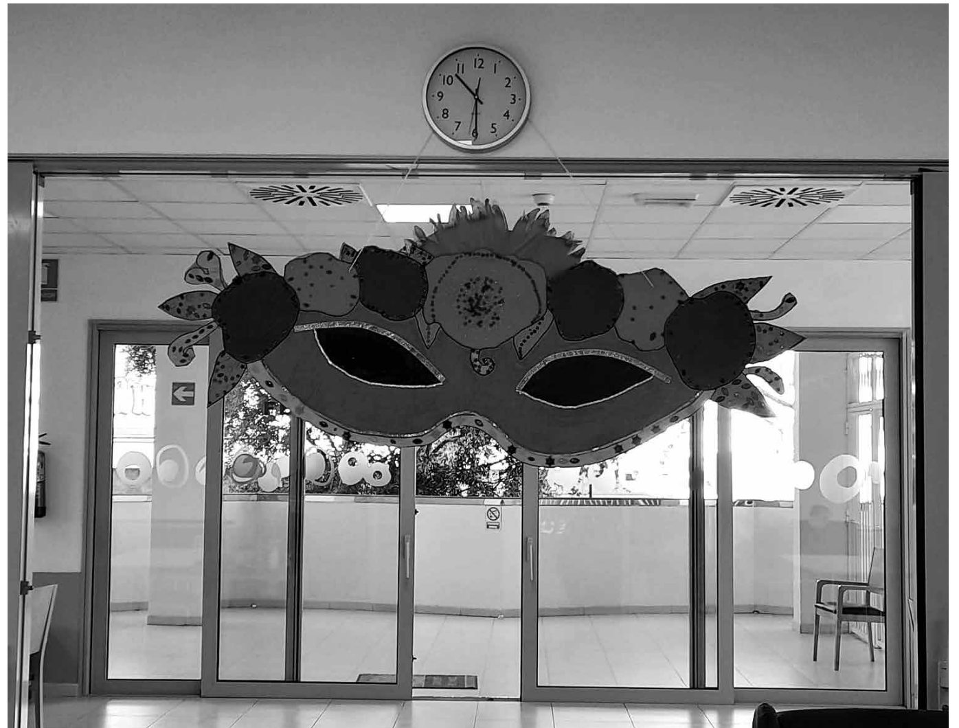
Antifaz decorativo creado por los residentes.

El Carnaval es la antesala a nuestra Semana Santa Internacional, fiesta que cada vez tiene más adeptos en nuestra zona. Son varias las formas de celebrar el Carnaval que comienza con el Jueves Lardero y finaliza con el martes de Carnaval, previo al Miércoles de Ceniza. En el centro entre todos realizamos una decoración especial. También nos disfrazamos de pintores y tuvimos un gran baile para enseñar nuestros atuendos. Visualizamos chirigotas y vimos el desfile de Carnaval de la ciudad. Con todas estas actividades realizamos una orientación espacio-temporal para los residentes, trabajamos la psicomotricidad, la destreza y las