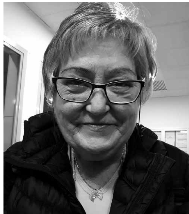
La autora de la receta.

Cocemos toda la carne y que vaya espumando para luego añadirle las verduras y los garbanzos. Cubriremos bien de agua para tener bastante caldo. El repollo lo coceremos aparte para que no le dé mucho sabor al cocido. Servimos el caldo con fideos y después el resto de ingredientes como segundo plato.