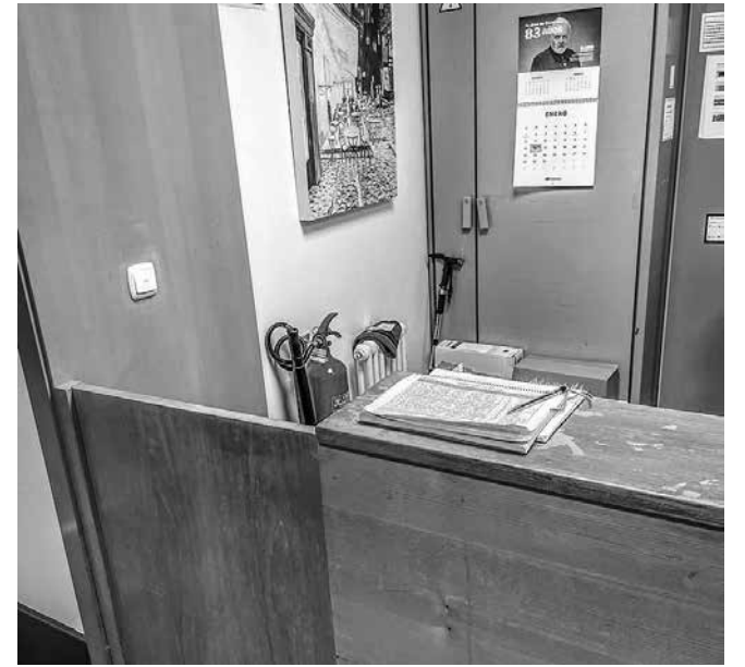
Registro de visitas en nuestra recepción.

Con el objetivo de poder conocer las visitas que recibimos en la residencia, disponemos de un registro de visitas de familiares en el mostrador de recepción, a la entrada de la residencia. El registro es muy sencillo, aunque pueda parecer engorroso. La idea no es la de controlar, sino la de conocer para poder acompañar mejor. El propósito es gestionar y registrar las visitas que tienen nuestros usuarios anotando quién visita con todos los datos, cuánto tiempo se pasa en el centro y la frecuencia de las visitas. Muchas veces, una visita nos aporta alegría y tranquilidad; aunque en otros momentos nos puede traer recuerdos y, tras su marcha, el vacío que se crea cuesta llenarlo. Es por esto que esos datos al equipo multidisciplinar nos aportan mucha información. Tener un registro favorece el acompañamiento de nuestras personas residentes a la par que, la comunicación con las familias y el entorno social se refuerza. Es la manera de comunicarnos y colaborar. Aunque parezca difícil de creer, ese pequeño registro posibilita un acompañamiento más cercano, realista y concreto. Así que, aprovechamos esta sección para recordarnos de la existencia de este registro en formato de cuaderno que ponemos a vuestra disposición y el cual os invitamos de manera afectuosa a utilizar.