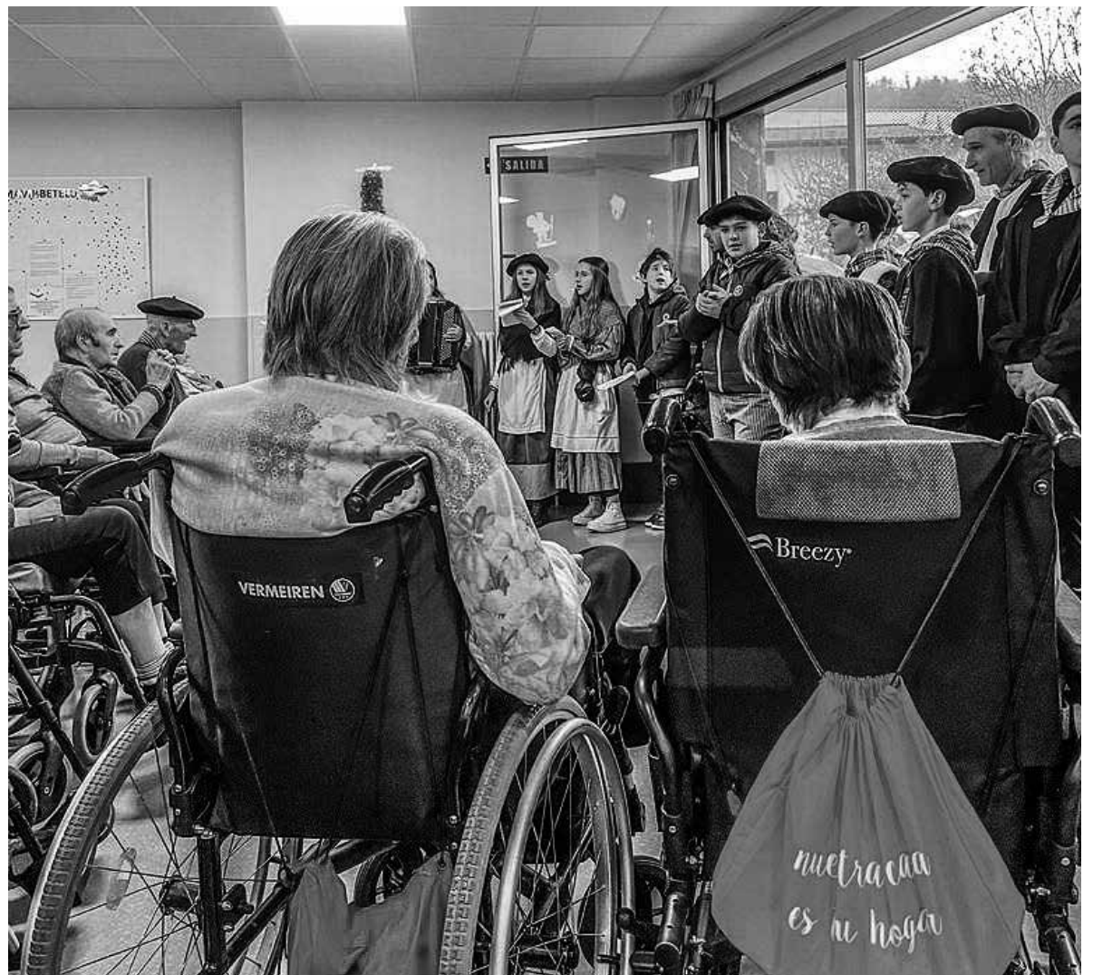
Nuestra música es tu música.

Estas Navidades tuvimos la suerte de que la escuela de Betelu diera el pistoletazo de comienzo. Llegaron en kalejira hasta nuestra residencia y pudimos disfrutar de la alegría y el bullicio de los villancicos y la música que nos ofrecieron. Consiguieron arrancar el arte y los cantos de nuestros residentes haciendo intercambio de villancicos. El 24 de diciembre recibimos al Olentzero, y varias personas de la comitiva llenaron de música y baile nuestra residencia para celebrar la Nochebuena. El 28 de diciembre la Escuela Municipal de Música Aralar nos visitó inundando nuevamente de música, fiesta y felicidad nuestra casa, un intercambio musical intergeneracional de enorme emotividad. Tuvimos unas navidades muy musicales, alegres y festivas, como no podía ser menos en nuestra tierra, en la que la música y la alegría siempre son una excusa de encuentro y celebración.