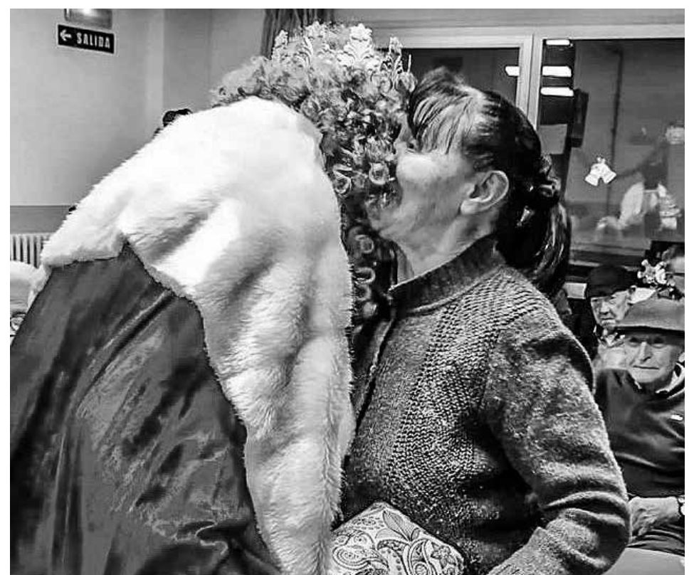
Entrega de presentes reales.

El 5 de enero, como es tradición, sus Majestades los Reyes Magos de Oriente visitaron nuestra residencia y entregaron unos presentes entre nuestros residentes. Un momento entrañable que nos hizo sentirnos como niños de nuevo y que nos aportó mucha emoción e ilusión. Es fantástico observar cómo la inocencia no se pierde con los años tanto como pensamos. Y cómo momentos como este, muy relacionados con la infancia, se extienden entre todos nosotros independientemente de nuestra edad y generación.