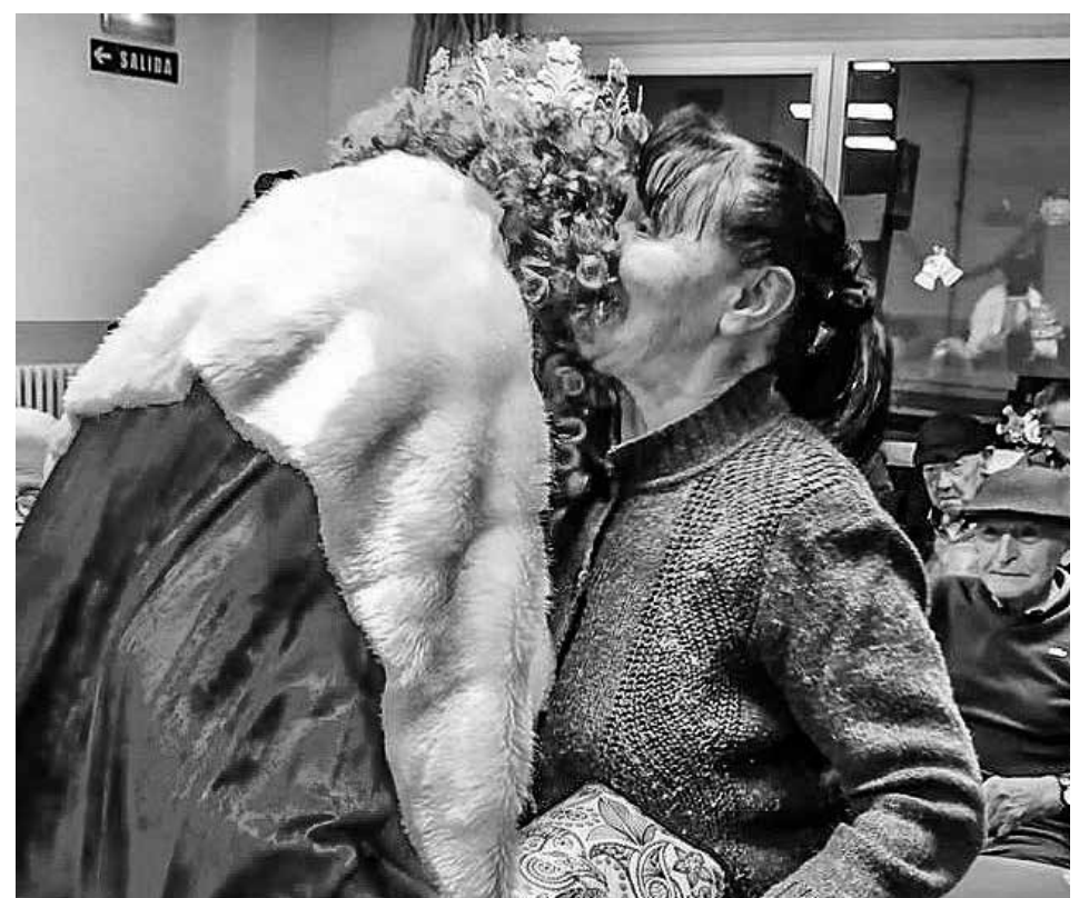
Entrega de presentes reales.

El 5 de enero, como es tradición, sus Majestades los Reyes Magos de Oriente visitaron nuestra residencia y entregaron unos presentes entre nuestros residentes. Un momento entrañable que nos hizo sentirnos como niños de nuevo y que nos aportó mucha emoción e ilusión. Es fantástico observar cómo la inocencia no se pierde con los años tanto como pensamos. Y cómo momentos como este, muy relacionados con la infancia, se extienden entre todos nosotros independientemente de nuestra edad y generación.