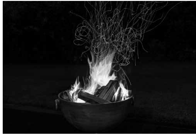
Fuego mágico de Santa Águeda.

Según la tradición religiosa, Águeda fue una virgen y mártir siciliana del siglo III que fue condenada a que le cortaran los pechos por rechazar al tirano Quinciano, que quería yacer con ella cuando ya había ofrecido su virginidad a Dios. Tras ser torturada, fue arrojada viva sobre carbones. La celebración de la fiesta de Santa Águeda, que se celebra el 5 de febrero, está muy arraigada en la cultura vasca y navarra. En nuestros pueblos son conocidos los grupos de jóvenes que, en vísperas de Santa Águeda, salen a la calle a cantar. Entonan las coplas dirigidas a la mártir Águeda, a quien se atribuyen multitud de poderes como espantar los malos espíritus y enfermedades del ganado. Santa Águeda es, además, la patrona de las mujeres, abogada especial de las nodrizas, madres lactantes y contra “el mal de pechos”; y se le atribuyen poderes en materia de fertilidad. La mitología vasco-navarra tiene un papel fundamental en este rito. Los coros cantan mientras golpean rítmicamente el suelo con sus makilas o báculos, llamando así al despertar de la tierra. Antiguamente, eran los hombres solteros o