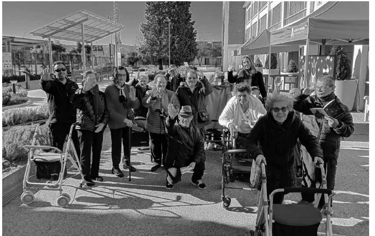
Salida al Belén Monumental de Alcalá de Henares.

Con la llegada del mes más esperado del año por todos nosotros, diciembre nos llenó de alegría y compañía a través de diferentes eventos y actividades de Navidad. Comenzamos por la decoración de todo el centro para ambientar estas fechas tan queridas en colaboración con los residentes, quienes en talleres especiales nos ayudaron a diseñar los adornos. Continuamos con diversas actuaciones tanto de artistas como de colegios, centros de día y parroquias, además de la celebración mensual de los cumpleaños, donde bailamos y cantamos al ritmo de los villancicos. Fuimos cocineros durante un día haciendo rosquillas para todos, costureros y escritores realizando postales navideñas para contestar de vuelta a los alumnos de los colegios. Además, fuimos bailarines en una zumba con ritmo navideño y disfrutamos de la película tradicional La gran familia. Nuestras mejores fotos fueron durante las salidas para visitar el belén monumental de nuestra localidad y ver las luces de Torrejón mientras comíamos unos churros con chocolate para combatir el frío. Terminamos el año con las pruebas y