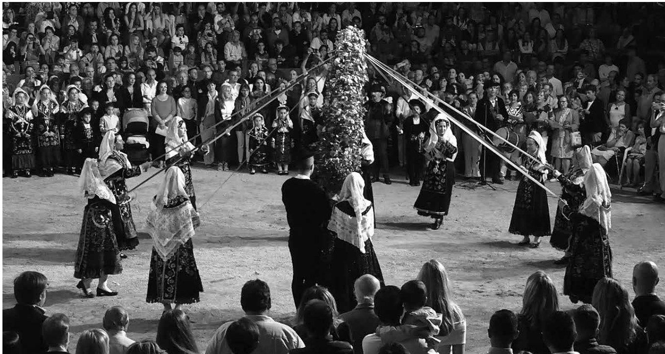
El baile del cordón.