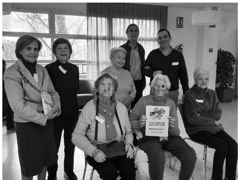
Yincana del Día Mundial del Voluntariado.

El 5 de diciembre, el Día Mundial del Voluntariado, contamos con la colaboración especial de cinco compañeros de oficinas centrales para participar durante la mañana en diferentes actividades. Pasamos una fantástica jornada. Los residentes y compañeros disfrutaron de una yincana dividida en equipos y con retos diferentes donde ponían a prueba la coordinación, el equilibrio y la marcha, entre otros componentes motores. Al finalizar la actividad, hicimos un recuento de las puntuaciones y repartimos diplomas de participación y medallas para el equipo ganador. Lo importante fue la alegría e ilusión con la que participaron todos. Esperamos que vuelvan a visitarnos y su colaboración en un futuro cercano.