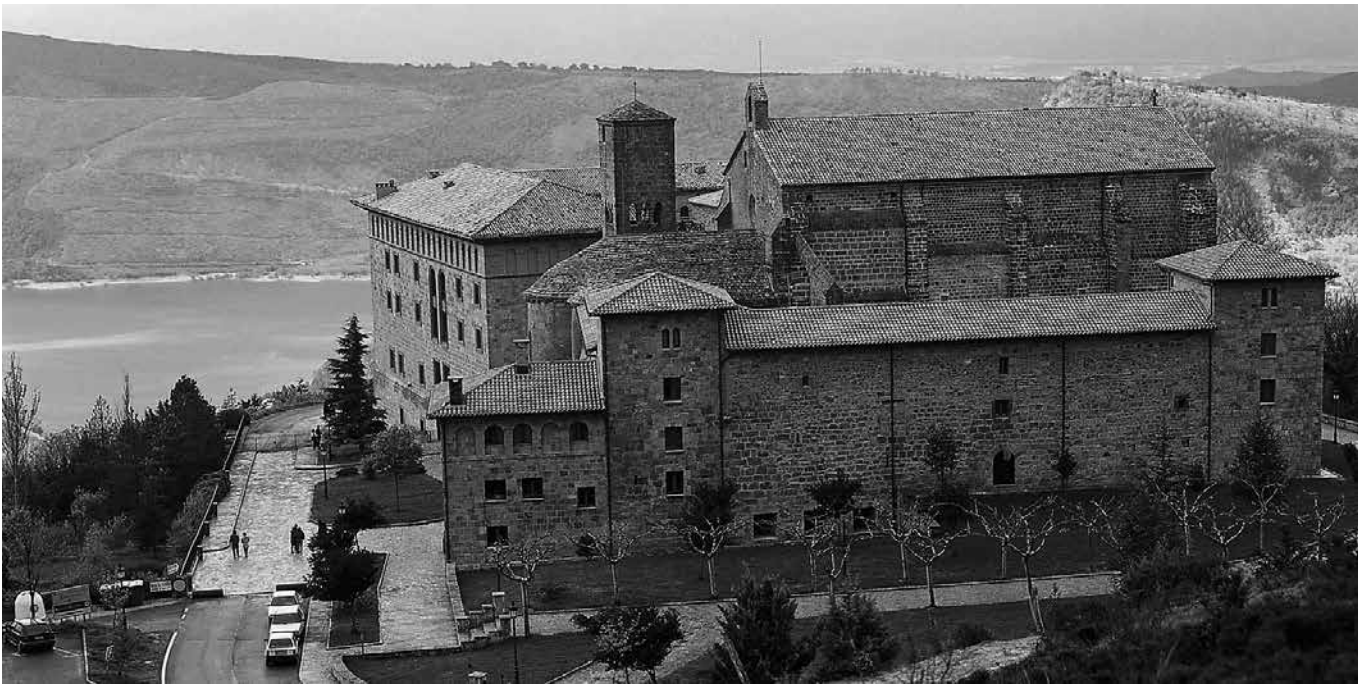
El Monasterio de Leyre.

En las profundidades del Monasterio de Leyre, en Navarra, se encuentra un antiguo manuscrito conocido como el Código de Leyre. Este manuscrito, datado en el siglo XI, es un tesoro histórico que contiene cantos litúrgicos únicos y es considerado uno de los primeros ejemplos de notación musical en la península ibérica. Su preservación y significado en la música y la historia de Navarra lo convierten en un valioso secreto cultural. Este código fue descubierto en el