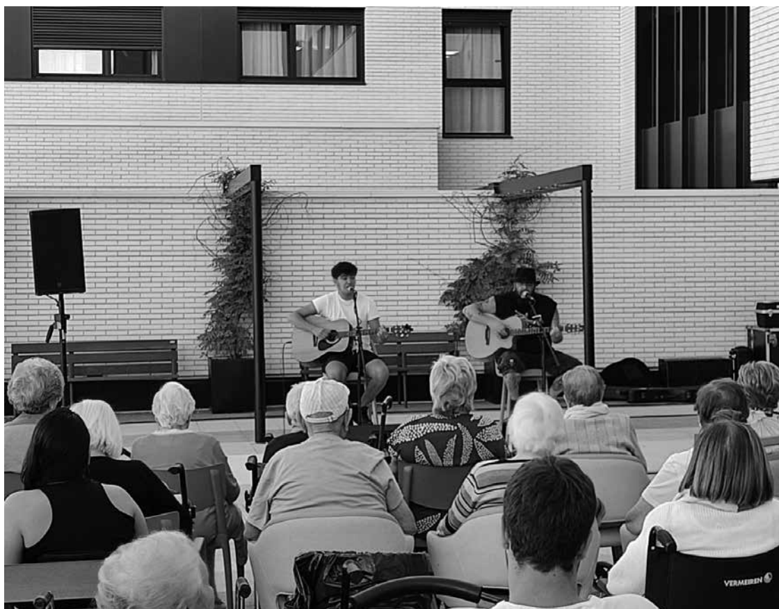
Concierto de Kutxi Romero y su hijo.

El 28 de septiembre tuvimos la suerte de contar con el grupo musical Marea dentro de nuestras instalaciones. Disfrutamos de un maravilloso concierto acústico dirigido por Kutxi Romero y su hijo. El concierto tuvo lugar en el amplio patio de Amavir Valle de Egüés, donde pudimos recogernos y acomodarnos plácidamente. El sonido acústico de las canciones se mimetizó con la buena temperatura de aquella tarde y pudimos disfrutar de un agradable espectáculo en familia. Kutxi Romero y su hijo cantaron versiones acústicas de algunas de sus canciones más conocidas y, además, versionaron y homenajearon a muchos otros artistas. El concierto duró aproximadamente una hora y todos, incluidos familiares y técnicos del centro, disfrutamos de ver a nuestros mayores tan alegres. Sin lugar a dudas, fue una tarde excepcional la que nos hicieron pasar. Para dar por finalizada la visita, el cantante nos concedió un poco de su lado más humorista y terminamos por hacernos una foto en familia, gracias Kutxi Romero e hijo y a todo el equipo de sonido.