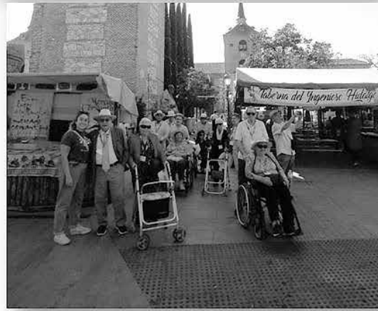
Nuestros mayores en las excursiones.