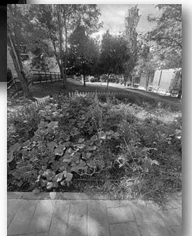
El espacio para ejercicios biosaludables, la sala de cine y el huerto.