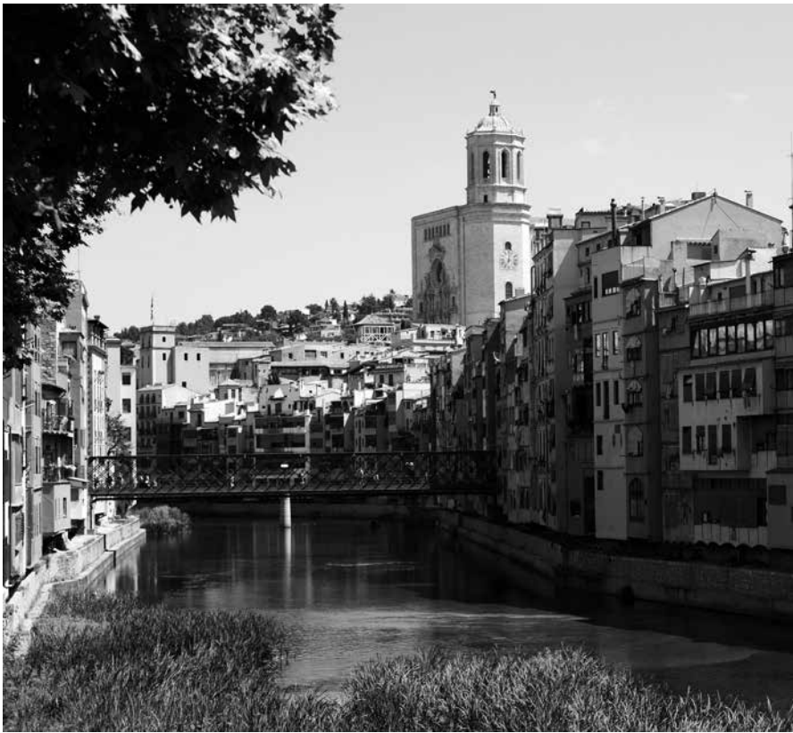
Girona y la leyenda de San Narciso.

Una de las leyendas más características de Girona es la de las moscas de San Narciso. El milagro de las moscas sucedió, según cuentan, en septiembre de 1285, cuando el ejército del rey de Francia, Felipe, asedió Girona con motivo de sus trifulcas con el rey Pedro de Aragón. Aunque la ciudad capituló sin lucha, los franceses al entrar en la ciudad, robaron, insultaron y oprimieron a los gerundenses; asaltaron iglesias burlándose de los objetos de culto y, finalmente, profanaron el cuerpo incorrupto de San Narciso, y le rompieron un brazo. Del cuerpo del santo empezaron a salir unas moscas gigantes que se pusieron a picar furiosamente