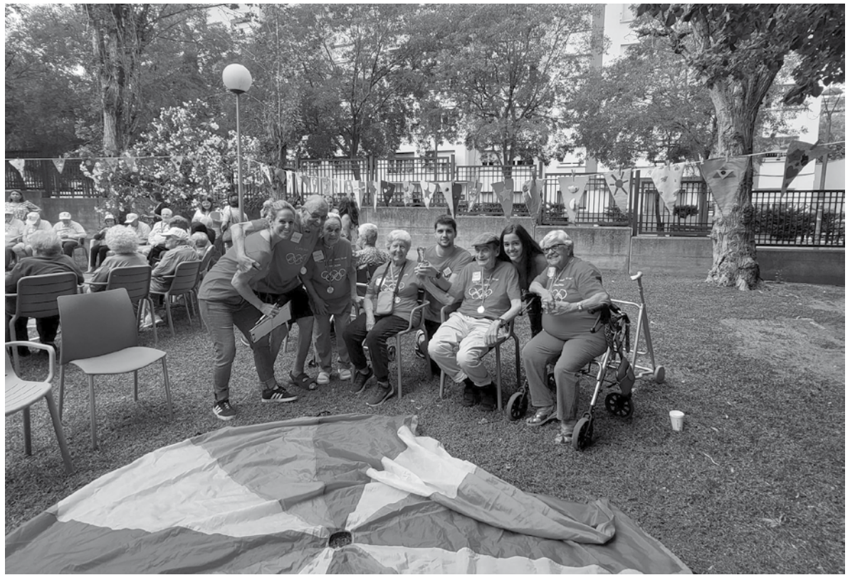
Amavir Sant Cugat, campeones de las gero-olimpiadas 2023.

El pasado día 3 de octubre se celebraron en la residencia Sant Cugat (Santa Rosa), las Olimpiadas de “la gent gran”. Iniciamos el día entregándoles a nuestros 5 representantes una camiseta de color rosa, que nos identificaba como la residencia Amavir Sant Cugat. A continuación, nos dirigimos al lugar donde se realizarían las Olimpiadas. Una vez allí, nos juntamos con otras 7 residencias de Sant Cugat y cada una de ellas era la encargada de organizar uno de los juegos. Antes de empezar repartieron desayuno a todos los participantes, y una vez que tenían las energías cargadas, llenos de ilusión ¡empezaron los juegos! Cada uno de estos juegos tenía su puntuación y sus propias reglas. Muchos de ellos eran pruebas de puntería, como baloncesto, bolos... En otros, los participantes tuvieron que sacar a relucir toda su habilidad como en el fútbol, la pesca o el cricket con el objetivo de conseguir la mayor cantidad de puntos. Una vez finalizados los juegos se desvelaron las puntuaciones totales de cada una de las residencias. Y el ganador de las olimpiadas 2023 fue... ¡Amavir Sant Cugat! La organización nos hizo entrega