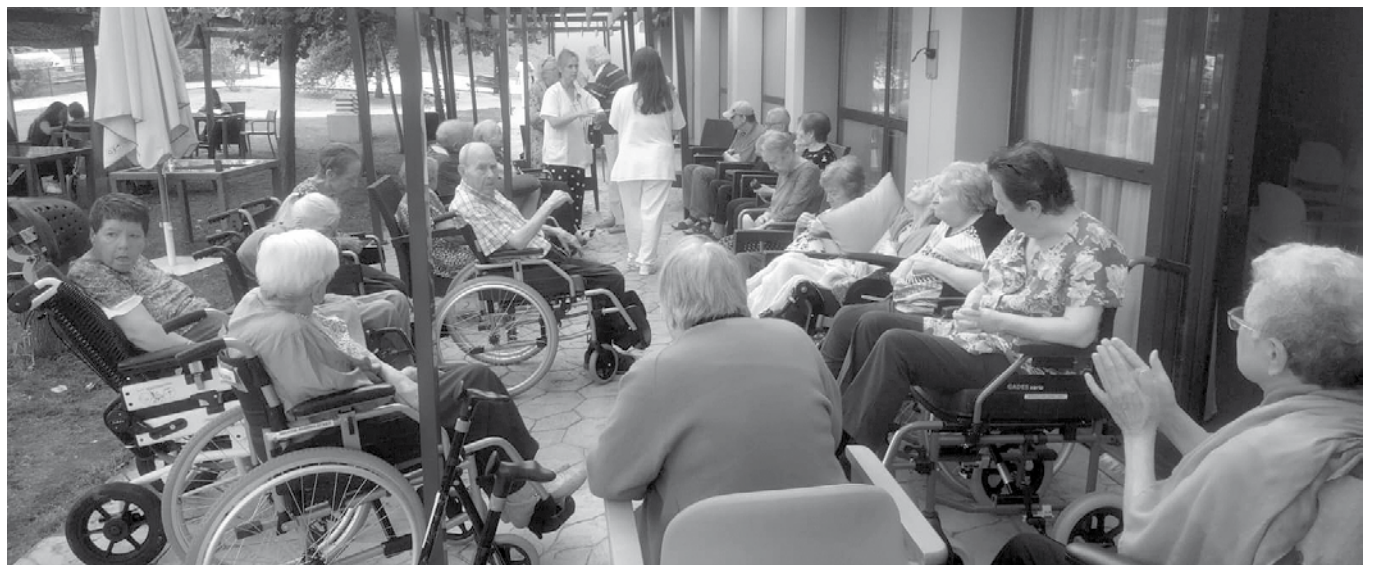
Algunos de nuestros residentes en el jardín.

El 21 de septiembre se conoce como el Día Mundial del Alzheimer y, como cada año, nuestro centro aprovechó la ocasión para poder reunir a residentes y familias y, junto con el equipo técnico de Amavir, disfrutamos de este día tan especial en el jardín del centro. El tiempo nos acompañó, y aprovechamos para realizar un taller de reminiscencia, donde a través de la música reconocimos melodías que nos transportaron al pasado y que, con muy buenas sensaciones, disfrutamos bailando con los compañeros.