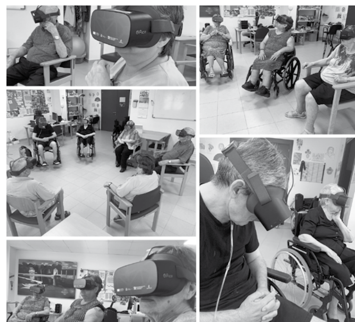
Residentes con gafas de realidad virtual.

La realidad virtual ha llegado a Las Hazas en forma de gafas, tablets y pizarras interactivas gracias a la Comunidad de Castilla-La Mancha, para que los mayores comiencen a familiarizarse con las nuevas tecnologías y como una buena herramienta de trabajo para nosotros, ya que nos permite realizar terapias más interactivas y divertidas para ellos. Trabajar con las nuevas tecnologías tiene múltiples beneficios: se pueden estimular y rehabilitar las capacidades cognitivas y físicas, mejora el estado de ánimo, modificando conductas agitadas, nerviosas o incluso tiene beneficios en patologías como la ansiedad o la depresión. Simula situaciones cotidianas de la vida, pudiendo así trabajar las funciones cognitivas de una manera más realista.