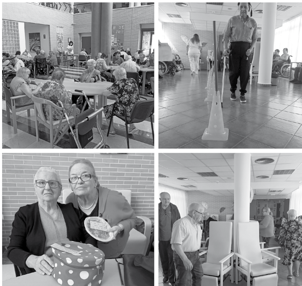
Imágenes de algunas de las actividades realizadas.

Un año más comenzamos el otoño celebrando la tan esperada Feria de Hellín en honor a su patrona. En Las Hazas no dejamos escapar esta oportunidad para realizar actividades que hacen que nuestros mayores se integren y disfruten de la celebración de esta fiesta. Durante la semana de feria pudieron realizar talleres de cocina, cantar en el karaoke e incluso tuvieron su particular tómbola "Las Hazas". El martes de feria tuvimos la ya tradicional comida y la participación en el programa de actos que desde el ayuntamiento se llevó a cabo para el Día Internacional del Mayor. Nuestros mayores pudieron disfrutar de la copla a mano de artistas locales. También nos visitaron la rondalla del centro de mayores, el grupo de sevillanas de la Universidad Popular y este año, como novedad, el grupo de baile urbano STG. Aprovechamos estas líneas para darles las gracias a todos por contar con Las Hazas durante las fiestas. El fin de la feria y la llegada del otoño/invierno no significa que dejemos de realizar actividades extraordinarias. Halloween está empezando a hacerse hueco y celebrar los cumpleaños del mes de octubre entre telarañas y monstruos variados es ya un clásico. No podemos olvidar el día de la castañera, don-