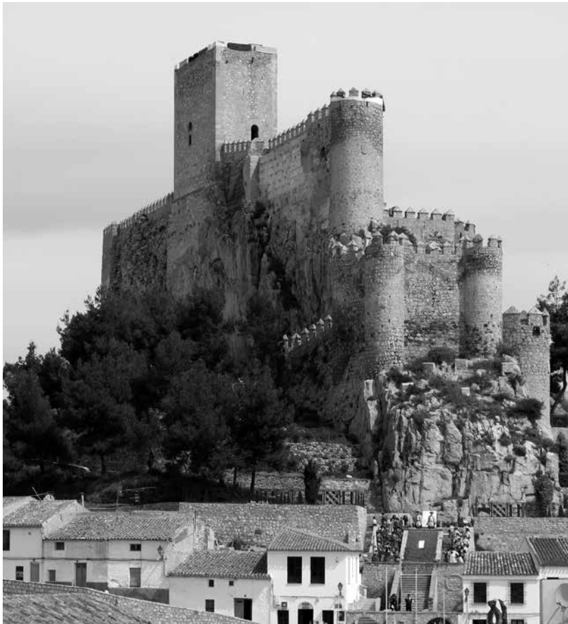
El Castillo de Almansa.