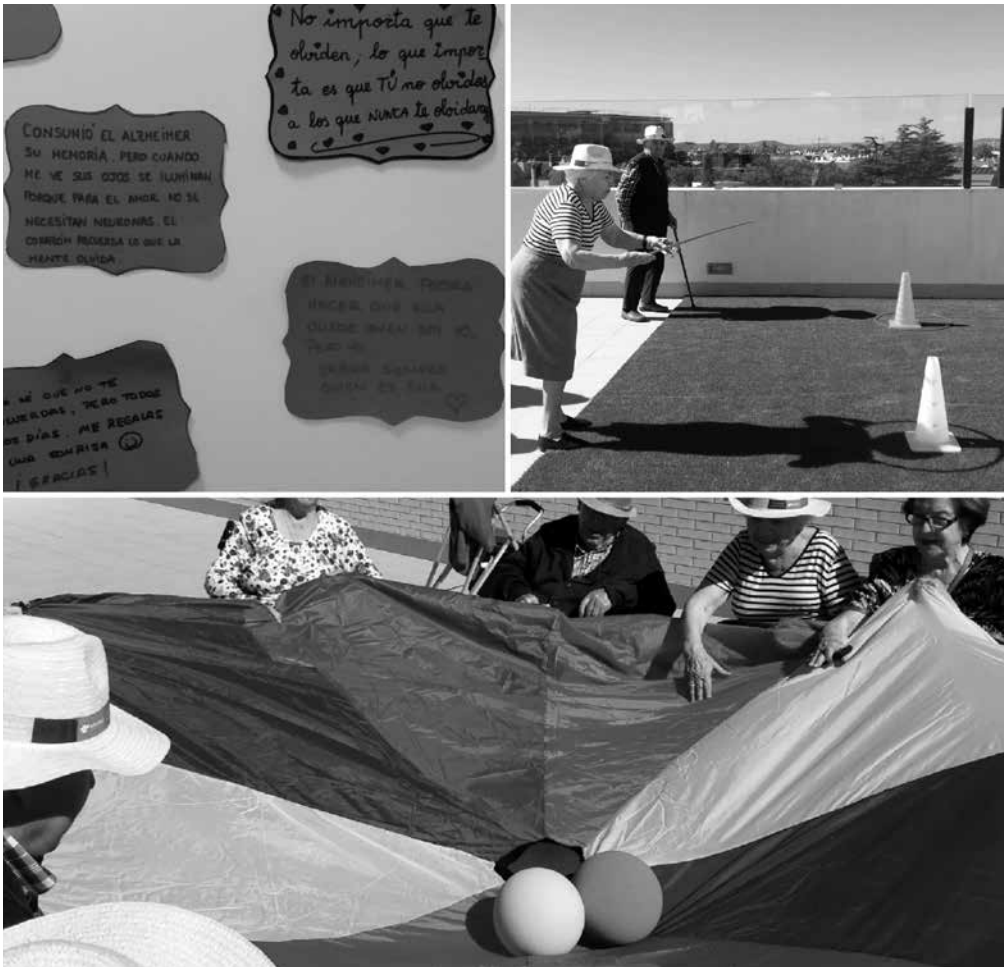
Algunas de las actividades realizadas durante la semana.

El 21 de Septiembre se celebra el Día Mundial del Alzheimer, proclamado por la Organización Mundial de la Salud. Además de la enfermedad de alzhéimer existen otros tipos de demencia, como son la demencia vascular, demencia por cuerpos de Lewy, demencia fronto-temporal, etc., todas ellas importantes y con un impacto a nivel físico, psicológico y social. Es por ello que en nuestra residencia quisimos conmemorar ese día con una serie de actividades realizadas durante la semana. Con ayuda de nuestros usuarios, comenzamos la semana creando un mural compuesto de tarjetas de cartulina. En estas tarjetas, trabajadores, familiares y algunos usuarios escribieron una frase desde la mirada de una persona con demencia y desde la mirada de su cuidador, con la finalidad de dar visibilidad y crear empatía. Además, se realizó una divertida “Yincana contra el alzhéimer en la que todos ganan”, en la cual, participaron nuestros usuarios organizados en un equipo rojo y en un equipo amarillo, con diferentes pruebas tanto psicomotrices como cognitivas, adaptadas a los participantes para facilitar su consecución. Esta jornada se llevó a cabo en nuestra