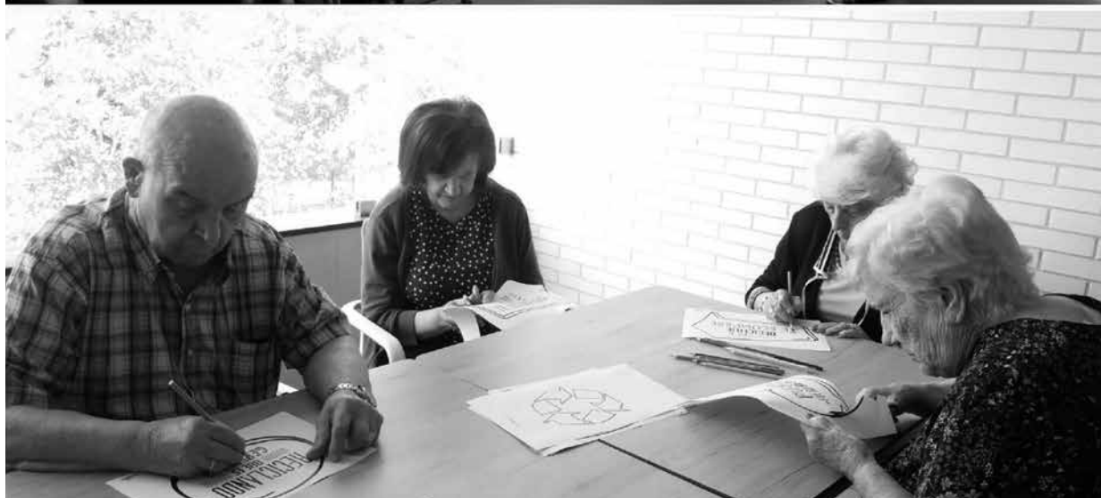
Nuestros usuarios durante la actividad y tras realizar el mural.