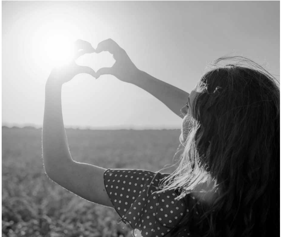
La vitamina D y el sol.

La vitamina D, también es conocida como la vitamina del sol. Su principal función es la de favorecer la absorción de calcio y fósforo desde nuestra dieta y mantener una estructura ósea saludable. La exposición de la piel a la luz solar es la manera más eficaz de asegurar la obtención de una cantidad suficiente de vitamina D. El mejor momento para obtener una cantidad suficiente de esta vitamina, a partir de la exposición al sol, son los meses de primavera y verano. Como todos conocemos, es necesaria para el metabolismo del calcio y contribuye a la absorción y utilización de calcio y fósforo. Ayuda a mantener huesos y dientes en condiciones normales. Además, es necesaria para el funcionamiento de los músculos y para el mantenimiento del sistema inmunológico. En invierno y primavera es aconsejable salir entre 10 y 12 horas, mientras que en verano se considera que para metabolizar la vitamina D es suficiente con estar solo entre 15 y 30 min al sol, siempre durante las horas en las que la radiación solar no sea muy alta, ya que si no supondría un riesgo a la hora de