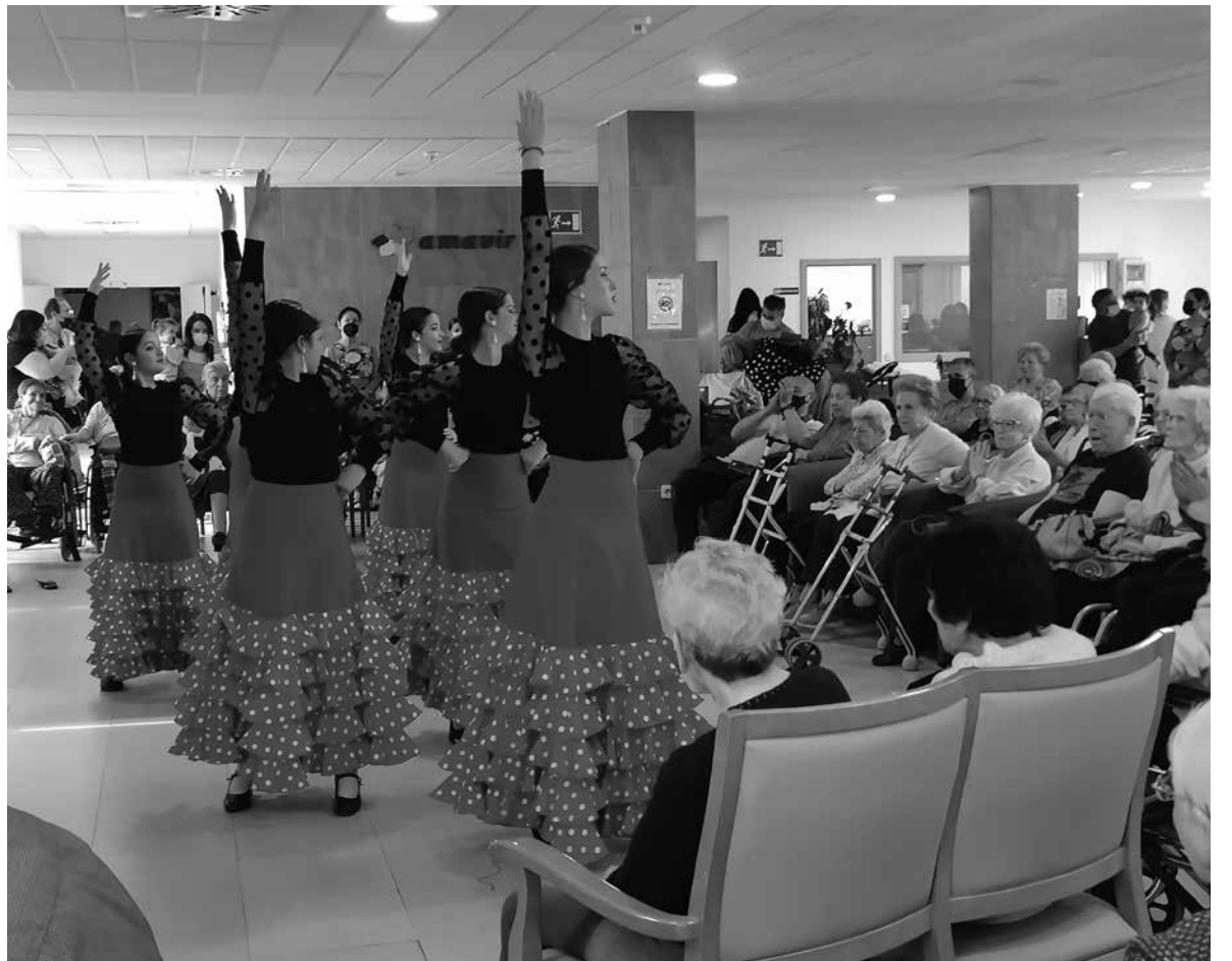
Actuación de la escuela de baile “Deseos Danza” en Amavir Torrejón.

Durante el mes de abril celebramos en nuestra residencia la tradicional Feria de Abril. Disfrutamos de la actuación de la Escuela de Baile “Deseos Danza” de Torrejón de Ardoz, que cantaron y bailaron para nuestros residentes durante la tarde del día 21 al ritmo de sevillanas y flamenco. Además, se preparó una decoración en la entrada de la residencia de mantones, abanicos y una cruz de rosas hechas por los residentes. También contamos con la actuación de Chema Reyes para poner el broche final a esta semana llena de música y baile. Además de la Feria de Abril, también fue el mes de las letras y por ello realizamos varias actividades relacionadas como son: la visita a la biblioteca municipal para realizar un trueque literario, la visita a la feria del libro situada en la plaza mayor de Torrejón de Ardoz o el rincón de lectura donde los residentes y usuarios de centro de día compartieron algunos de sus escritos o lecturas