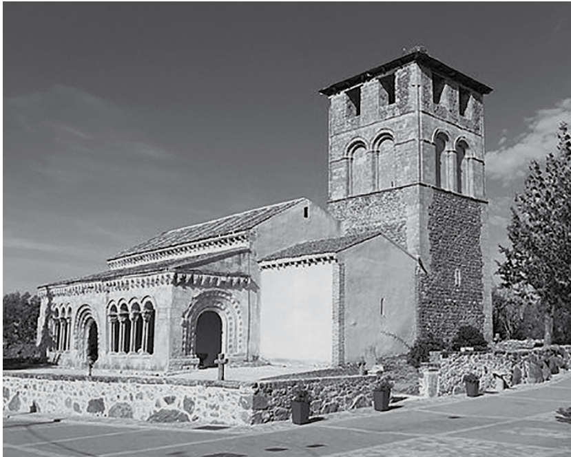
La iglesia de Adrada del Pirón.