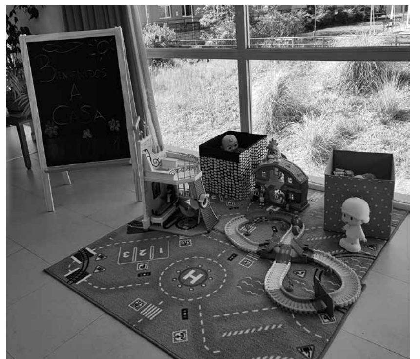
La nueva zona infantil de nuestro centro.

Desde Amavir Torrejón queremos que os sintáis como en casa y por ello hemos decidido crear una nueva zona de juegos en el centro para que los más pequeños también puedan disfrutar de la visita a sus mayores y sentirse uno más dentro de esta gran familia. Además, este espacio de juegos está situado en la entrada, en una zona común donde todos los residentes, usuarios del centro de día y familiares puedan disfrutar de la buena energía y sonrisas que siempre desprenden los más pequeños. Nos gustaría agradecer a la empresa Bandai, puesto que gracias a su donación de juguetes ha sido posible generar este espacio.