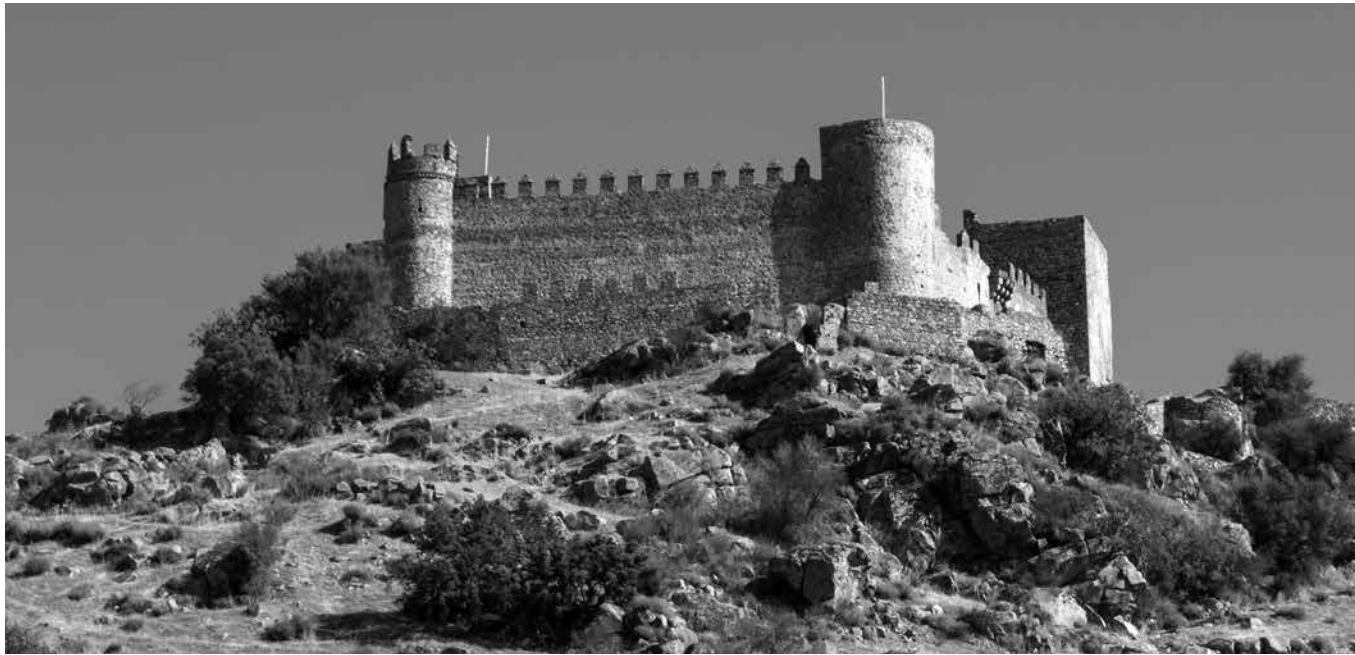
Castillo de Burguillos del Cerro.