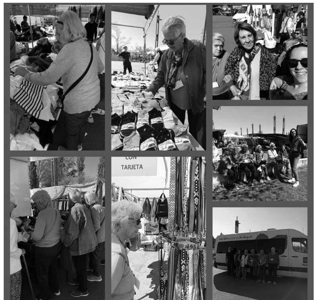
Residentes y usuarios del centro de día realizando sus compras.

Como todos sabemos, fomentar la autonomía es un punto clave que se trabaja desde el Departamento de Terapia ocupacional. Para ello se realizan diferentes actividades tanto en el centro como fuera de este y la última ha sido al mercadillo de Tres Cantos. Allí pudimos llevar a cabo diferentes tareas como: manejo del dinero, socialización, cálculo y aspectos relacionados con las AVDs. Este tipo de actividades lúdicas son muy bien acogidas por todos, ya que nos sacan de las dinámicas y rutinas del día a día. Además, si sumas un picnic en el parque central de Tres Cantos, es un éxito asegurado que tanto profesionales como residentes no dudaremos en repetir.