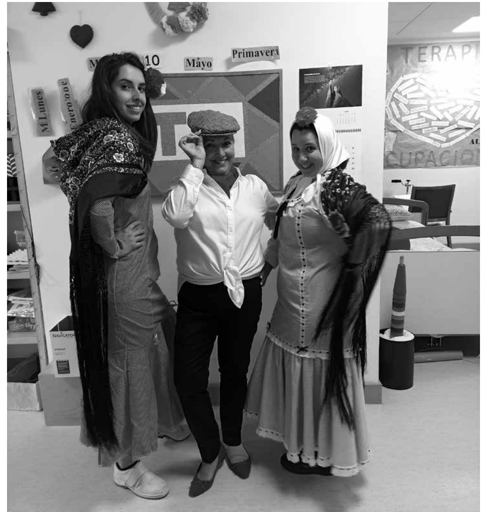
Nuestras chulapas y el chulapo.