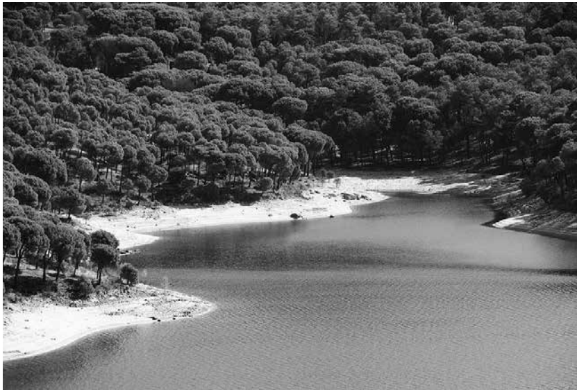
Un gran plan de playa en Madrid.

Existe una famosa canción sobre Madrid en la que se afirma que hay muchas cosas, aunque no playa, pero se equivoca. En la Comunidad de Madrid existen varias playas que no serán de agua salada y palmeras, pero son estupendas para refrescarse con estos calores, además de encontrarse a pocos kilómetros de Madrid. Empezamos por la conocida playa de la Virgen de la Nueva en el Pantano de San Juan (San Martín de Valdeiglesias). En el mismo municipio está la playa del Muro, donde se encuentra el Real Club Náutico de Madrid, ideal para darnos un paseo en barco. Además, hay varias calas como Lancha del Yelmo, Calas de Guisando y Cala Veracruz. En Aldea del Fresno se ubica la