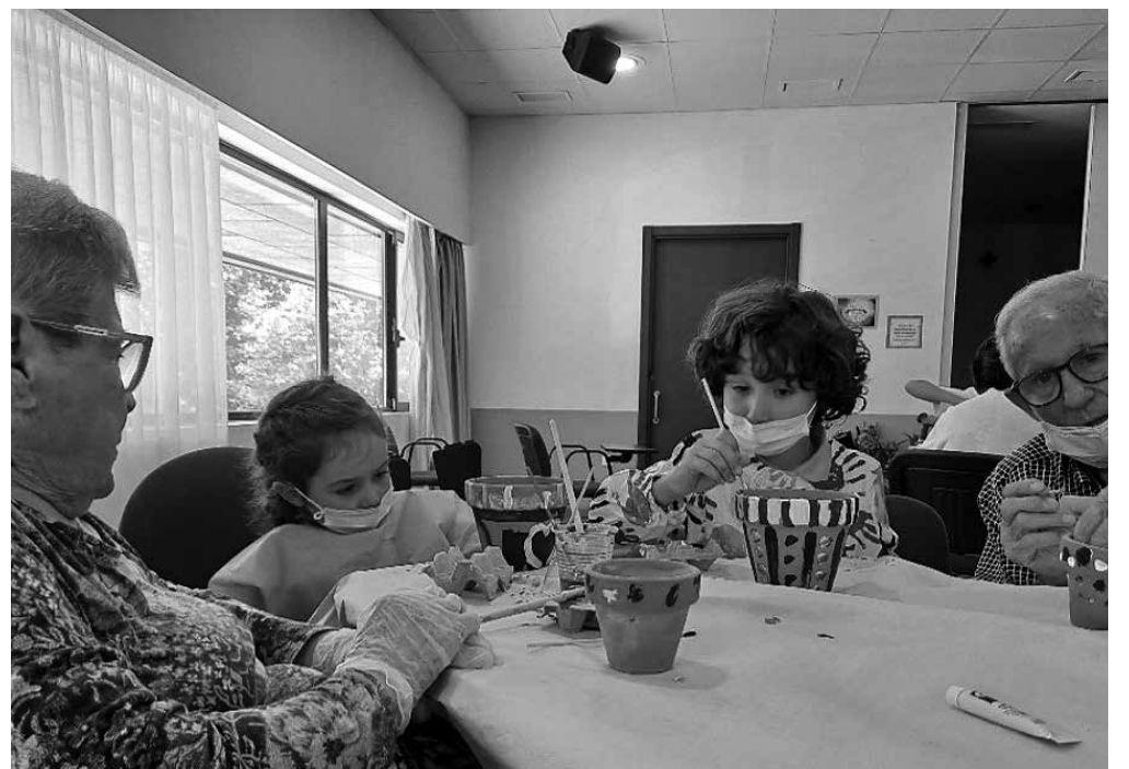
Nuestros mayores pintando macetas con los niños.

Vuelven los campamentos intergeneracionales a Amavir Puente de Vallecas que se llevarán a cabo del 26 al 30, durante la última semana de junio. Los campamentos intergeneracionales de Amavir están dirigidos a los niños, hijos de nuestros trabajadores, nietos o biznietos de los residentes. Durante esta semana los niños conviven con las personas mayores de la residencia desde la mañana hasta la tarde haciendo numerosas actividades conjuntas. Se trata de una experiencia muy enriquecedoras para ambos. El año pasado lo pasamos genial y estamos deseando repetir la experiencia y crear nuevos momentos inolvidables.