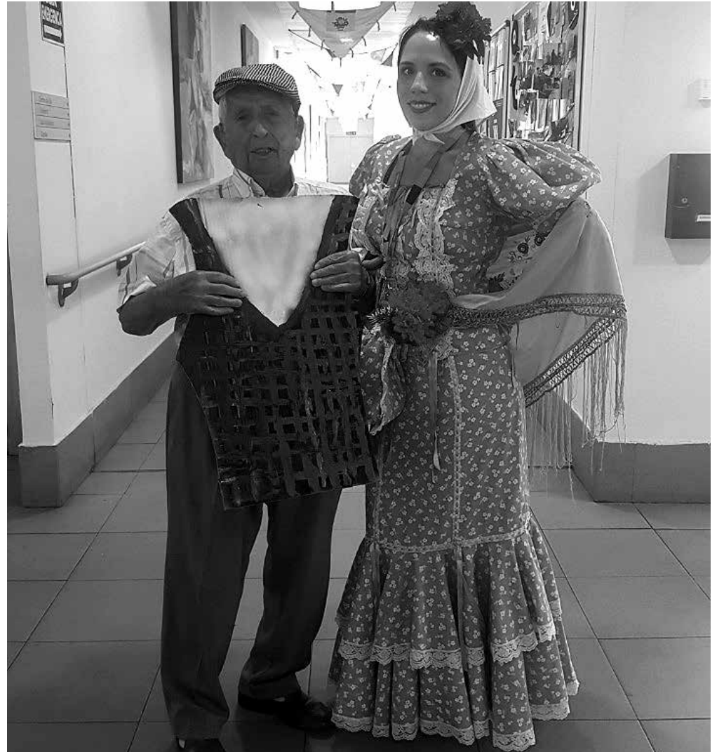
Luciendo palmito en San Isidro.

Una de las celebraciones más queridas por todos los madrileños son las fiestas de San Isidro. Estas fiestas patronales en honor a Isidro Labrador, patrón de Madrid, son celebradas en torno al quince de mayo. La ubicación principal de esta fiesta es la Pradera, que comparte nombre con el patrón en el madrileño distrito de Carabanchel. Aquí, en Amavir Puente de Vallecas, lo celebramos a lo grande con diferentes actividades. En primer lugar, decoramos el pasillo principal de nuestro centro con mantones y banderines. El miércoles 10 de mayo disfrutamos de una gran actuación musical que nos ofrecieron Hermandades del trabajo, un grupo muy querido por todos nosotros. Bailamos el chotis y otros bailes tradicionales típicos de Madrid. Además, el viernes de esa semana compartimos esta festividad en un photocall con familiares y residentes inmortalizando ese gran día. Feliz San Isidro a todos los madrileños/as.