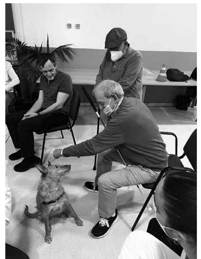
Nuestros residentes en compañía de Txistu.

mayores durante una hora en la que estuvieron realizando diferentes actividades de estimulación. Durante la sesión pudieron interactuar con el animal trabajando diferentes aspectos físicos, cognitivos y funcionales. Los participantes se mostraron muy contentos de recibir la visita de nuestra amiga canina. Sin duda, una experiencia que estarán encantados de repetir.