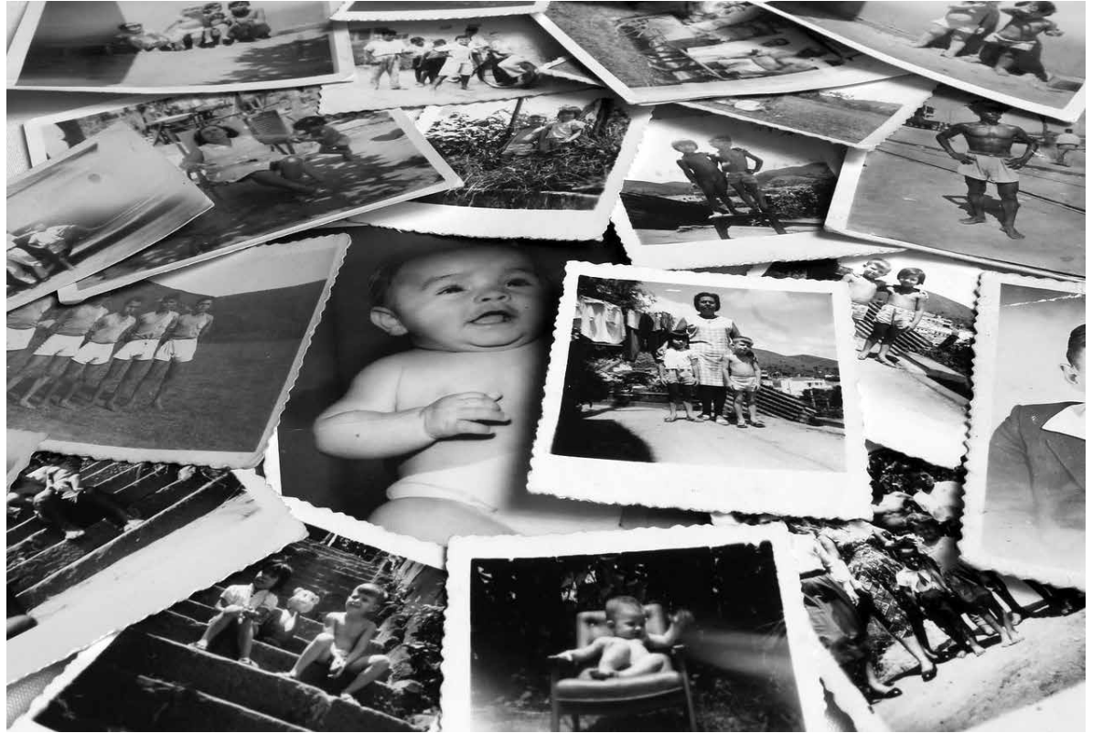
Los recuerdos son las fotografías tomadas por el corazón.

Todos olvidamos algunas cosas de vez en cuando. Aún así, la pérdida de memoria no es algo para tomar a la ligera. Aunque no hay garantías respecto a la prevención de la pérdida de memoria, hay ciertas actividades que podrían ayudarte, te contamos como: Incluye en tu rutina diaria la actividad física. Con esto aumenta el flujo sanguíneo que llega al cerebro ayudando a mantener la memoria activa. Mantén tu mente activa. Hacer crucigramas, leer, jugar a juegos con familia o amigos, etc., ayudaran a tu cerebro a mantenerse en forma. Haz amigos, socializa, diviértete. Busca oportunidades para ver a tus seres queridos, amigos u otras personas, especialmente si vives solo o realiza actividades de ocio y tiempo libre que te gusten. Duerme lo mejor posible. El sueño es muy importante para el descanso del cerebro y ayuda a consolidar los recuerdos. Un adulto debe dormir una media de entre 7 y 9 horas al día. Sigue una alimentación saludable. Comer frutas, verduras, proteínas bajas en grasas, no abusar del alcohol y no consumir drogas puede contribuir al bienestar de tu cerebro. Aunque la mala