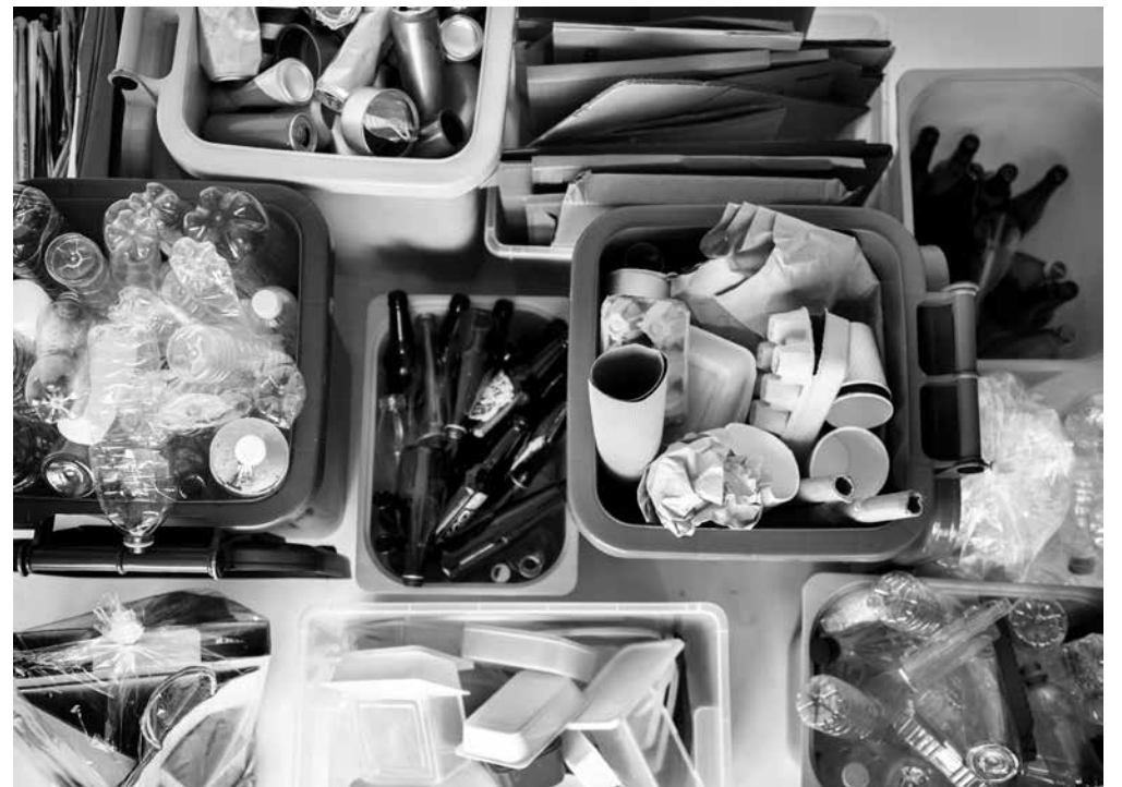
El reciclaje, una forma de cuidar el medioambiente.

En el marco de la celebración del Día Mundial de la Tierra, nuestra casa llevó a cabo una emocionante dinámica con el objetivo de promover la conciencia ambiental y el cuidado del medioambiente entre nuestros residentes. La iniciativa buscó resaltar la importancia de mantener un planeta saludable para las generaciones presentes y futuras, involucrando activamente a los adultos mayores en esta causa global. La jornada comenzó con una charla educativa sobre la importancia de la conservación de la naturaleza y la adopción de prácticas sostenibles en la vida diaria. Los residentes, entusiasmados por aprender y participar, escucharon atentamente a los profesionales, quienes compartieron valiosos consejos sobre la reducción del consumo de recursos, el reciclaje y la reutilización. La dinámica relacionada con este día no solo ha dejado una huella ambiental po-