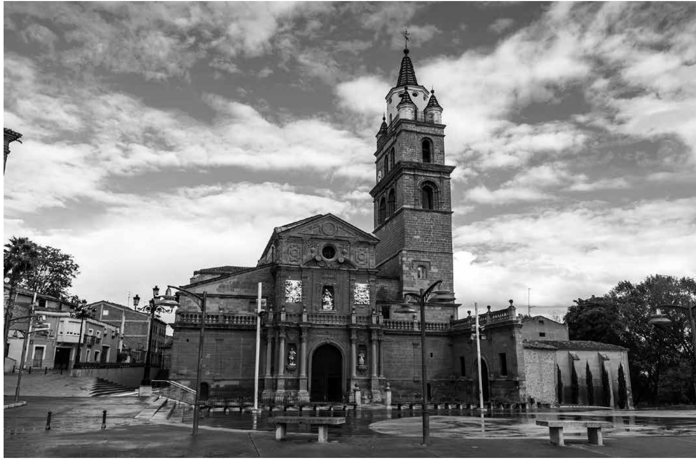
Catedral de Calahorra.

En la convergencia del Ebro y el Cidacos se encuentra Calahorra (La Rioja), famosa por su producción agrícola, sus viñedos y su antigüedad. Destacan entre sus monumentos la Catedral de Santa María, el Palacio Episcopal y la iglesia de San Andrés. La huerta calagurritana proporciona productos de gran calidad y permite comer durante todo el año verduras diferentes. Se pueden comprar directamente