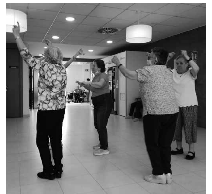
Nuestros residentes bailando.

Quien a Toledo vaya. Pare en Getafe. Pare en Getafe. Que hay en villa tan noble. Buen hospedaje. Buen hospedaje. Y getafeñas. Que son la sal del cielo. Y de la Tierra. Y de la Tierra.