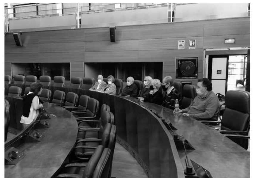
Nuestros residentes en la Asamblea de Madrid.