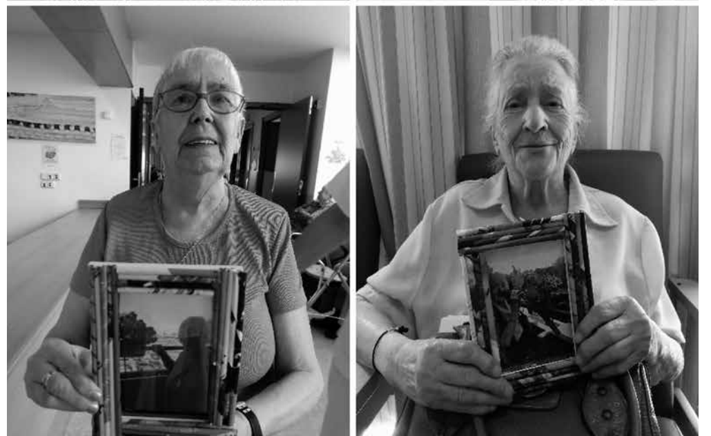
Nuestras residentes con sus manualidades.