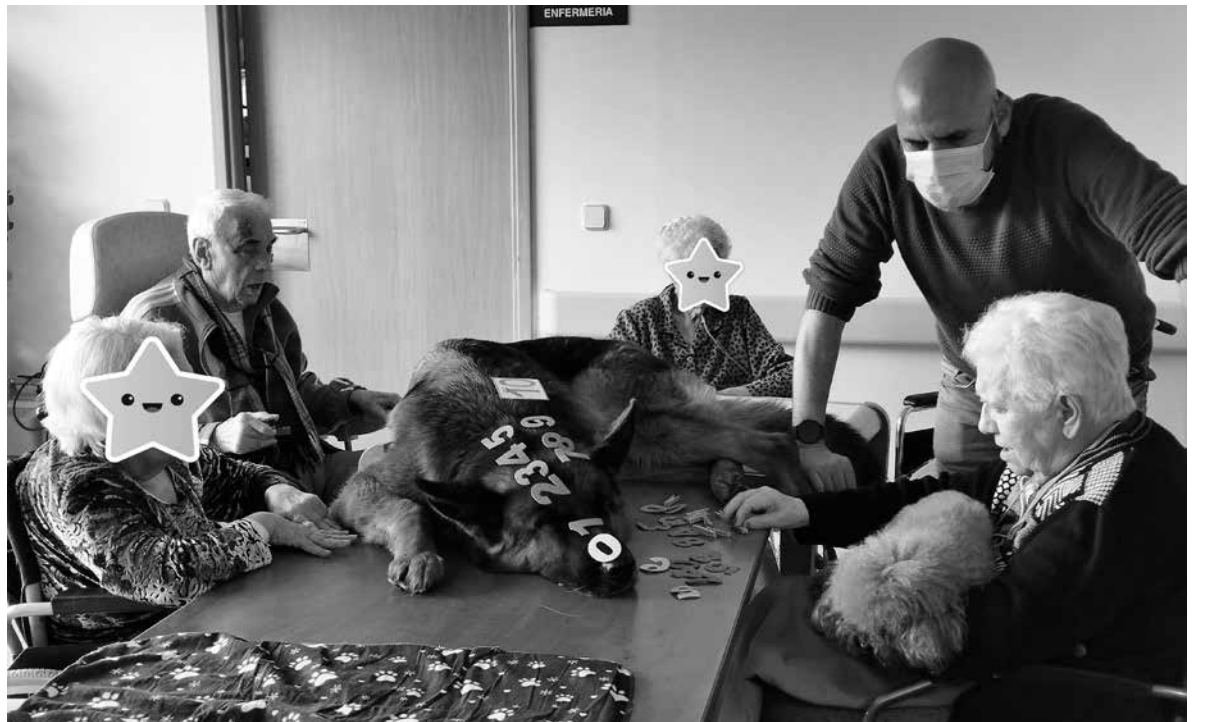
Los residentes trabajando con los perros.