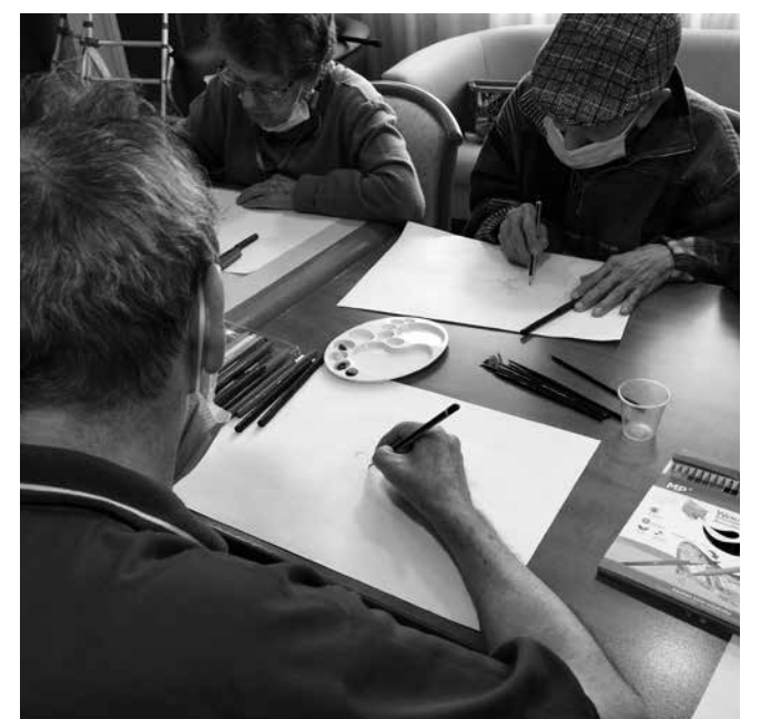
Algunos participantes comenzando la actividad.

como vía terapéutica. Además, promueve el desarrollo personal, el autoconocimiento y la expresión emocional. Se puede trabajar a través de diferentes manifestaciones artísticas como son la pintura, el teatro, el modelado, la danza, la música, etc. En nuestro caso, se ha intervenido a través de la pintura, donde se ha trabajado con diferentes materiales para desarrollar así la imaginación y la creatividad.