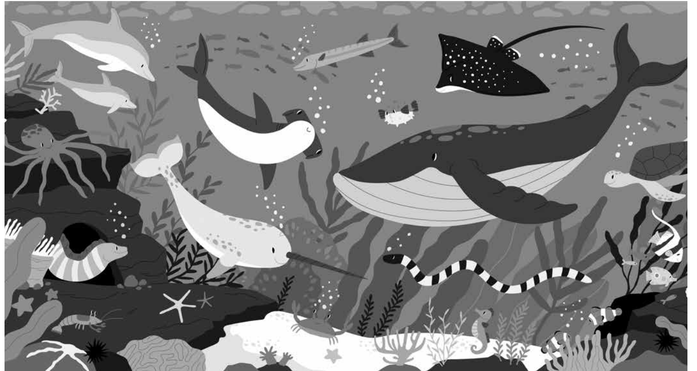
La vida marina de los océanos.

El Día Mundial de los Océanos, que se celebra cada 8 de junio, es una oportunidad para reflexionar sobre la importancia de los océanos y la necesidad de protegerlos. Los océanos son fundamentales para la vida en la Tierra y albergan una gran diversidad de vida marina, pero están bajo amenaza debido a la contaminación y la sobrepesca. La contaminación de los océanos es uno de los mayores desafíos a los que nos enfrentamos. Los residuos plásticos son una de las principales fuentes de contaminación, causando la muerte de animales marinos y afectando la calidad del agua. Además, la sobrepesca está desequilibrando los ecosistemas marinos y poniendo en peligro la seguridad alimentaria de millones de personas. Para proteger los océanos, es