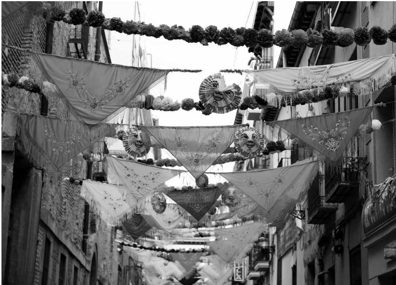
Decoración de la verbena.

Este año también celebraremos todos juntos la fiesta de la Virgen de la Paloma el 15 de agosto. Como ya es tradición veremos la zarzuela “La Verbena de la Paloma” en el comedor principal, donde las chulapas, el sereno, los guardias y el tabernero actuarán