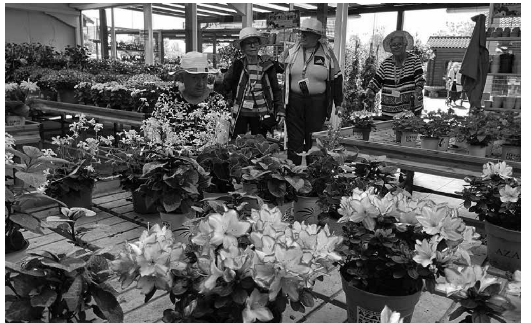
Nuestros residentes comprando las flores y plantas para el centro.

La época estival acaba de llamar a nuestra puerta y, en el centro, estamos preparados para disfrutar de un verano que, a buen seguro, estará lleno de grandes momentos, tantos como los que hemos vivido estos meses que dejamos atrás, donde ha habido cabida para multitud de actividades. Entre las más destacadas, las actuaciones musicales en directo que tanto nos gusta recibir y que siempre cuelgan el cartel de aforo completo como, por ejemplo, el grupo de sevillanas de uno de los centros de mayores de la ciudad. Hemos aprovechado nuestro tiempo disfrutando de gimnasia en el patio y también de una estupenda sesión de yoga donde se han trabajado diferentes aspectos de relajación y respiración, así como ejercicios de movilidad adaptados a las posibilidades de los participantes. También hemos tenido tiempo para acudir a un vivero cercano