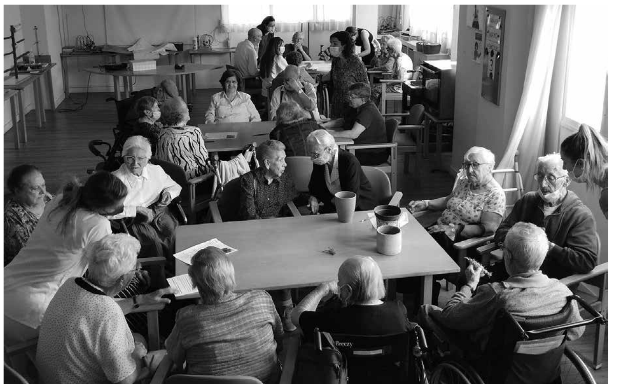
Eligiendo qué cultivar.