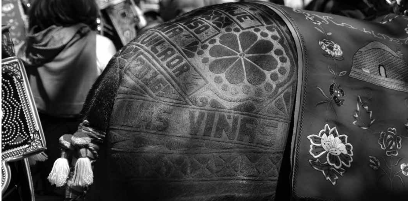
Mula adornada para la Romería.

Tomelloso, un bonito pueblo de Ciudad Real, celebra en primavera la Romería de la Santísima Virgen de las Viñas. Este día tan especial, los habitantes de Tomelloso caminan hacia la ermita de la Virgen acompañados de mulas y carrozas adornadas de forma pintoresca y luciendo sus característicos y coloridos adornos. Ubicada a 4 km del pueblo, a la ermita acuden miles de personas. Los tomelloseros se presentan a sus pies, preparados con comida y perolas para cocinar sus asados con cariño alrededor de ella. La ermita queda rodeada por kilómetros y ki-