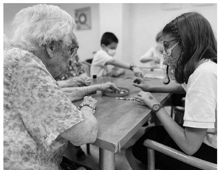
En el taller de pulseras y collares.

Junto a los alumnos de 5º de primaria del Colegio Santa María de la Providencia hemos puesto en marcha un proyecto de colaboración basado en el aprendizaje-servicio, un método educativo que integra el compromiso social con el aprendizaje de conocimientos, las habilidades, las actitudes y los valores al integrar las dimensiones cognitivas y éticas. Se favorece así la estimulación cognitiva y funcional a través de actividades manipulativas. Además, gracias al desarrollo conjunto de actividades mejora el estado anímico de los mayores y se fomentan las relaciones sociales y el aprendizaje bidireccional entre ambos grupos de población. Como broche final se realizó un mercadillo solidario, donde lo recaudado se destinó a la Asociación AFA.