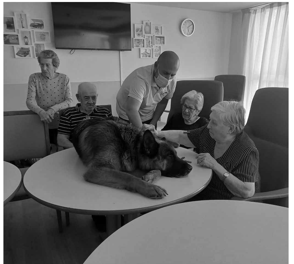
Nuestros residentes en la terapia con animales.

En Amavir Villaverde no nos hemos querido perder ni una oportunidad de disfrutar de buena música, buen tiempo y buena compañía. Desde que llegó el buen tiempo nuestra terraza y jardín están siendo los protagonistas para que todos podamos estar fuera y disfrutar de la naturaleza. El mes pasado nos visitaron rondallas con cuerpo de baile que hicieron que todos disfrutásemos de lo lindo de las fiestas de cumpleaños. Cantamos y bailamos moviendo el esqueleto sin parar. Os animamos a que todo el mundo baile y nos acompañéis en estas fiestas que tanto os gustan. En abril nos visitaron tres perritos maravillosos dentro de la acción de terapia con animales y que también nos dejaron arrebatados con su ternura. Además, la última semana de junio celebraremos en nuestro centro el campamento intergeneracional que tanto disfrutaron los mayores y niños la edición pasada, con actividades diseñadas para la colaboración entre ambos grupos.