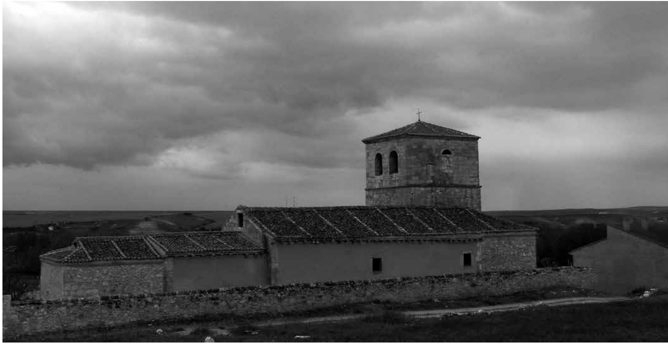
Iglesia de Nuestra Señora de la Asunción.