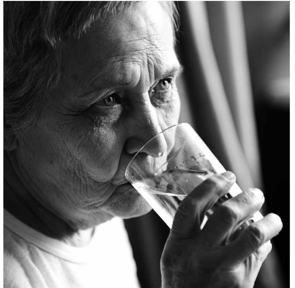
Una persona mayor bebiendo agua.