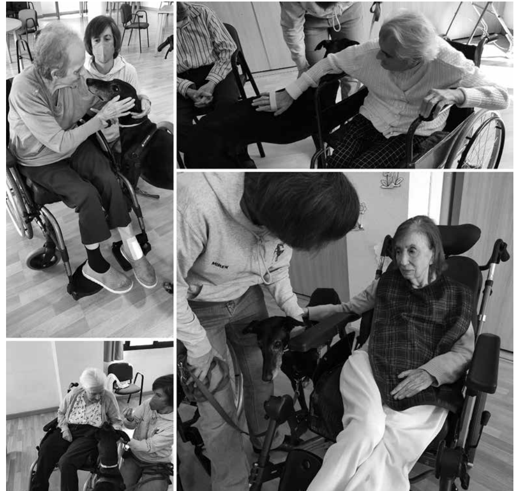
Disfrutando la visita de Tango.

En Amavir Villanueva hemos añadido a nuestras actividades la terapia con animales dos veces al mes. Gracias a que se realizó una sesión de toma de contacto en el mes de abril, se decidió que esta modalidad terapéutica debía estar entre el abanico de posibilidades que ofrece nuestra residencia. Esta terapia se ha realizado en dos ocasiones con diferentes grupos de residentes. Se ha podido comprobar que una gran cantidad de residentes da un paso adelante en sus capacidades cognitivas, con reacciones verbales y no verbales sorprendentemente buenas y algunas nunca antes vistas, además de crearles sonrisas y risas por doquier. Les gustó tanto la actividad que algunos residentes mencionaban querer tener a nuestro amigo canino de mascota. Todo gracias a nuestro gran amigo Tango, un galgo domesticado, el cual da mucho cariño a nuestros residentes y recibe más cariño aún. Nuestros mayores le dan de comer de su mano, le piden hacer diversos trucos como sentarse o coger juguetes que le hayan lanzado, le peinan, pa-