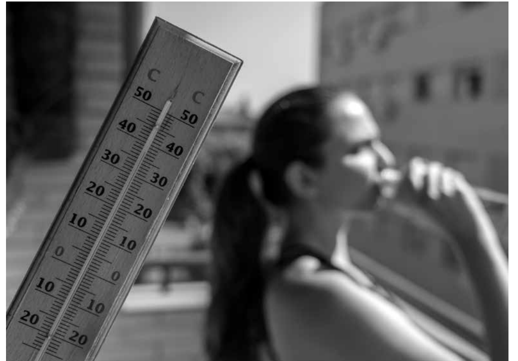
Las temperaturas elevadas en verano.