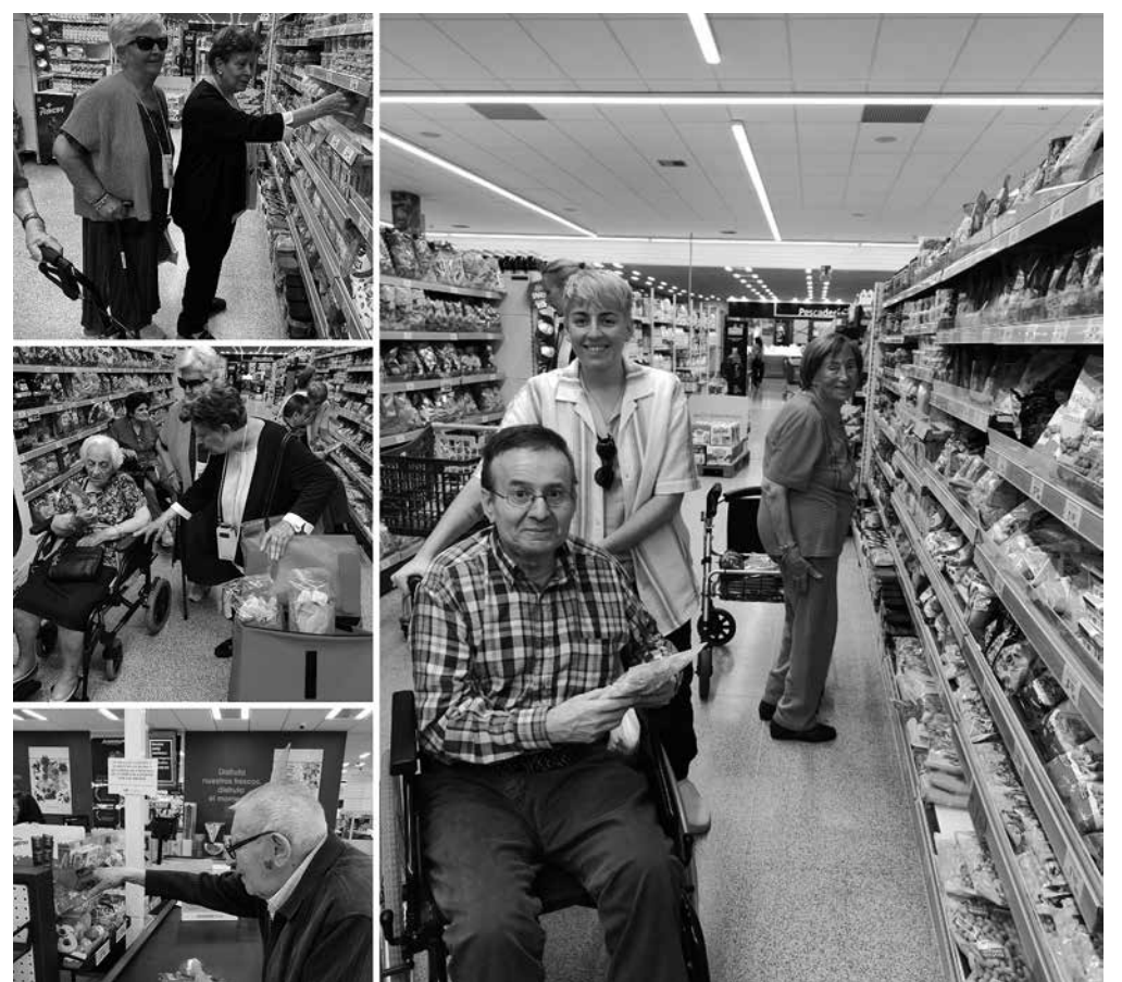
En el supermercado comprando algún capricho.

Desde el Departamento de Terapia ocupacional organizamos de forma periódica una salida al supermercado. En ella acompañamos a un grupo de residentes interesados en realizar pequeñas compras. En esta actividad además de sentirse útiles, se fomenta su autonomía, el correcto manejo del dinero, la capacidad de planificación, se estimula la memoria, la resolución de problemas y además les permite comprarse algún que otro capricho. Sin dejar de lado el aspecto físico que implica el desplazamiento y que siempre es una actividad que deja buen sabor de boca.