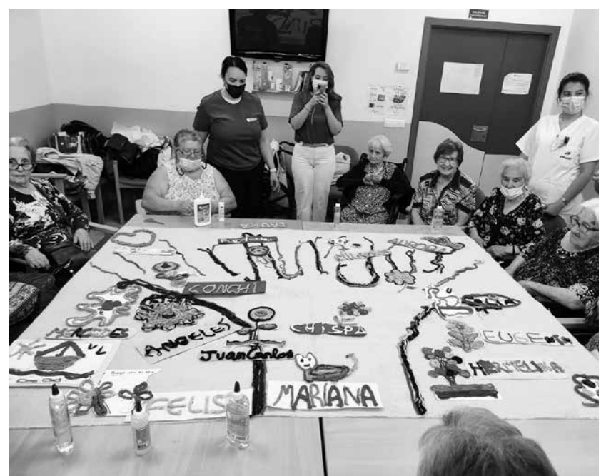
El árbol de Amavir Usera.

El 5 de mayo por la mañana realizamos un taller de arteterapia con nuestros mayores y un grupo de voluntarios. La actividad estuvo organizada por Grandes Amigos en colaboración con los Departamentos de Animación sociocultural y Terapia ocupacional y patrocinada por Aegon. 15 residentes y 12 voluntarios de la empresa patrocinadora participaron en la sesión que estuvo dirigida por una arteterapeuta. Creamos un árbol con lanas de colores en un mural, al que cada residente añadió los dibujos que previamente había elaborado junto a los voluntarios y decorado con lanas de diferentes colores, al igual que sus nombres. Fue una actividad muy bonita y original con la que disfrutaron mucho tanto residentes como voluntarios.