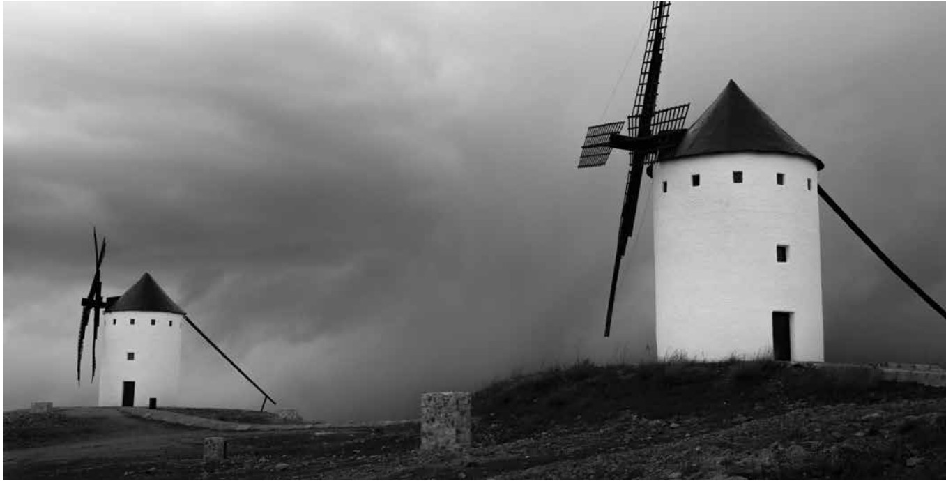
En un lugar de la Mancha... Tomelloso.