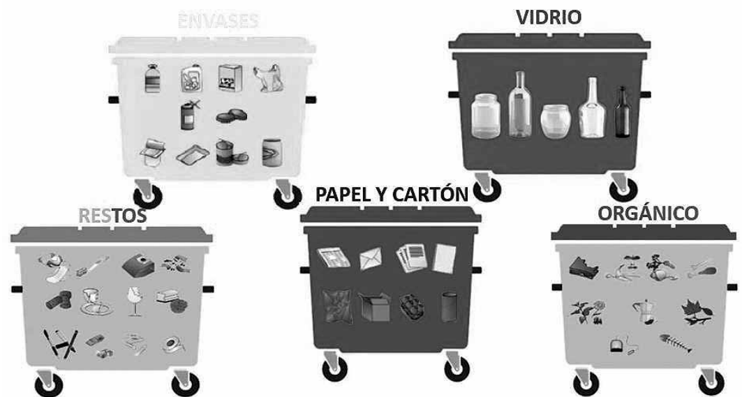
Los modelos de contenedores para reciclar.

Amavir continúa su compromiso y respeto con el reciclaje, certificándose una vez más en la norma ISO 14001 de Medioambiente. Al reciclaje ya existente (contenedor amarillo para el plástico, contenedor azul para el papel y cartón, contenedor naranja para restos y contenedor marrón para basura orgánica), se les añaden cuatro contenedores más para los residuos peligrosos. También disponemos de contenedores para pilas, baterías, fluorescentes, tóner de impresora, cortopunzantes y pequeños electrodomésticos. Entre los nuevos contenedores, uno es para envases de plástico contaminados (productos de lavandería o limpieza sin punto de Ecoembes), otro contenedor para envases metálicos contaminados (algún producto químico derivado de tareas de mantenimiento o pinturas), un tercer contenedor para aeroso-