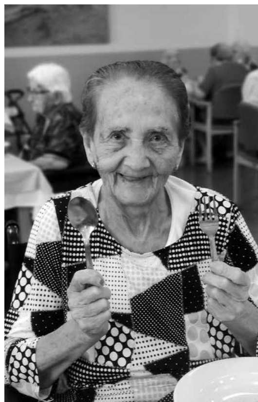
Nuestra andaluza sonriente.

No hay que confundir el salmorejo con el gazpacho, pues en el primero nos debe quedar una textura de crema, más espeso. En un bol, ponemos el pan del día anterior y añadimos el kilo de tomate triturado y dejarlo empapar unos 10 minutos. Añadimos el diente de ajo y trituramos. Añadimos un buen chorro de aceite de oliva y volvemos a pasar por la batidora hasta que sea compacto y anaranjado. Se puede acompañar con tiras de jamón, huevo duro y unas gotitas de aceite de oliva virgen extra.