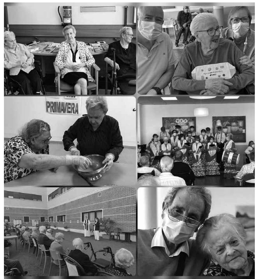
Vivimos abril con intensidad.

Con la llegada del buen tiempo y en plena primavera, en Amavir Usera disfrutamos de un mes de abril lleno de actividades significativas por varios motivos: religiosos, culturales y festivos. La religión tiene un gran peso e importancia para nuestros mayores, a través de ella encuentran consuelo, paz interior, tranquilidad y apoyo. Por ello, la celebración de la Semana Santa tiene un gran significado. Más allá de ser una actividad, se convierte en una continuidad de la tradición dentro de nuestro centro. Como cada año, pudimos disfrutar de un Vía Crucis en el patio acompañado de unas lecturas por parte de trabajadores del centro. Además de todo lo mencionado, la Semana Santa nos trae motivos para disfrutar de un delicioso taller de cocina de postres típicos, torrijas, rosquillas, buñuelos... Tenemos muy presente también la cultura, por lo que el pasado 21 de abril acogimos el Día del Libro realizando varias actividades. Durante ese día se realizó un taller de marcapáginas con diversos materiales con los que dimos una segunda vida a telas viejas. Además, se realizó una lectura en recepción del libro "El Principito", muy conocido por nuestros residentes. Por último y no menos importante, celebramos como cada mes la fiesta de cumpleaños. En esta ocasión, con grandes tintes flamencos, ya que fuimos