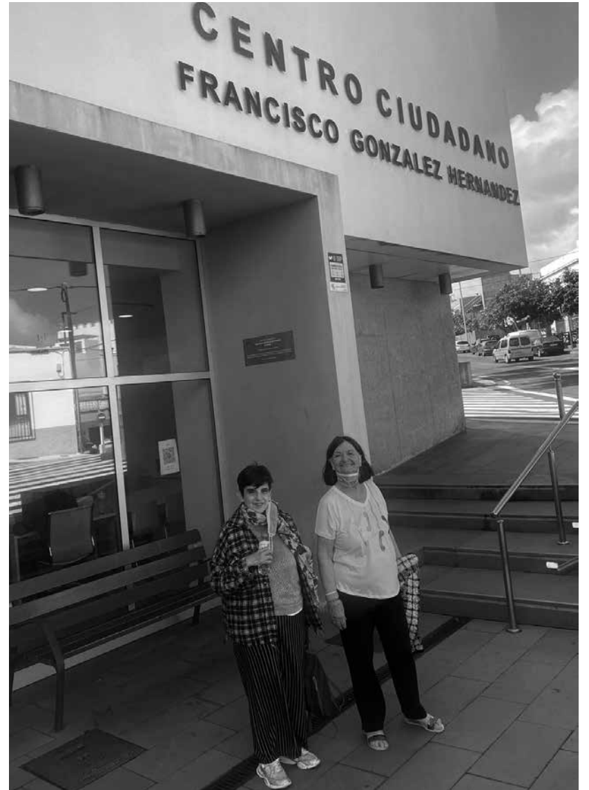
Residentes en el centro ciudadano de Tejina.

Desde el mes de enero y hasta el mes de julio, varios residentes de nuestro centro acuden a una actividad externa realizada en el centro de ciudadanos de Tejina, llamada acondicionamiento físico suave. La actividad está subvencionada por el Ayuntamiento de San Cristóbal de La Laguna a través de la concejalía de Participación Ciudadana, a la que acuden dos veces por semana, guiada por una monitora que realiza diferentes tipos de ejercicios físicos. Las sesiones trabajan las distintas partes del cuerpo y grupos musculares, algunos de ellos muy importantes para el mantenimiento de una postura correcta. Para ello, hacen uso de diferentes materiales como pelotas, pesos, elásticos y sillas, ente otros. Los objetivos específicos son mejorar la tonificación muscular, trabajar la relajación y fomentar la relación con los demás. Desde el Departamento de Animación y del de Fisioterapia somos conscientes de que el envejecimiento es un proceso natural y universal comprendido dentro del ciclo vital de todos los seres vivos, la edad por sí misma no es ningún impedimento ni tiene por qué suponer disminución alguna de nuestra calidad de vida. La salud es uno de los bienes más preciados que tenemos y que debemos cuidar con algo tan sencillo y fácil de realizar como la práctica de ejercicio físico de forma continua. Por eso, consideramos muy positiva la posibilidad de añadir esta actividad al programa de envejecimiento activo.