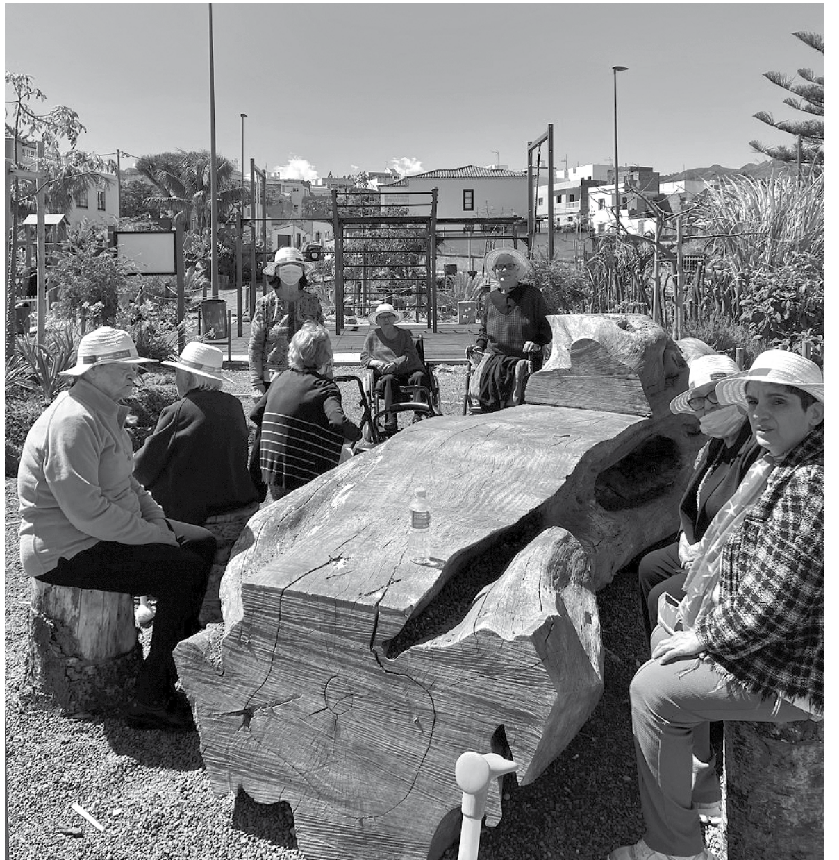
Residentes en el parque de Tejina.

Amavir Tejina visita un nuevo lugar para los tejineros. Se trata de un parque que cuenta con zonas ajardinadas, juegos infantiles y senderos interiores. Todo ello rodeado por un seto y protegido de la cercanía de la calle. La instalación cuenta también con una zona de calistenia, así como con una zona deportiva sobre solera de hormigón con canasta, portería y panel frontal. Asimismo, el recinto posee un sendero interior y otro circundante, accesible a personas con necesidades especiales. Los residentes que participaron en la visita disfrutaron de la jardinería, ya que es uno de los componentes principales del parque, con zonas temáticas como el jardín de flores, el jardín de crasas y suculentas y el jardín húmedo y un numeroso conjunto de árboles y palmeras completadas con arbustos, gran proliferación de tapizantes y vivaces que aportan colorido. Además, tiene tres zonas de estancia con mobiliario autoconstruido de mesas, maceteros y bancos integrados en el espacio natural, donde pudimos sentarnos y descansar de la visita, además de conversar con los compañeros y con los vecinos del pueblo.