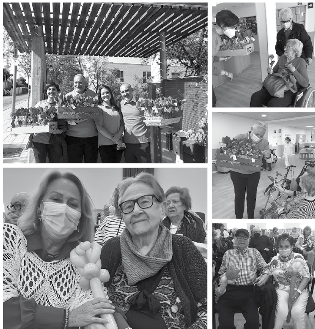
Residentes, usuarios del centro de día y familias disfrutando de las rosas solidarias de Sant Jordi.