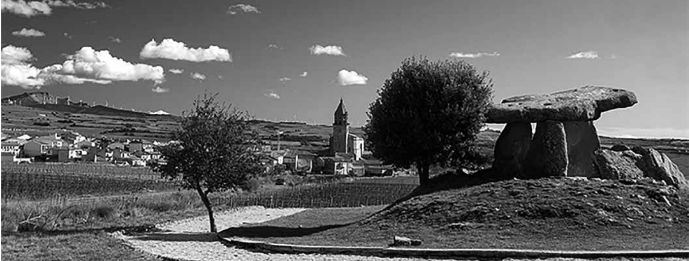
Vistas del Elvillar y del dolmen Chabola de la Hechicera, uno de los dólmenes más importantes del país.