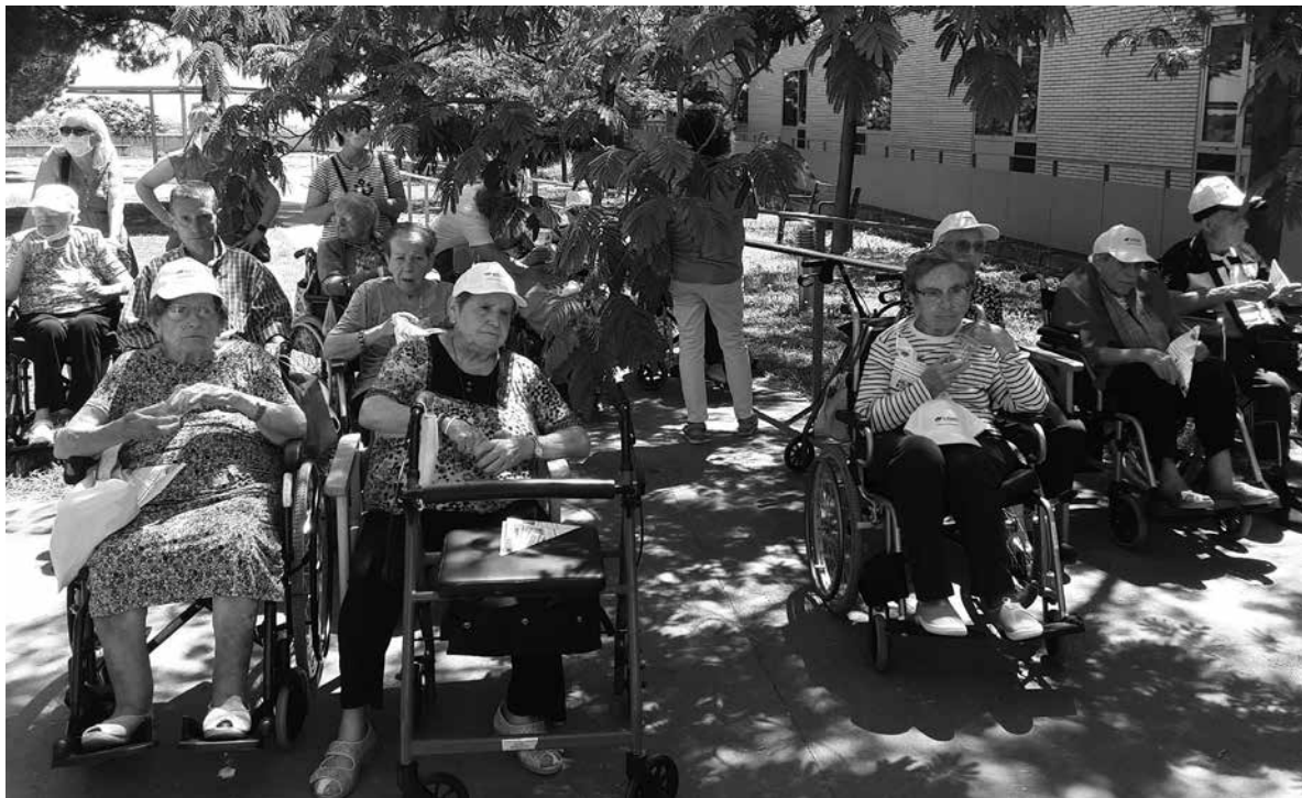
Residentes, usuarios del centro de día y familiares participando en una actividad musical.

Las actividades de ocio son aquellas que se realizan en el tiempo libre, fuera de las obligaciones y ocupaciones habituales. Estas actividades son gratas de realizar, ya que aportan satisfacción y enriquecen como personas. Es por ello que podemos decir que las actividades de ocio son terapéuticas. Sabemos que son muchos los beneficios que aportan a nuestros mayores: activan procesos cognitivos (atención, memoria, recuerdo...), activan procesos de capacidades físicas (musculación, marcha, equilibrio, psicomotricidad...), activan procesos emocionales positivos de alegría que generan las hormonas del bienestar (dopamina, serotonina, endorfinas) y activan procesos de interacción social, incrementando los vínculos con las personas con las que compartimos las actividades de ocio. Estar en el jardín y poder elegir salir al exterior es una formula comprobada y asociada empíricamente con las mejoras del ánimo. También