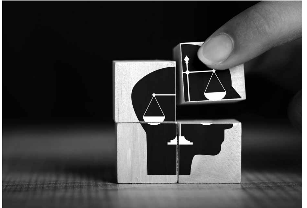
Ética en las residencias.

El Comité de Bioética del grupo Amavir se constituyó en el año 2019 y está formado por un equipo de diferentes profesionales que se encargan de orientar sobre los conflictos éticos que se puedan producir en cualquiera de nuestras residencias. Es un órgano independiente, aconfesional, y tiene únicamente carácter consultivo, correspondiendo a la persona que realiza la consulta tomar la decisión final. Entre sus objetivos más relevantes se encuentran mejorar la calidad de la asistencia que se presta a familiares y residentes, la difusión de la cultura ética en nuestros centros, proteger los derechos de nuestros usuarios, manteniendo su dignidad, integridad y libertad, y orientar o asesorar en los posibles conflictos éticos que se pudieran derivar de la relación asistencial. Tanto familiares, como profesionales o residentes pueden realizar consultas al Comité, que siempre serán tratadas de forma confidencial. Los miembros se reúnen de forma ordinaria una vez al mes, aunque pueden convocarse todas las reuniones extraordinarias que se requieran para tratar cuestiones urgentes. Entre los temas que pueden consultarse estarían las cuestiones relacionadas con la intimidad, la afectividad y la sexualidad