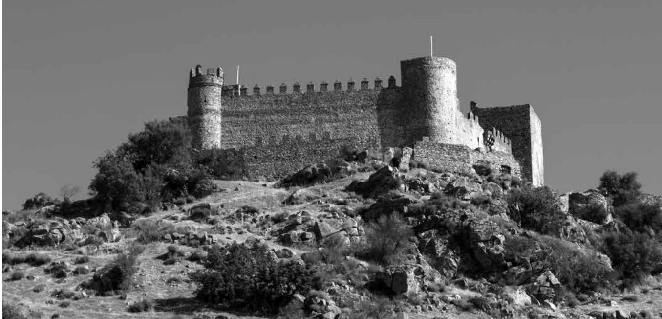
Castillo de Burguillos del Cerro.