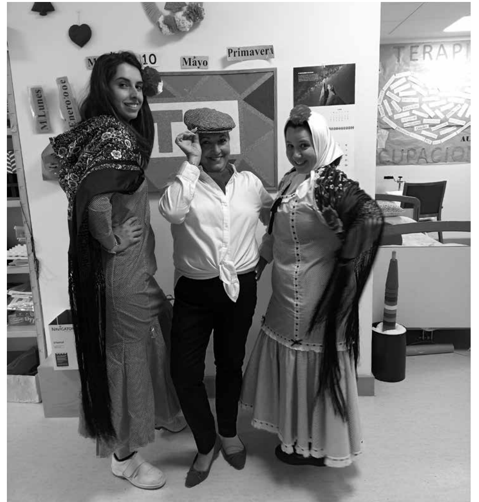
Nuestras chulapas y el chulapo.