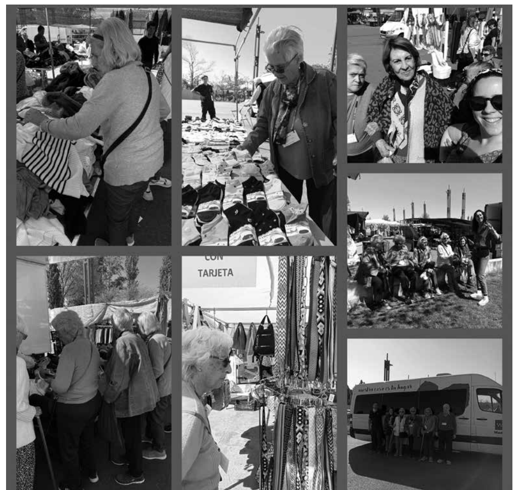
Residentes y usuarios del centro de día realizando sus compras.

Como todos sabemos, fomentar la autonomía es un punto clave que se trabaja desde el Departamento de Terapia ocupacional. Para ello se realizan diferentes actividades tanto en el centro como fuera de este y la última ha sido al mercadillo de Tres Cantos. Allí pudimos llevar a cabo diferentes tareas como: manejo del dinero, socialización, cálculo y aspectos relacionados con las AVDs. Este tipo de actividades lúdicas son muy bien acogidas por todos, ya que nos sacan de las dinámicas y rutinas del día a día. Además, si sumas un picnic en el parque central de Tres Cantos, es un éxito asegurado que tanto profesionales como residentes no dudaremos en repetir.