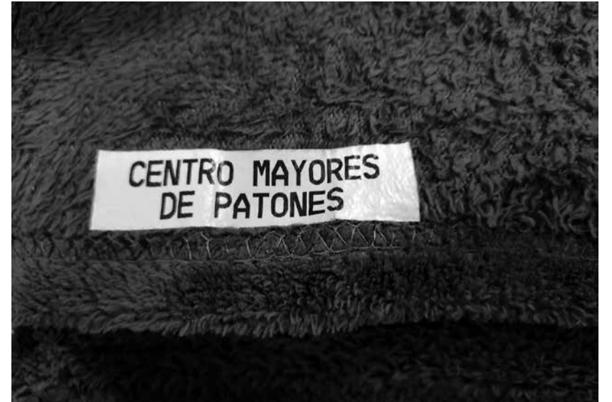
Cuidando sus cosas.

informático que imprime el nombre con una tinta especial. Después, utilizando una plancha a altas temperaturas se consigue que la etiqueta quede completamente incrustada en la prenda. No duden en consultar con las coordinadoras cualquier duda al respecto. Recuerden no dejar en las habitaciones ropa o enseres sin marcar. Ni llevárselos sin aviso, comentarlo siempre en recepción para su revisión y apunte en el registro de pertenencias.