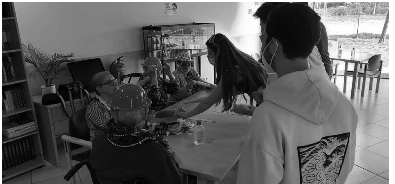
Residentes disfrazados realizando los Tik Toks.

La colaboración con alumnos del ESIC-Club de Marketing consistió en cuatro sesiones de actividades y una de proyección del trabajo final. Las jornadas fueron diseñadas y dirigidas por los alumnos. La primera, una maleta viajera de objetos antiguos del Museo Etnográfico del Reino de Pamplona que trajo reminiscencias a nuestros mayores. Compartieron con los jóvenes su conocimiento de las piezas y sus historias de vida. La segunda, juegos psicomotrices. Jugar es divertido a cualquier edad. Demostraron estar en forma y se divertieron compitiendo.