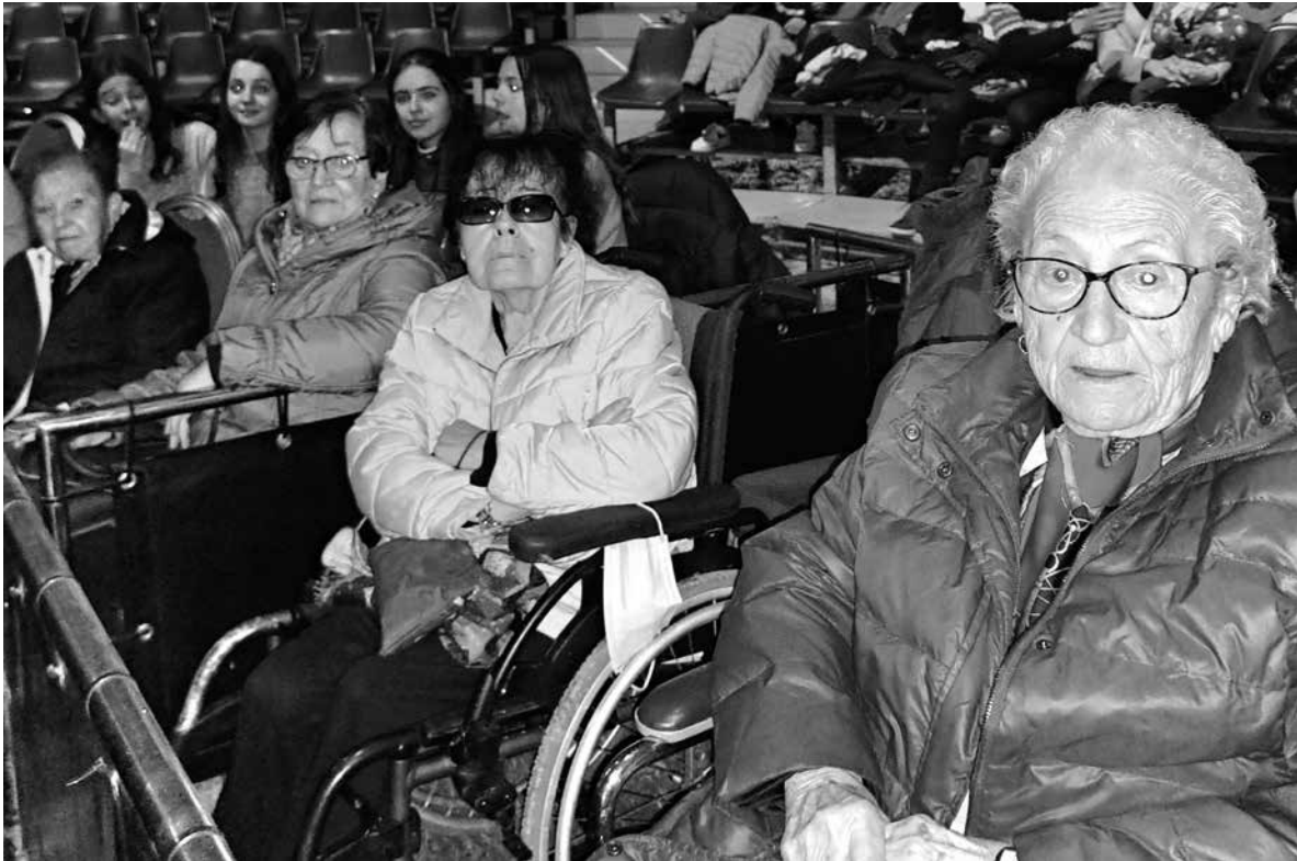
El circo sigue mientras haya quien aplauda a los payasos.

Al igual que el año pasado, el circo estelar volvió este mes de abril a montar su carpa junto a nuestra residencia. El Ayuntamiento nos ofreció invitaciones para que acudieran residentes de nuestro centro. Pudimos acompañarlos junto a un grupo de niñas y niños del colegio Jesuitas de Pamplona. La actividad fue muy enriquecedora. El circo hizo que nos emocionásemos de igual manera que cuando éramos niños e inundándonos con su magia. Este año con su espectáculo “Antártica” disfrutamos durante más de dos horas con una gran variedad de artistas que desafiaban a través de acrobacias, números de magia y payasos. Todo envuelto con una iluminación deslumbrante, una escenografía con glaciares y nieves, un mar congelado, esquimales, pingüinos emperador y osos polares. Desde nuestro centro no perdemos oportunidad y acudimos a todas las invitaciones de eventos culturales, porque nos ayuda a desconectar