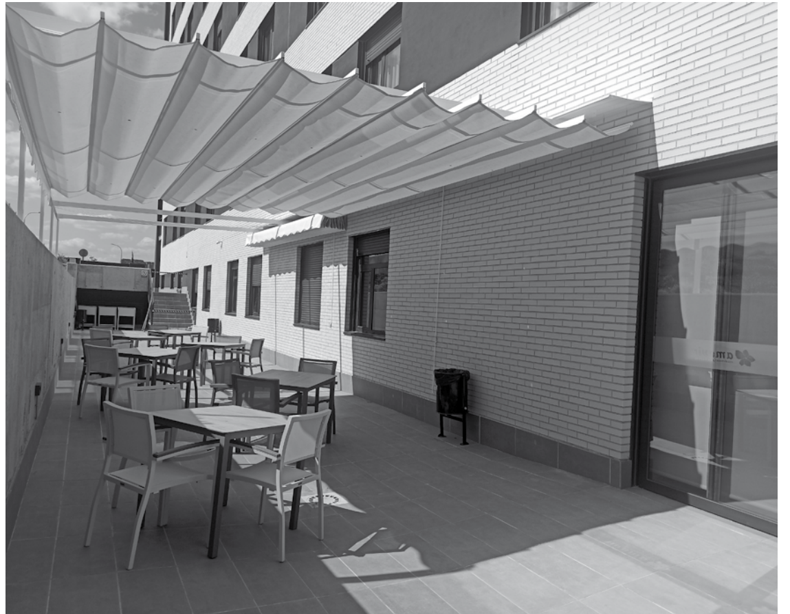
Nuestra estupenda terraza.

El pasado mes de mayo y coincidiendo con la llegada del buen tiempo, inauguramos nuestra bonita terraza, un nuevo espacio en el centro que nos permitirá pasar muy buenos ratos al aire libre. Además, pensando en poder darle a esta zona diferentes usos, ha sido el lugar elegido para habilitar nuestro huerto terapéutico, un acogedor espacio donde nuestros residentes podrán disfrutar de una de las actividades con mayor éxito y acogida cultivando sus propias plantas, hierbas, flores y hortalizas. La idea de este interesante proyecto está enfocada a mejorar la salud física y mental y favorecer la socialización. También se trata de una herramienta muy efectiva para el desarrollo de habilidades útiles como la resolución de problemas, la planificación y la organización, facultades muy positivas a cualquier edad. Ayuda también a mejorar la auto-