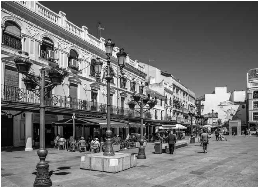
Vista de la Plaza Mayor de la ciudad.

Ciudad Real es una de las capitales de provincia menos conocidas y turísticas, pero con grandes posibilidades para poder disfrutar de la belleza de sus calles, que se pueden recorrer a pie sin problema. Entre los lugares que no deben perderse, se encuentra la Plaza Mayor que alberga la Casa del Arco con el reloj de carillón en que Don Quijote y Sancho Panza cantan una jota manchega cada hora en punto. La ciudad tiene también varias iglesias bonitas como la catedral gótica de Santa María del Prado, la iglesia de San Pedro con un retablo de azulejos de Talavera de la Reina y la Iglesia de Santiago, una iglesia-fortaleza gótica. Otro lugar de visita imprescindible es la Puerta de Toledo, formada por