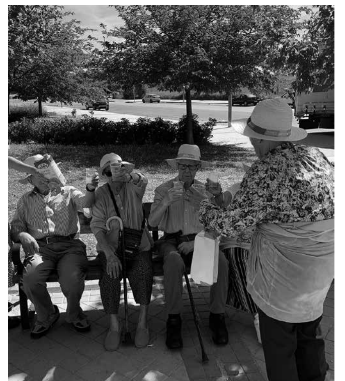
Una parada técnica para hidratarse.

La llegada de la época estival es una de nuestras favoritas del año, puesto que nos permite poder disfrutar de un mayor número de actividades al aire libre, muchas de ellas relacionadas con salidas culturales o paseos por la naturaleza. Una de ellas, ha sido la que se organizó con un grupo de residentes para poder conocer los alrededores del centro. Una pequeña excursión al parque cercano a la residencia donde hubo tiempo para pasear, charlar animadamente con los compañeros y, también, hacer una pequeña parada para reponer fuerzas e hidratarnos con unos zumos. Sin duda, una experiencia de lo más gratificante que, además de lúdica, nos ayuda a mantener un correcto envejecimiento activo.