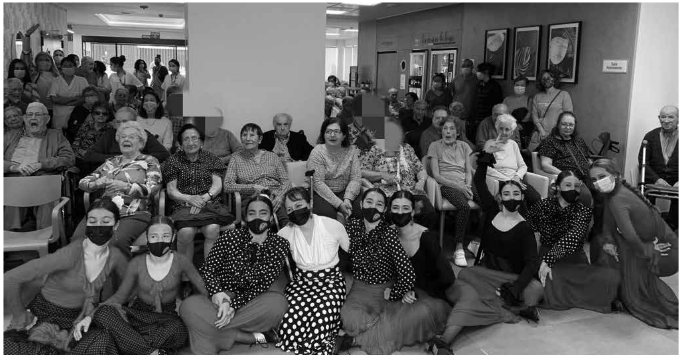
Un momento de la actuación de la Escuela Profesional de Danza Lola Moreno.

Poco a poco, en Amavir La Gavia estamos comenzando a crear nuestra pequeña gran familia con la que, estamos seguros, pasaremos grandes ratos de actividades y celebraciones. Sin ir más lejos, la actuación en directo de la Escuela Profesional de Danza Lola Moreno el pasado mes de abril consiguió un lleno total y, en compañía de familiares y amigos, disfrutamos de una jornada muy entretenida, donde pudimos comprobar el arte que tienen las alumnas. También nos hemos puesto el delantal de cocina para inaugurar el taller de repostería, una de las activida-