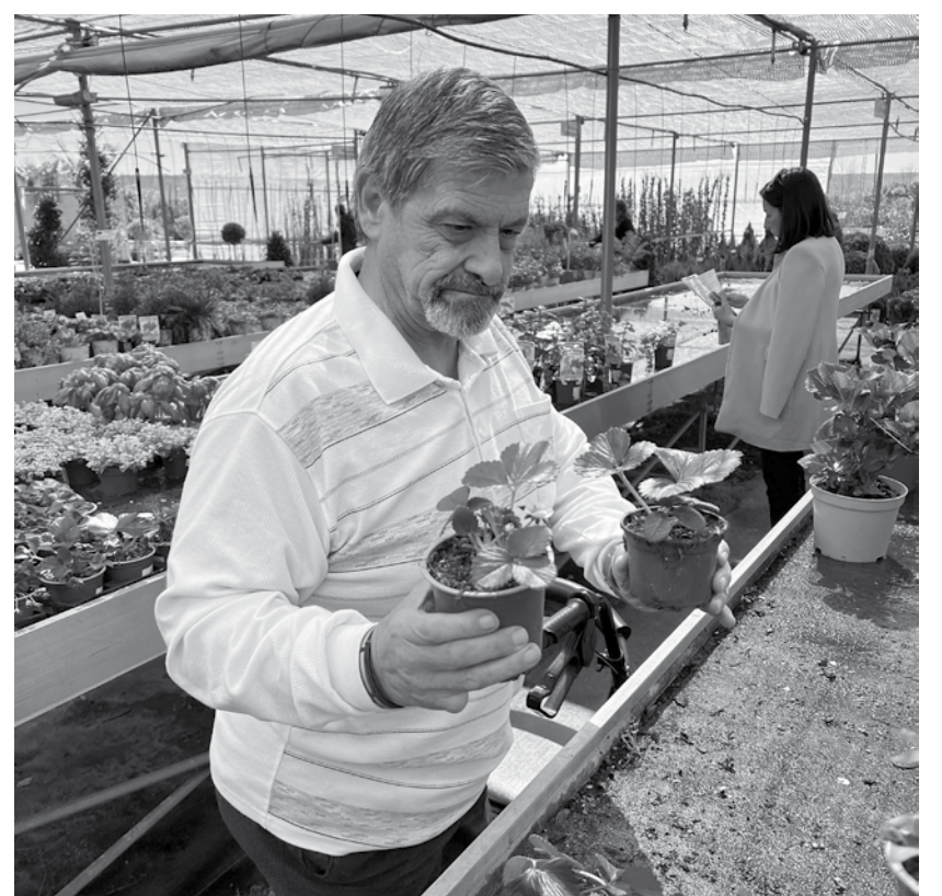
Eligiendo qué sembrar.

Realizamos una excursión al vivero de Cabanillas del Campo, pasando una agradable mañana y decidiendo qué podíamos plantar en nuestro huerto. Nuestros residentes y usuarios de estancias diurnas, fueron muy meticulosos a la hora de decidir qué tipo de plantas comprar según la época del año en la que íbamos a sembrar, teniendo en cuenta su gran experiencia en la labor del campo, pues muchos de ellos se dedicaron a la agricultura cuando eran más jóvenes. Sin duda, una experiencia a repetir de cara al año que viene por su gran acogida por parte de los asistentes.