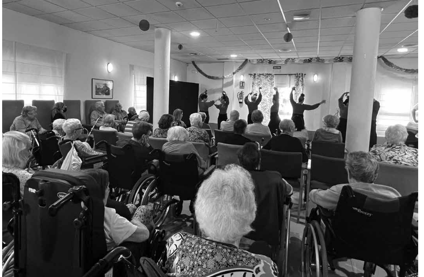
Actuación de la escuela de baile Espiral.

El pasado viernes 5 de mayo en la residencia realizamos una actividad con los alumnos de la escuela de baile de Alcalá de Henares para festejar la Feria de Abril. La hora de comienzo fue sobre las 5 y media de la tarde, después de recibir la merienda. Niñas y mujeres de todas las edades acudieron al centro y nos deleitaron con una exhibición de baile típico flamenco y unas bonitas canciones tradicionales. Otro aspecto a destacar es la gran variedad de trajes flamencos que llevaban las artistas para los diferentes tipos de música con los que nos cautivaron. La actuación fue memorable, agradó a todos los residentes y demás familiares que se encontraban en el centro. Hay que destacar un baile que realizaron con un manto típico flamenco moviéndose