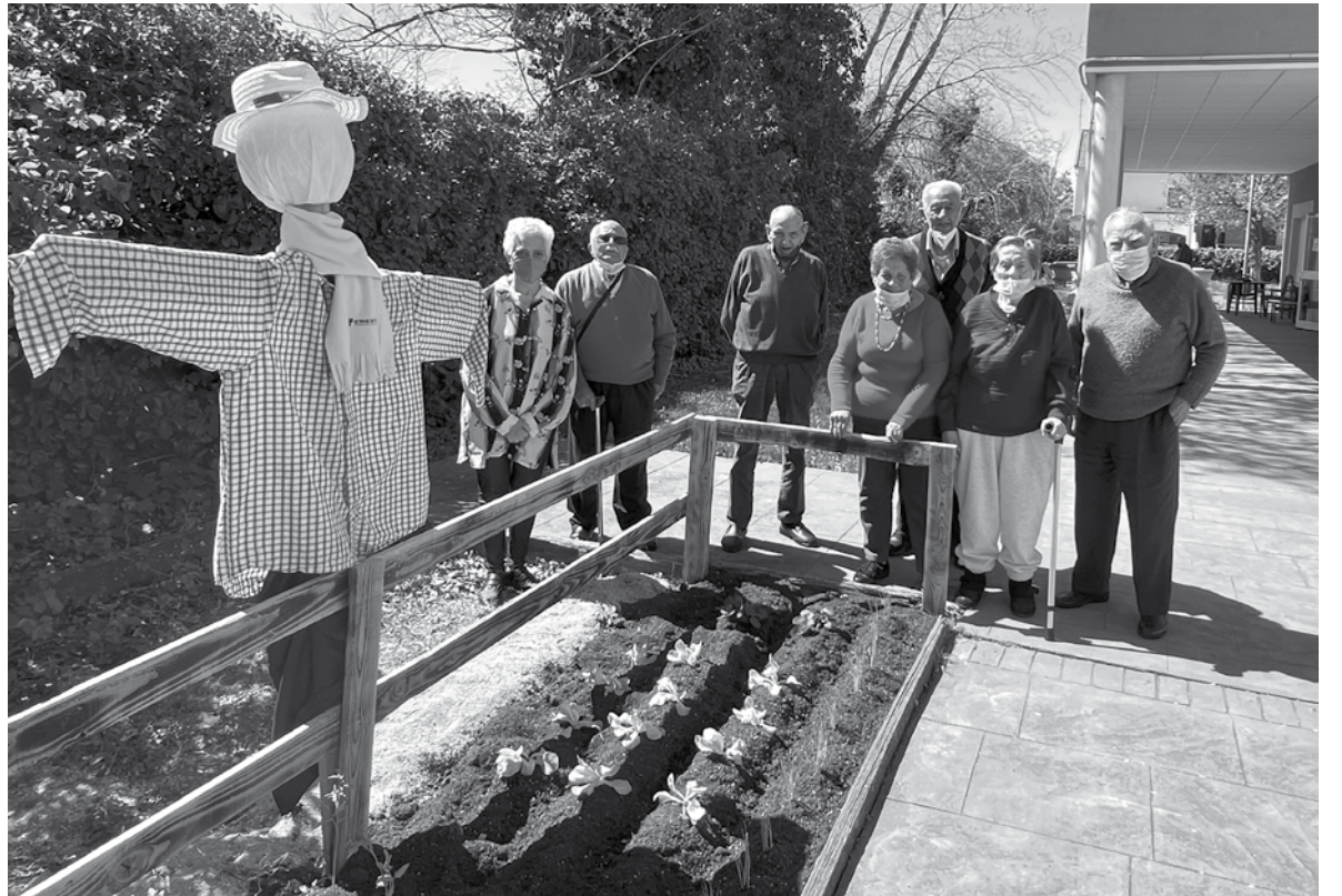
¡Rufino, cuida los pepinos!

Con la llegada de la primavera, nuestros residentes y usuarios del centro de día, se pusieron manos a la obra para crear un huerto en los jardines del centro residencial. En primer lugar, en sesiones de terapia ocupacional, se creó un espantapájaros con materiales reciclados. Quedó tan realista, que los residentes y usuarios lo bautizaron como “Rufino” para que nos guarde los pepinos. En segundo lugar, se hizo el cercado, marcando el territorio donde se plantarían las semillas. Además, se planteó la idea de realizar una excursión a alguno de los viveros, cerca del pueblo de Azuqueca de Henares. Cuando ya teníamos todo preparado y el proyecto en marcha, dos de los residentes con mayor movilidad hicieron los cercos necesarios para el regadío del huerto. Una vez preparada toda la tierra y materiales necesarios, se procedió a la plantación de las semillas y trasplante de las hortalizas compradas en el vivero. Contamos con tomates, pepinos, zanahorias, pimientos, cebolletas, lechugas y fresas. Actualmente, el huerto