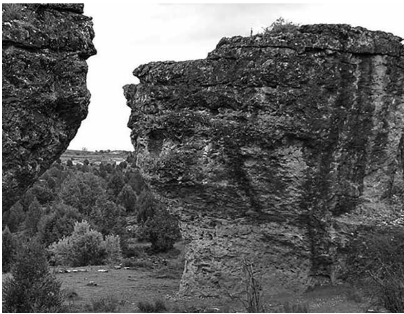
La Ciudad Encantada de Tamajón.

La Ciudad Encantada de Tamajón, en Guadalajara, es un rincón natural de gran belleza incluido en el Inventario Nacional de Paisajes Sobresalientes. Se trata de un lugar único en el cual podrás ver piedras con formas muy curiosas. El lugar se ubica en medio de un paraje natural de gran valor, desde donde podrás disfrutar de las vistas al Ocejón. Se ubica a solo un kilómetro del pueblo de Tamajón. En este lugar te encontrarás en medio de un abundante número de sabinas, enebros y encinas y, con un poco de suerte, te podrás cruzar con algún corzo, búho real e incluso algún jabalí. Es una formación rocosa caliza con cuevas, oquedades en la roca, arcos de roca, dolinas y otras