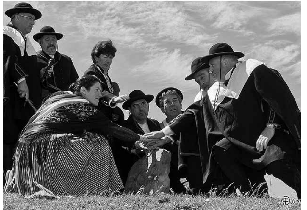
Un momento de la ceremonia para ratificar el tributo.

En la muga fronteriza 262 situada en el collado de Ernaz, se reúnen cada 13 de julio los vecinos del valle de Baretous, en Francia, y los del valle de Roncal, en Navarra, para ratificar el tratado de paz internacional en vigor más antiguo de toda Europa: el Tributo de las tres vacas. A pesar de que se dice que este tratado tiene un origen más antiguo (siglo II a.C.), la carta de paz no se dictó hasta 1375, tras disputas violentas entre los pastores de ambos valles por el uso de las tierras para el ganado. Desde entonces, y de manera perpetua, el valle de Baretous da tres vacas pirenaicas cada 13 de julio a los ciudadanos roncaleses, todas ellas de dos años, con el mismo astaje, pelaje y dentaje. En la ceremonia se reúnen las autoridades de ambos valles, ataviadas con los trajes tradicionales. Una vez allí, el alcalde de Isaba pregunta tres veces a los franceses si ratifican el tributo, a lo que ellos responden que sí mientras colocan las manos una sobre otra, encima del mojón de la muga.