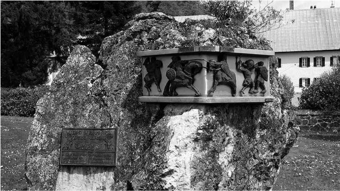
Monumento en honor a la batalla.

Cada 15 de agosto, la iglesia de Santiago de Orreaga-Roncesvalles es el escenario donde se recuerda la cruel batalla que enfrentó a sarracenos y franceses con la lectura del Cantar de Roldán. Ese mismo día, pero en el año 778, la retaguardia del ejército del emperador Carlomagno halló la muerte en el desfiladero de Roncesvalles. Tras destrozarse las murallas de Pamplona a su regreso de Zaragoza, el emperador posicionó a sus mejores hombres en la retaguardia del ejército, comandada por Roldán y los doce pares. Los celos del traidor Ganelón hacia su hijastro Roldán le llevaron