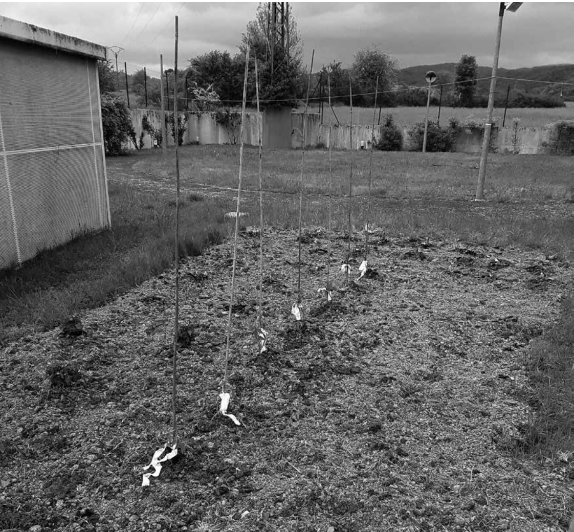
Nuestro pequeño huerto.

Aprovechando los múltiples beneficios que conllevan las actividades al aire libre relacionadas con nuestros gustos y aficiones, en Amavir Ibañeta hemos creado nuestro propio huerto terapéutico, un pequeño espacio donde rememorar viejos tiempos con algunas plantaciones como lechugas, tomates, pepinos y girasol. Los trabajos de siembra, mantenimiento y cuidados que se realizan con ayuda de los residentes favorecen el desarrollo de las funciones cognitivas, permiten mejorar la capacidad de coordinación e incluso la creatividad. Sin duda, se trata de una actividad que, al requerir de hábitos y rutina, potencia un envejecimiento activo, evitando así el sedentarismo. Además, no podemos olvidar la satisfacción que produce el hecho de ver crecer los cultivos propios y, sobre todo, degustarlos. Por todo ello, estamos deseando que llegue la época de recolección para ver el resultado que, a buen seguro, será de lo más gratificante.