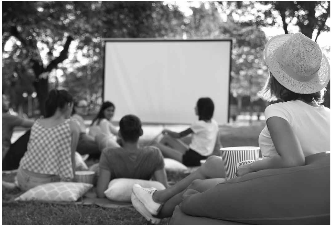
Cine al aire libre.

En el mes en el que nos encontramos se produce el cambio de estación, pasamos de la primavera al verano. A este cambio de estación se le conoce como solsticio de verano. Esta primavera, como ya hemos notado, ha sido bastante calurosa y, es por ello que, desde Amavir Humanes y para celebrar este cambio de estación, nos estamos proponiendo realizar un cine de verano en el cual nos gustaría, no solo que formaran parte de él todos los residentes, sino también los familiares y todo el personal del centro. Además de esta novedosa actividad en este mes de junio se encuentran diversos días mundiales que nos dan ideas para realizar actividades