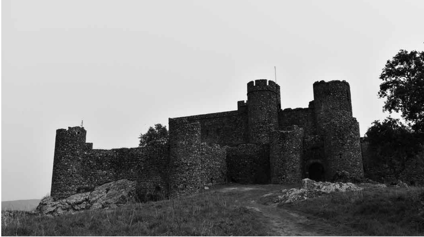
El castillo de Salvatierra de los Barros.