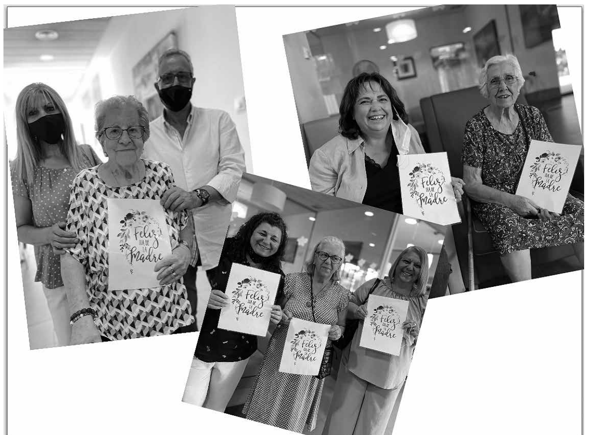
Celebración del Día de la Madre.

Este año el Día de la Madre fue muy especial gracias a la participación tan numerosa en la actividad. Pudimos disfrutar de diferentes experiencias de la época, de anécdotas divertidas y de momentos emocionantes. Tener la oportunidad de poder escuchar y aprender de nuestras mayores fue muy enriquecedor para todos los familiares presentes y, para nosotras mismas. Su forma de ver la vida, la forma de crianza de los niños y la fuerza que han tenido todas ellas es digna de admirar y un regalo para todos los presentes. Después de la charla pudimos disfrutar de una merienda con pastas y café todos juntos de forma más distendida.