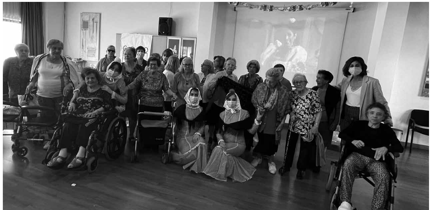
Celebración de San Isidro.

Como cada 15 de mayo celebramos San Isidro trayendo la pradera a nuestro jardín. Disfrutamos del buen tiempo, de la música de organillo y chotis, de una rica limonada y de las clásicas rosquillas listas y tontas. Este año, como dato curioso, os contamos que, se dice que la primera persona que empezó a realizar este rico dulce fue la “tía Javiera”, una mujer de Fuenlabrada que empezó a hacerlas en el siglo XVIII para luego venderlas en Madrid ese día. Y, por otro lado, ¿quiénes eran en realidad las chulapas y los chulapos? Pues las chulapas eran las típicas planchadoras de las Cavas, modistas, fruteras, floristas, cigarreras y lavanderas, de carácter enérgico y alegre. Por su parte, los chulapos tenían un toque de golfería, que en ocasiones rondaba el mundo de la delincuencia. Otra curiosi-