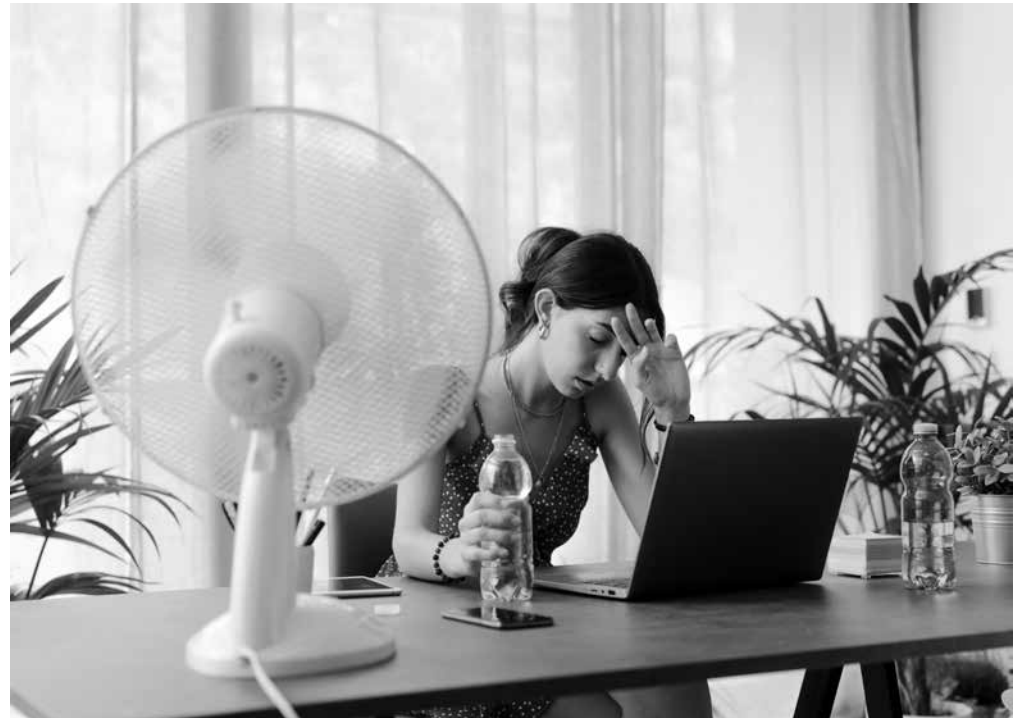
Medidas para combatir el calor.