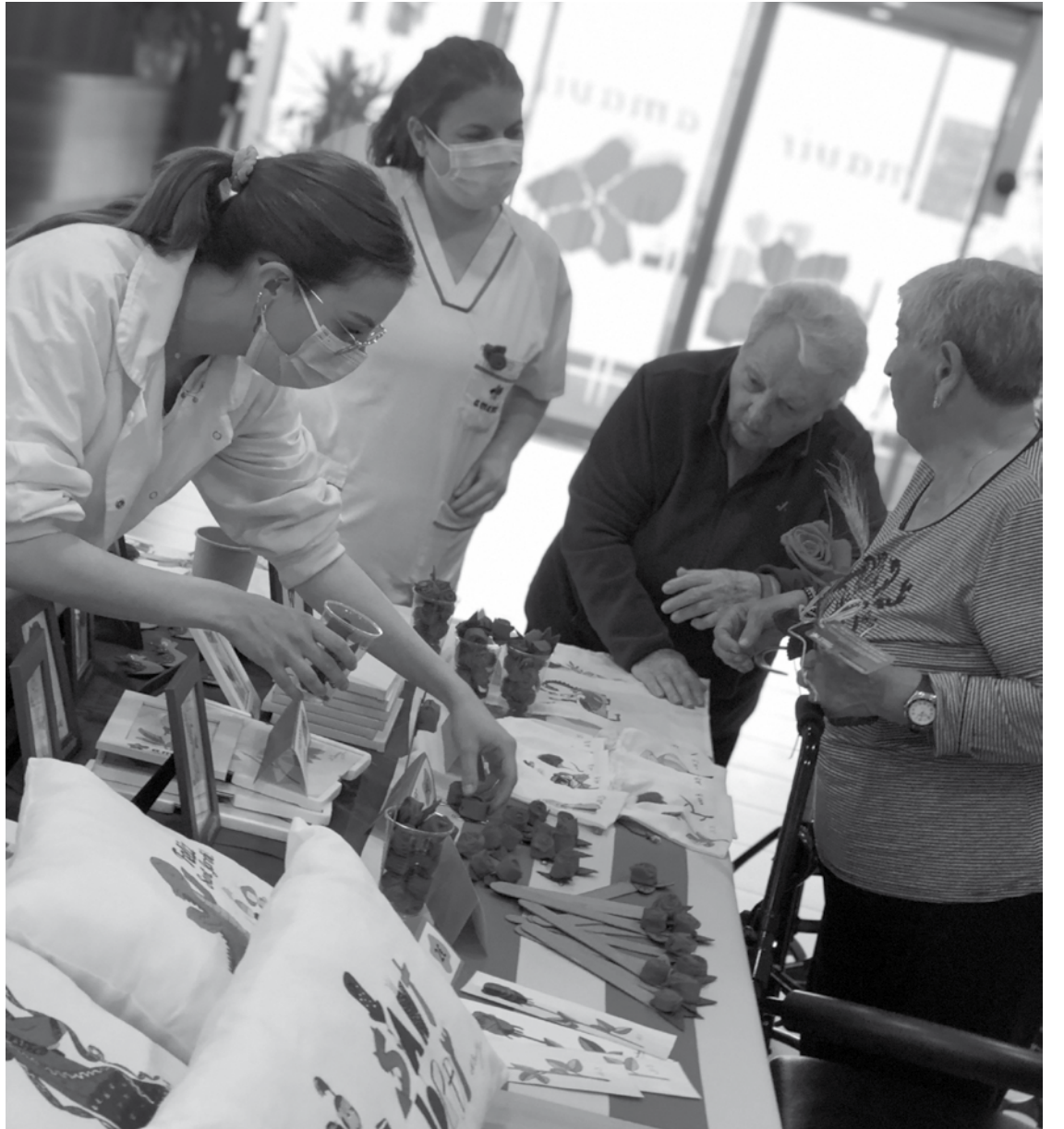
La parada que hicimos entre trabajadores y residentes para el día de Sant Jordi.

Sant Jordi ya es una festividad recurrente en las agendas de todos los residentes de Amavir Horta. Para celebrar el día del libro y de la rosa se organizaron distintas actividades. Primeramente, el viernes 21 de abril se preparó una paradita en recepción donde se vendían todos los trabajos que los residentes habían estado preparando con anterioridad en el taller de arteterapia, para posteriormente ofrecer a la venta. El dinero recaudado se utilizó para invertir en talleres de este tipo, que tanto nos gusta realizar. Seguidamente, el martes 25 se organizaron unos juegos florales para todos los residentes en la sala de actos. Allí participaron tanto ellos como los trabajadores y entre todos construimos un recital de poesía, donde dimos voz a muchos poetas como Antonio Machado, Góngora, Calderón de la Barca, Joan Maragall, etc. Finalmente, pudimos ofrecer a nuestros residentes un espacio de socialización para todos ellos y de celebración de cultura para que pudieran disfrutar de ella, además de trabajar distintas habilidades como la memoria, la retención, la lectura, etc., y distintas habilidades sociales como la expresión oral, la escucha, el razonamiento y la argumentación.