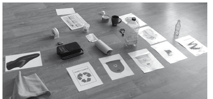
Taller del Día Mundial del Reciclaje.

En Amavir Horta estamos comprometidos con el medioambiente, por eso, desde los distintos departamentos se organizan talleres relacionados con los días señalados. El 11 de abril fue el Día Mundial de las Aves Migratorias. Organizamos un Memory con ejemplares de aves. Esta actividad de estimulación cognitiva trabaja la memoria de forma enmascarada. Mediante el juego estudiamos las distintas aves y entrenamos la mente. El 17 de abril fue el Día del Reciclaje para el que preparamos una actividad de clasificación. Nuestros mayores recibieron una formación sobre el reciclaje y