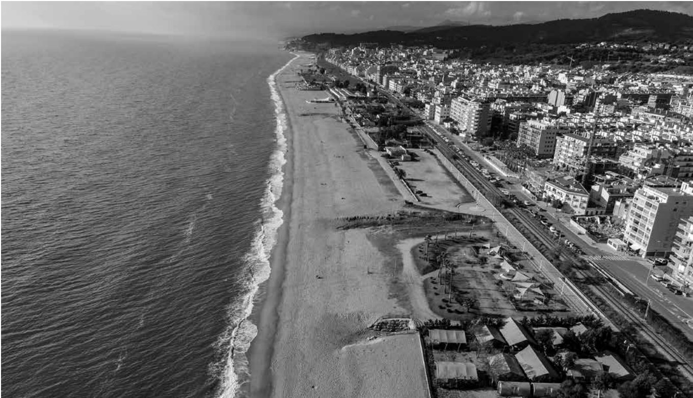
Foto de la playa del Maresme.

El Maresme es una comarca con una gran influencia por el mar Mediterráneo. Tiene muchos pueblos a los que antiguamente se les denominaba de pescadores como El Masnou, los cua-